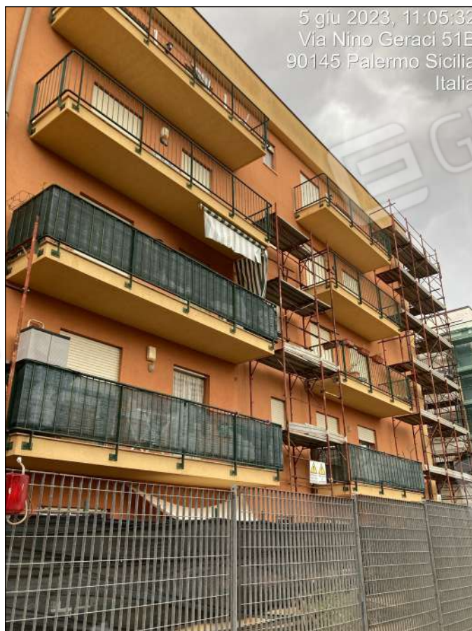
Foto n. 8 - Vista esterna Edificio Scala D