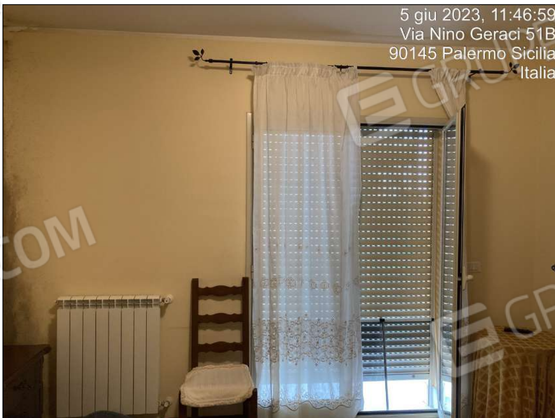
Foto n. 24 - Interni: camera da letto matrimoniale con problemi di umidità/condensa