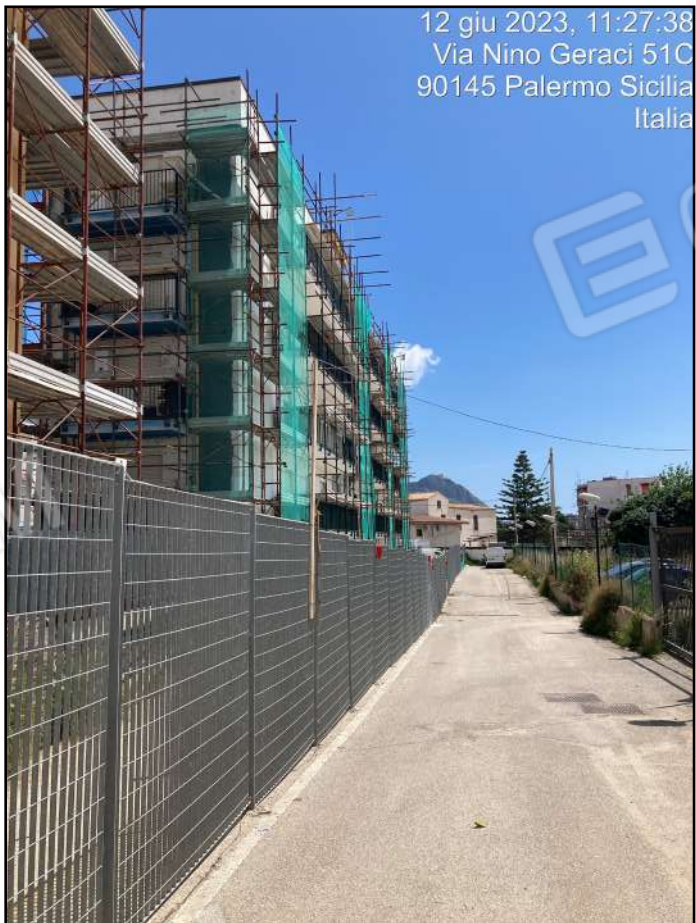
Foto n. 6 - Vista esterna del complesso immobiliare