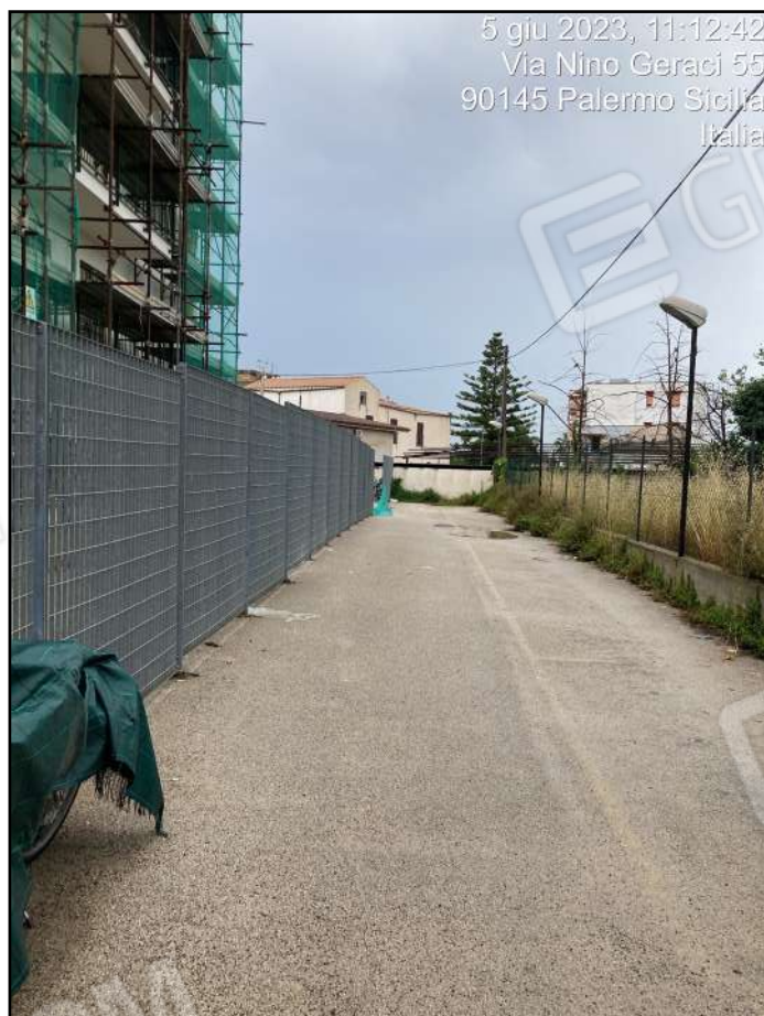
Foto n. 4 - Vista esterna del complesso immobiliare