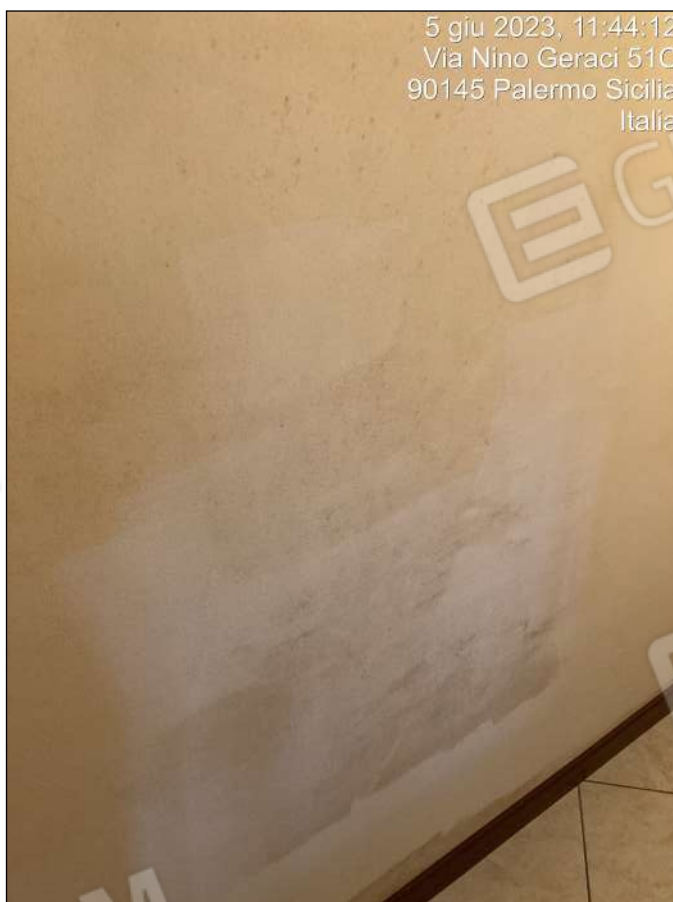
Foto n. 16 - Interni: segni di umidità di condensa lungo il corridoio in corrispondenza dei pilastri