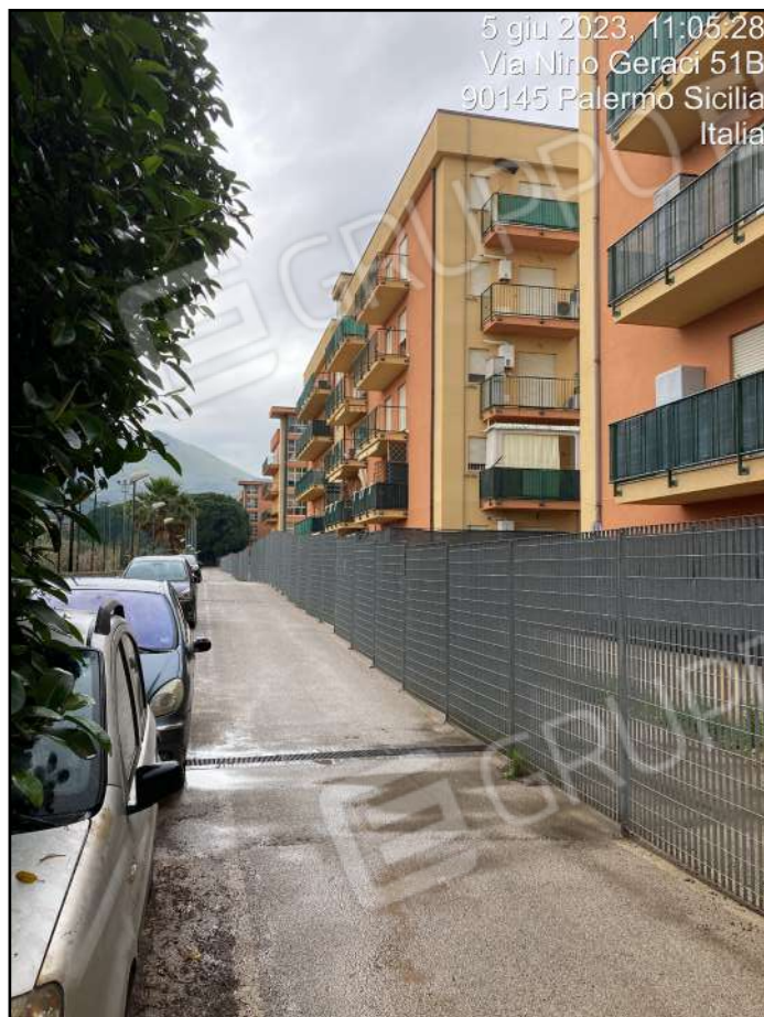
Foto n. 3 - Vista esterna del complesso immobiliare