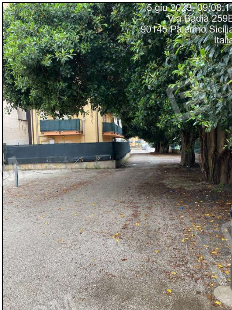
Foto n. 2 - Area comune con parcheggio