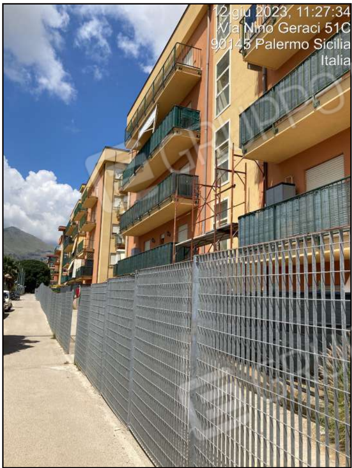
Foto n. 5 - Vista esterna del complesso immobiliare