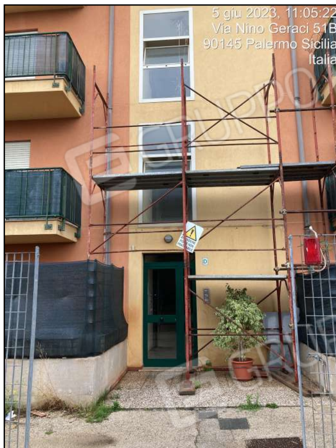
Foto n. 9 - Vista esterna Edificio Scala D