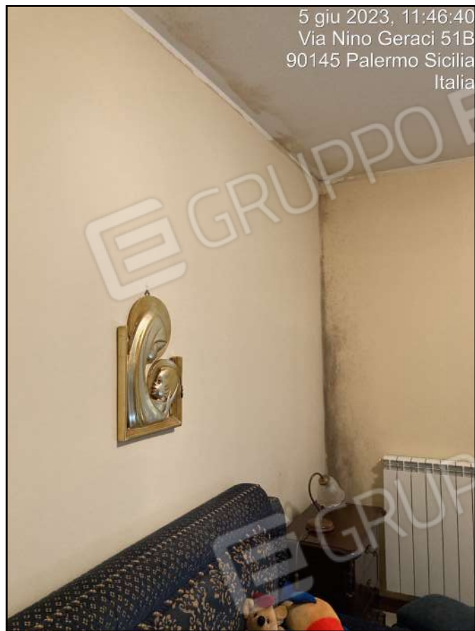
Foto n. 25 - Interni: segni di umidità da condensa nella camera da letto matrimoniale