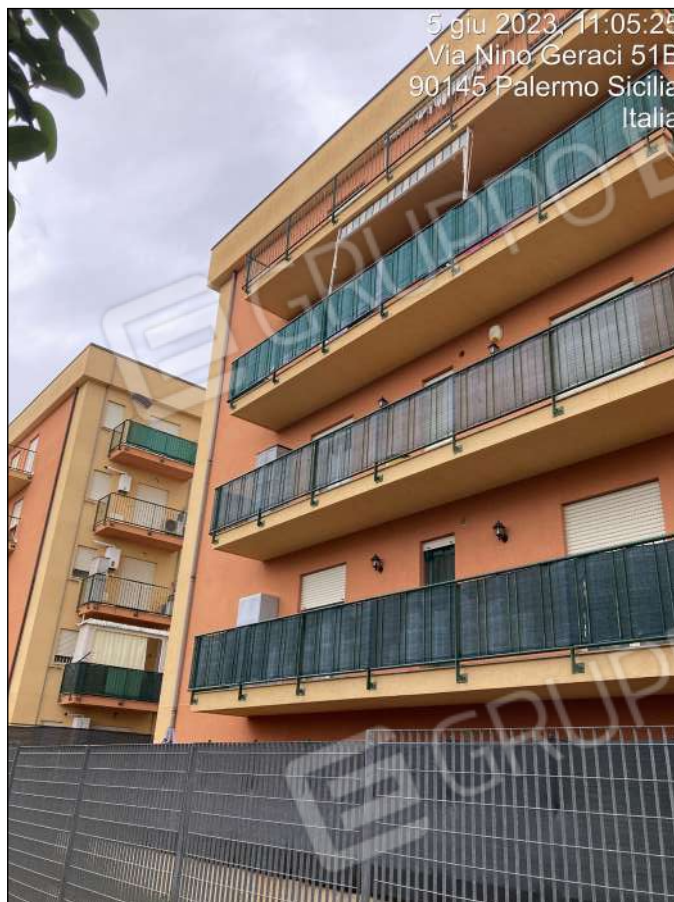
Foto n. 7 - Vista esterna Edificio Scala D