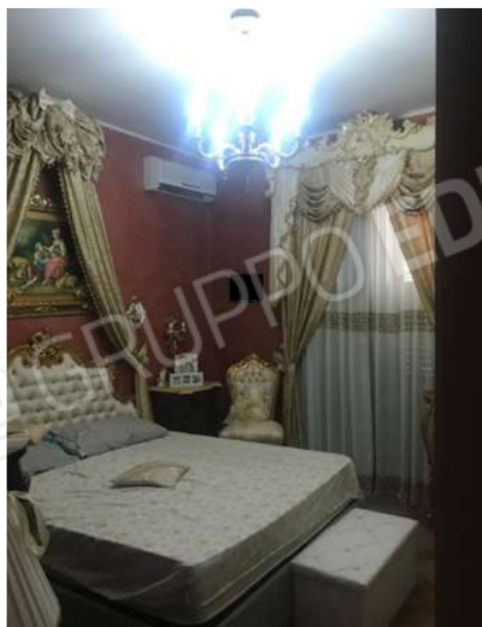
Foto 18. Camera da letto.