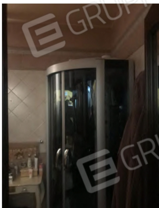
Foto 16. Servizio igienico.