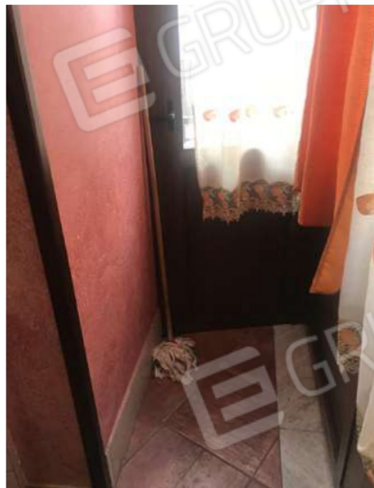
Foto 8. Veranda, accesso al balcone.