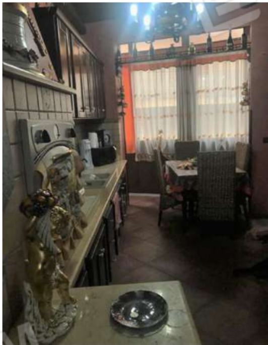
Foto 5. Cucina, vista sulla veranda.