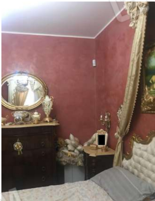
Foto 17. Camera da letto.