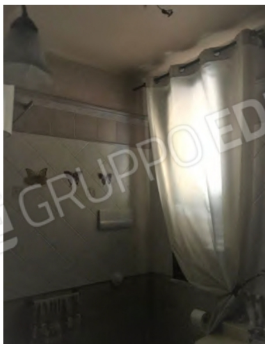
Foto 14. Servizio igienico.