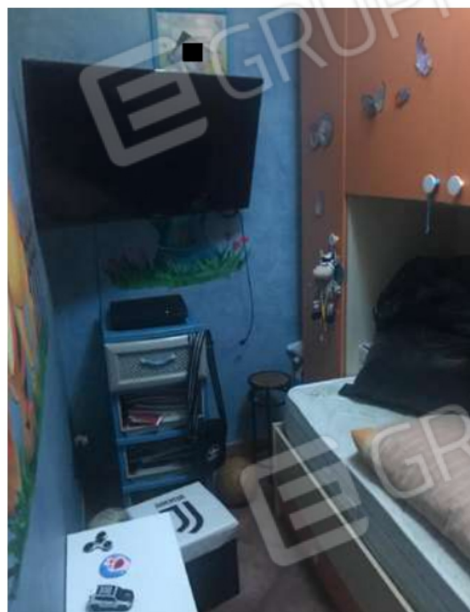
Foto 12. Vano adibito a camera da letto.