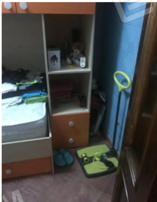
Foto 13. Vano adibito a camera da letto.