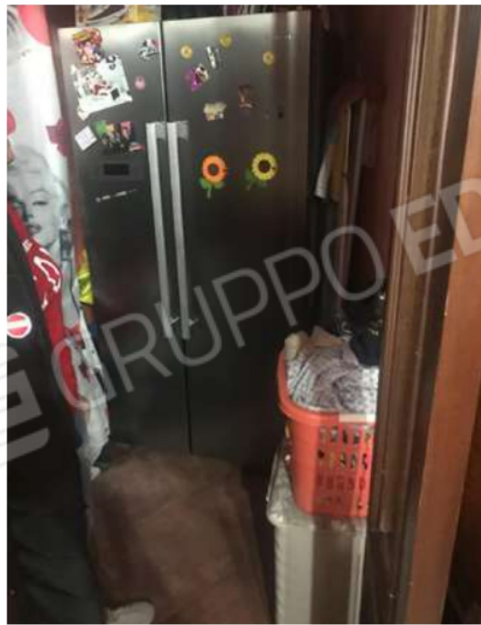
Foto 10. Ripostiglio.