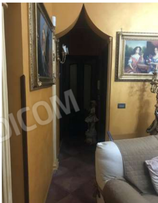
Foto 11. Disimpegno.