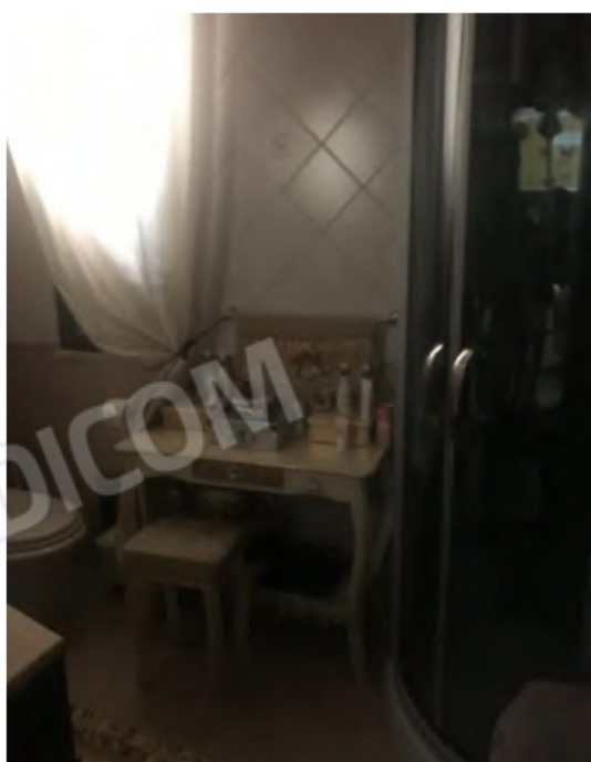
Foto 15. Servizio igienico.