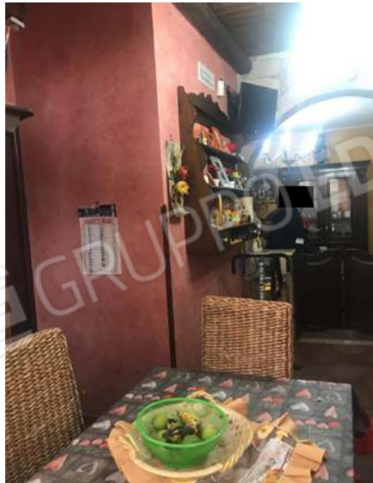
Foto 6. Cucina.