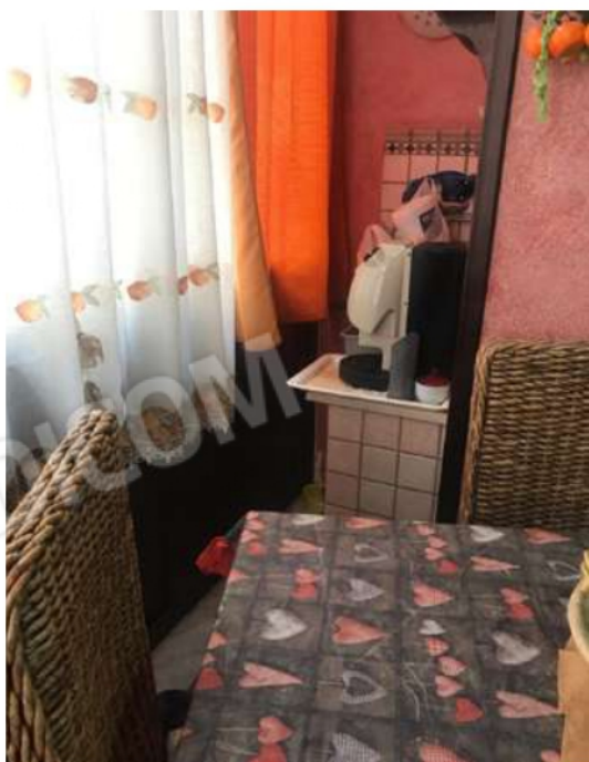
Foto 7. Veranda.