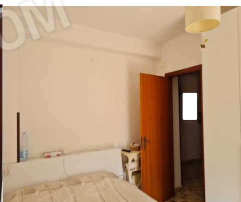
9- Camera 1.