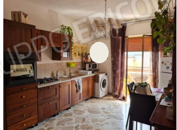
14- K/soggiorno con balcone su prospetto.