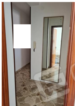
6-Ingresso/disimpegno. 7- Corridoio.