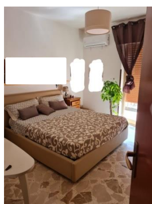
10- Camera 2.