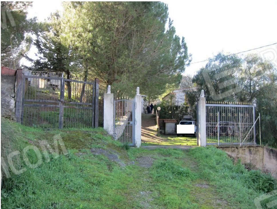
4. Ingresso al lotto