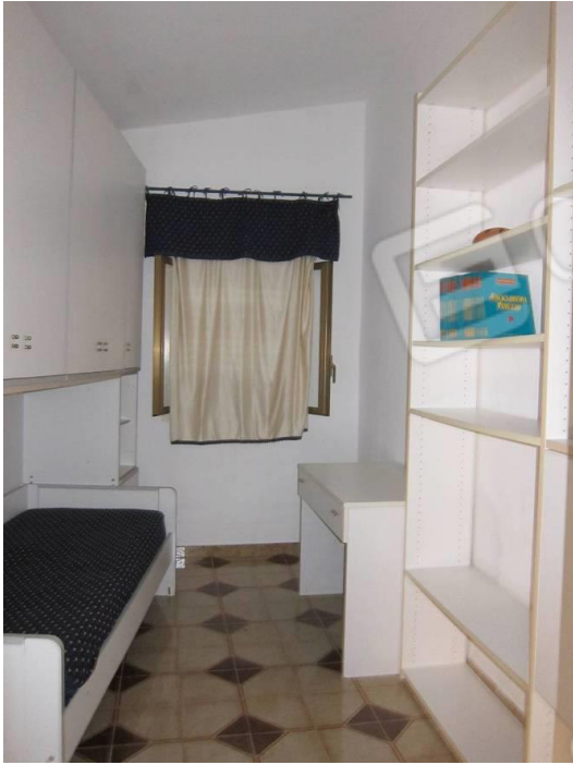
25. Vano 1