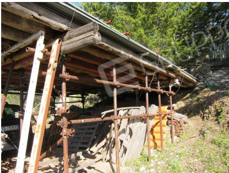
19. Ricovero precario