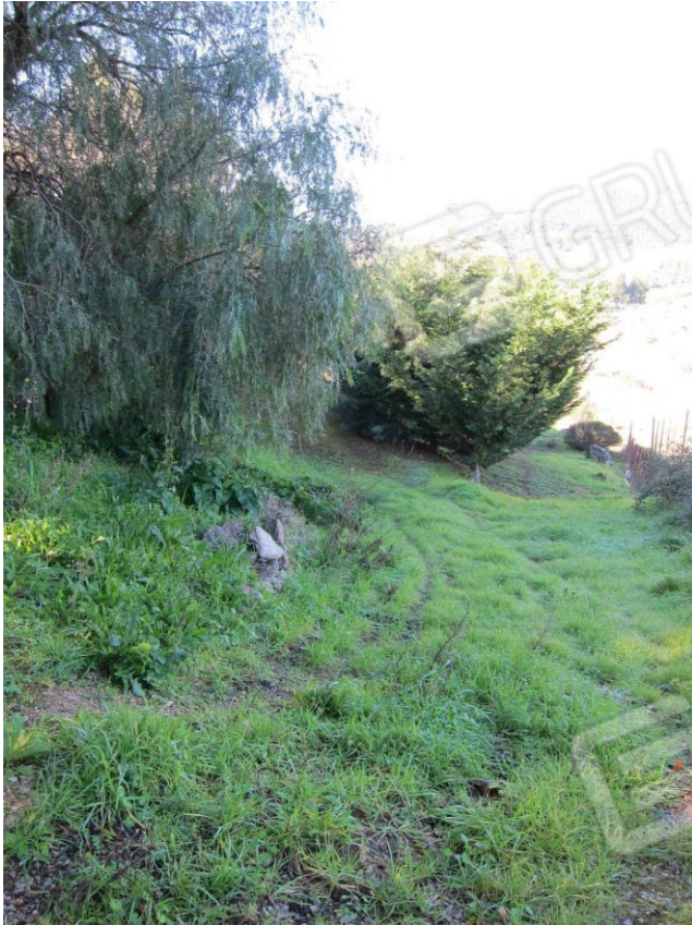
17. Terreno di pertinenza