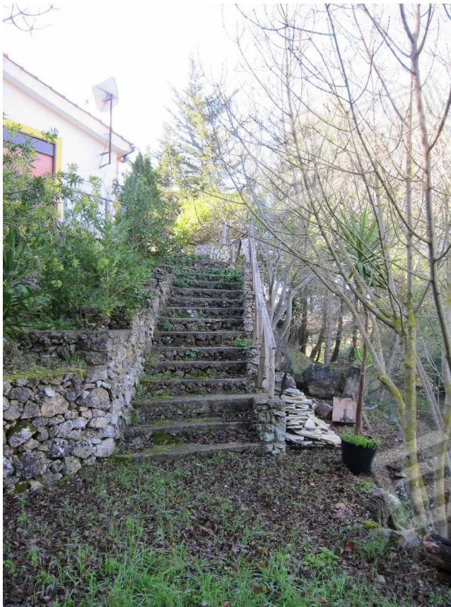
13. Scaletta di collegamento con la zona parcheggio