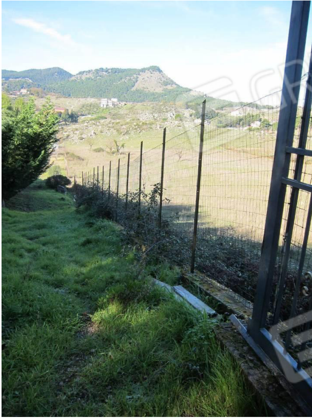
21. Recinzione lato Nord