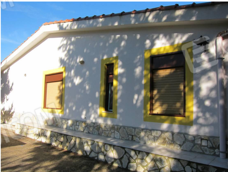
16. Prospetto posteriore