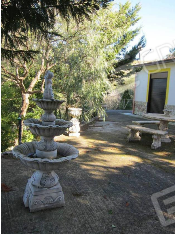
15. Spazio attrezzato