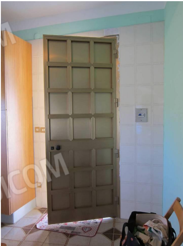
10. Portoncino di ingresso