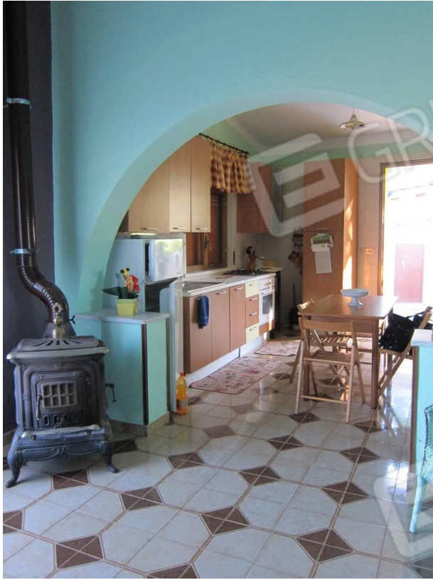
23. Cucina pranzo