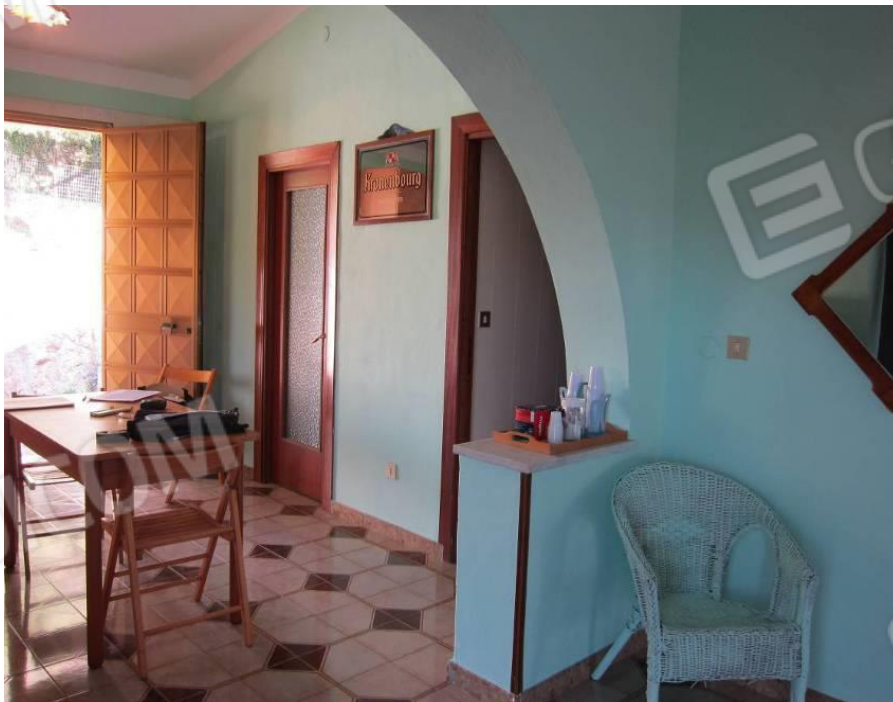
24. Ingressi vano 1 e wc