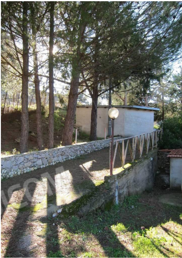
6. Vialetto che porta al piano della villetta