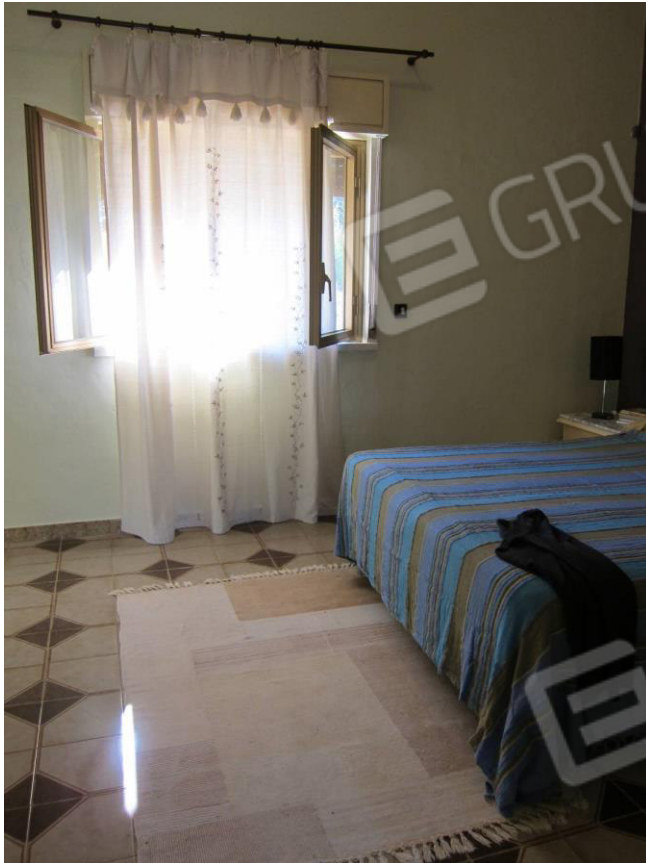
27. Camera da letto