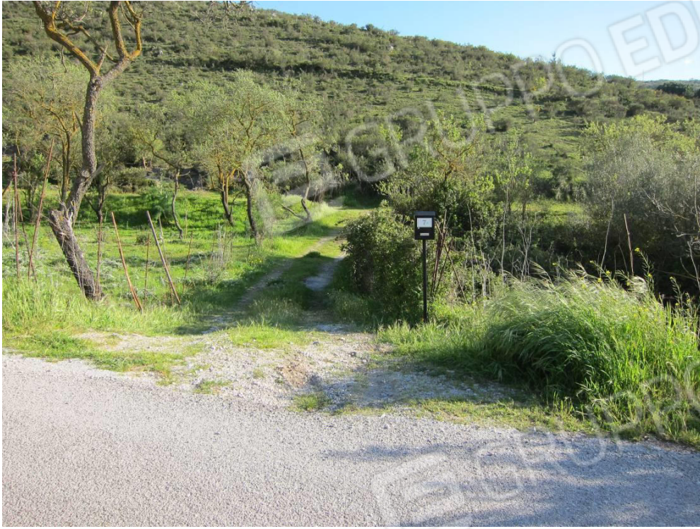
3. Ingresso alla stradella interpodereale