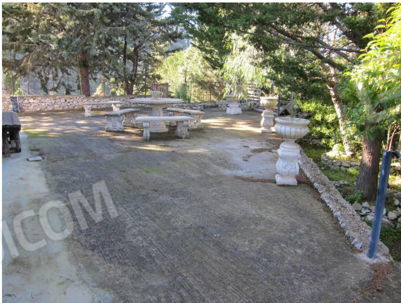
14. Spazio attrezzato