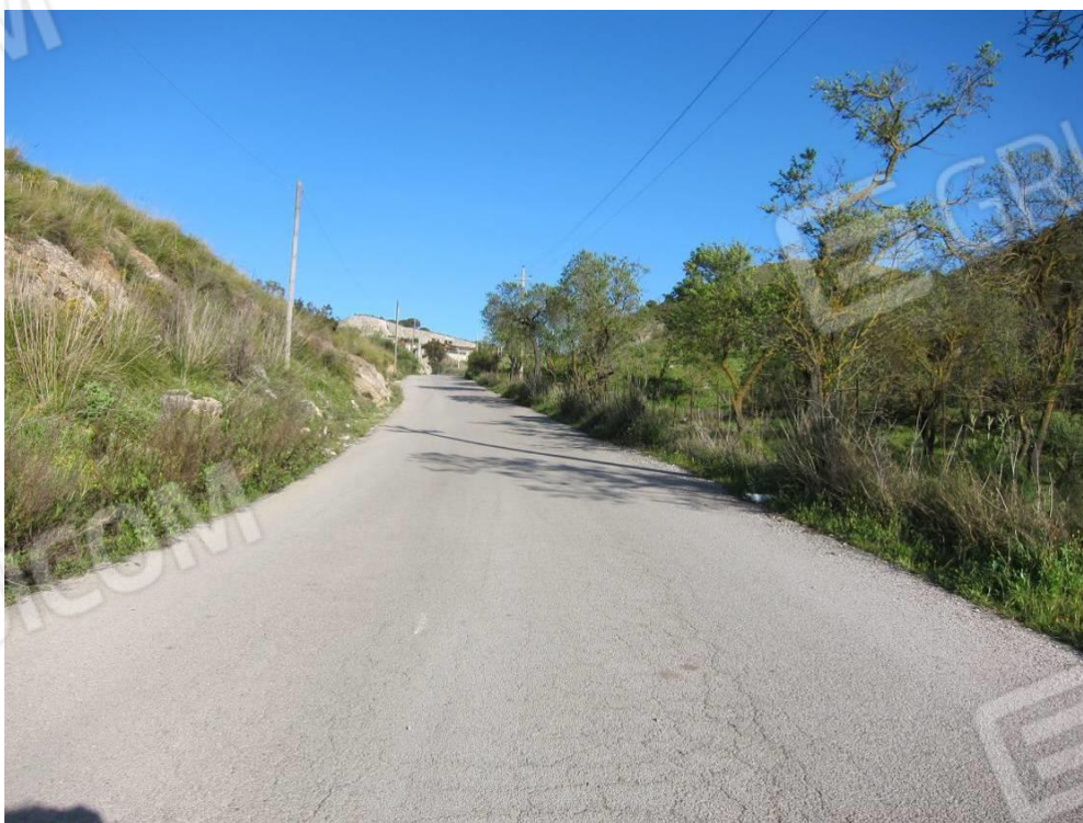
2. Via della Quercia