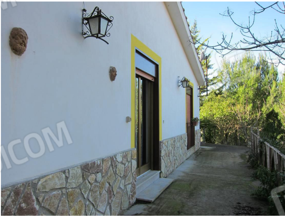
12. Prospeto principale