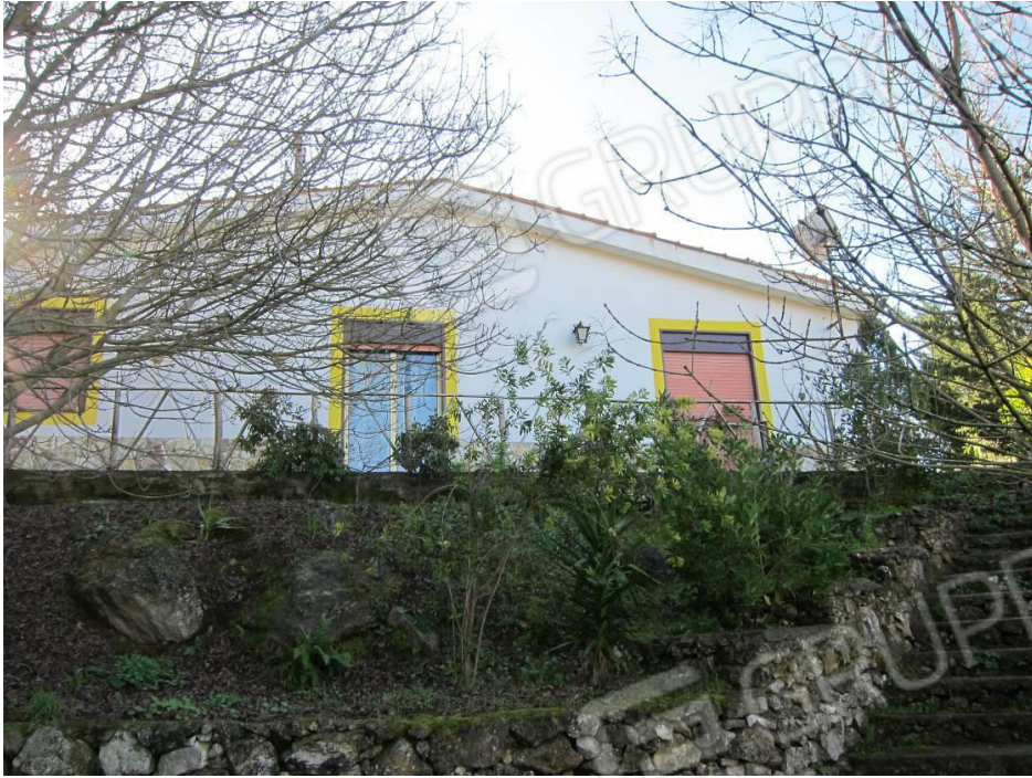
11. Prospetto principale