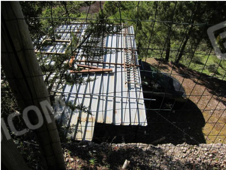
18. Ricovero precario