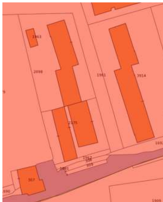
Estratto di mappa