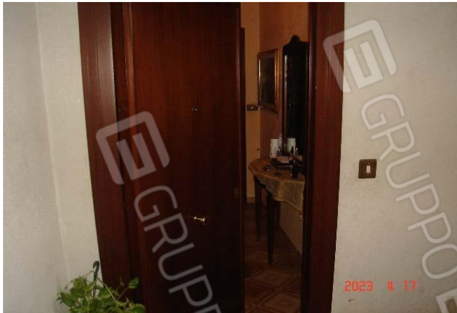
Porta di ingresso