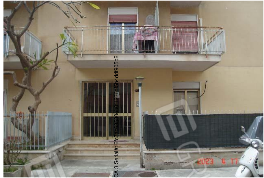
Vista esterna edificio