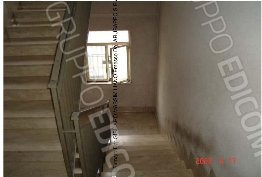
Scala di accesso