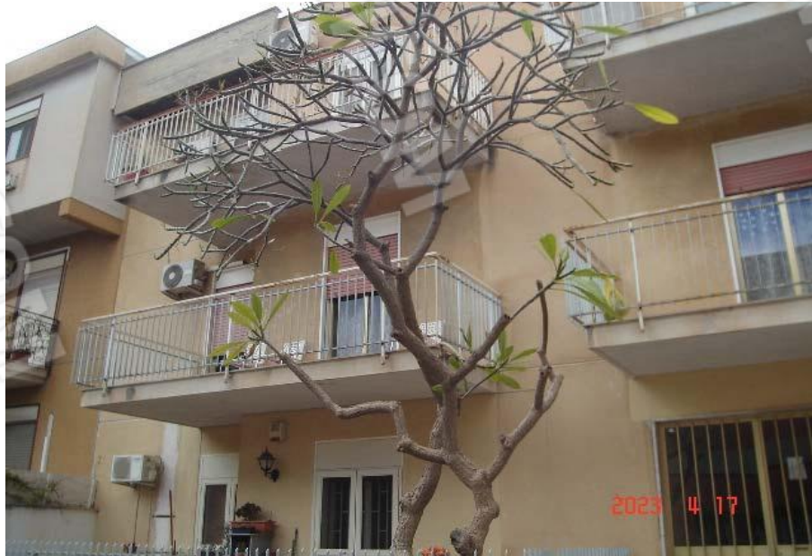
Vista esterna edificio

PIENA PROPRIETÀ PER LA QUOTA INDIVISA DI 1/2 DI APPARTAMENTO SITO IN PALERMO, VIA BUZZANCA N. 32, SCALA C, PIANO PRIMO, INT. 4; CENSITO AL C.F. AL FG. 39, P.LLA 2436 SUB. 14