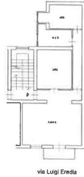
Planimetria di rilievo dello stato reale dei luoghi (all.5)