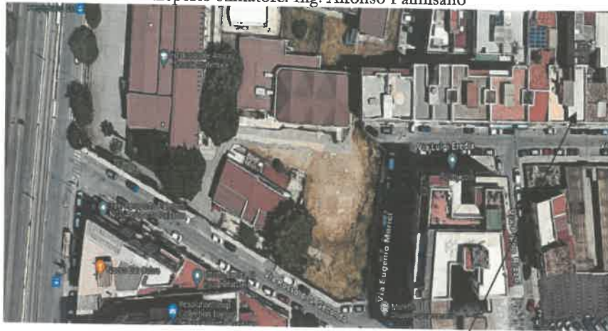
Ortofoto attuale (da Google Earth) (all.2)