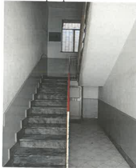
f.to 4-corpo scala