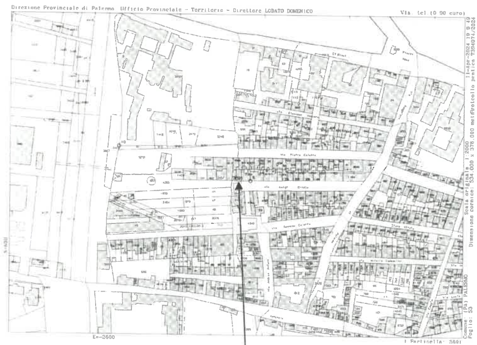
Estratto di mappa (all.3)