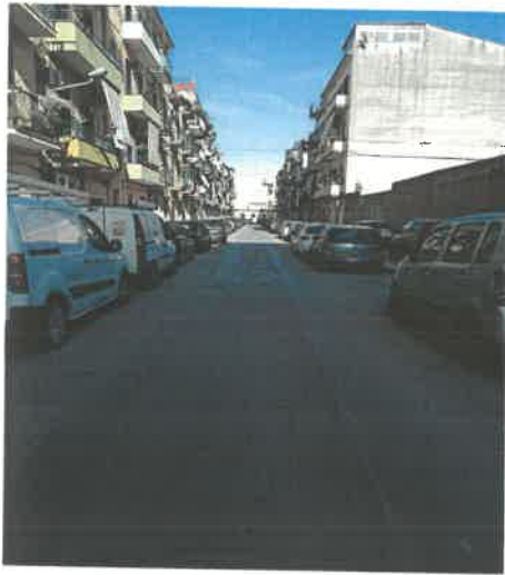
f.to 1-contesto ambientale