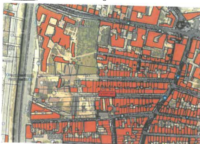
Sovrapposizione ortofoto attuale e mappa catastale tratta da Stimatrix for Maps (all.4)