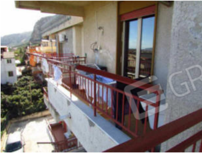
13- balcone cucina.

Locale di sgombero di P-T catastato con il sub. 6: