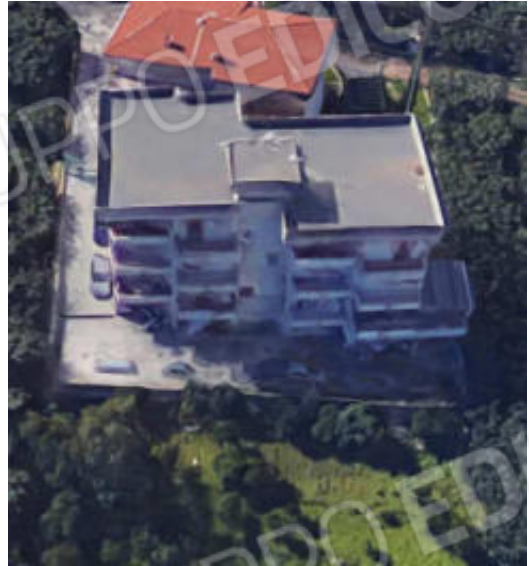
VEDUTA AEREA DEL FABBRICATO.