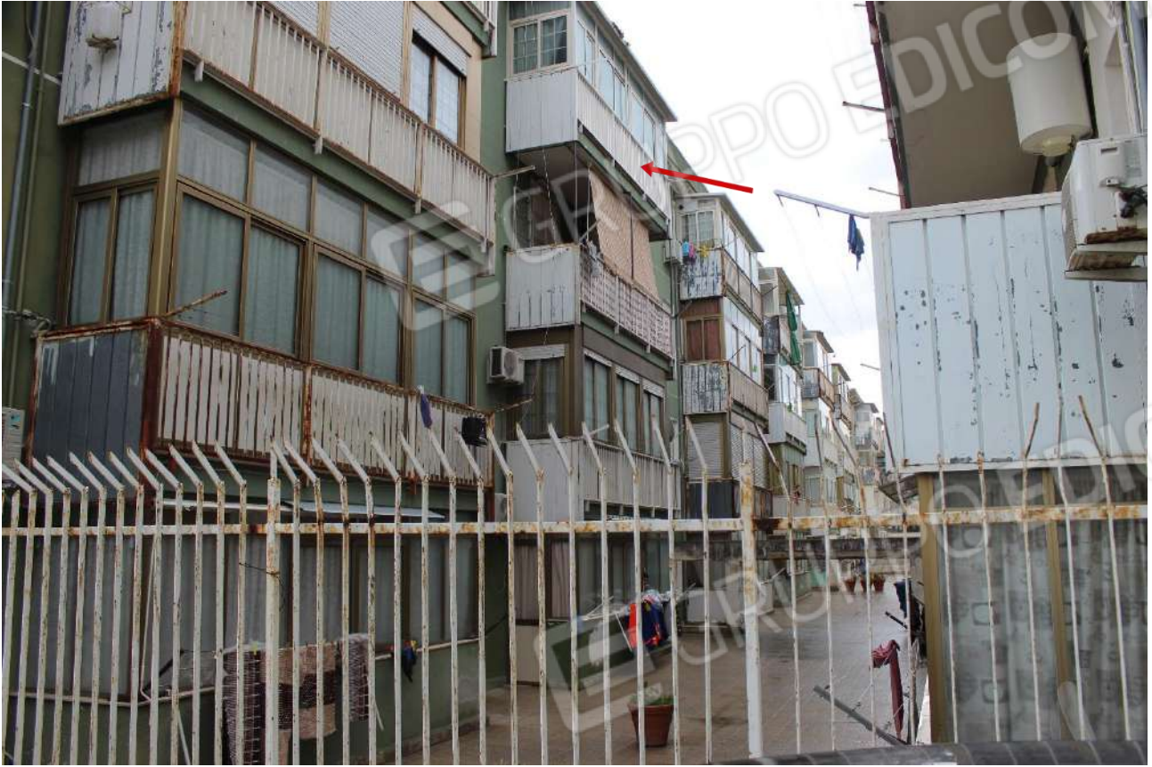
Retroprospetto dell'edificio scala A, a confine con spazi condominiali