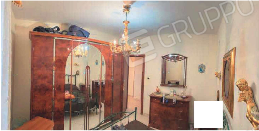
Vano camera da letto