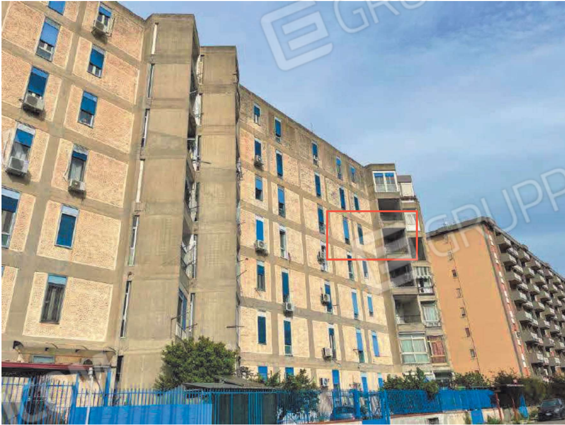
Prospetto Via Lussorio Cau