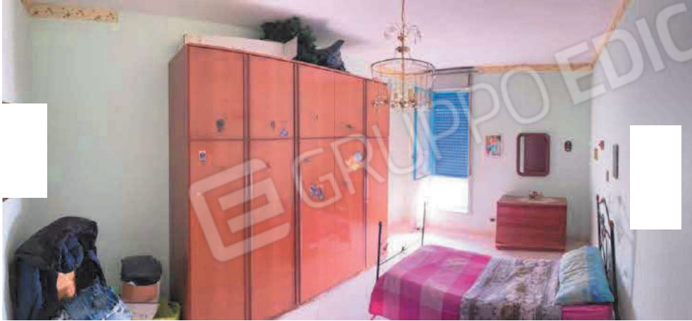
Vano camera da letto