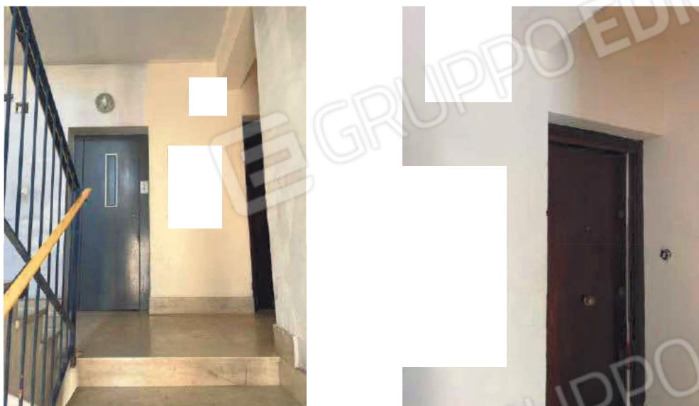
Pianerottolo condominiale di ingresso