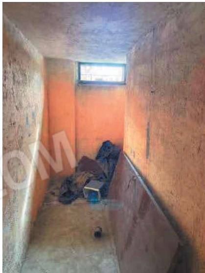
Vano Cantina – Piano S1