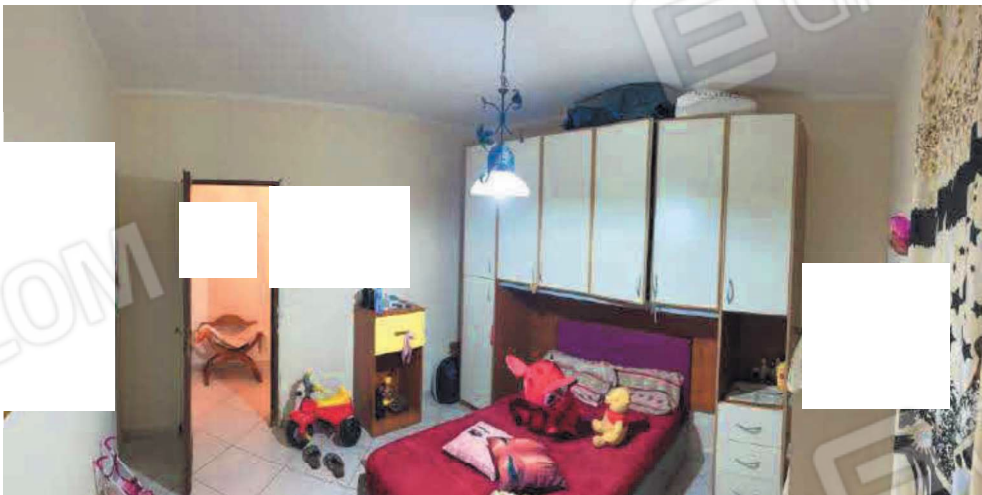
Vano camera da letto