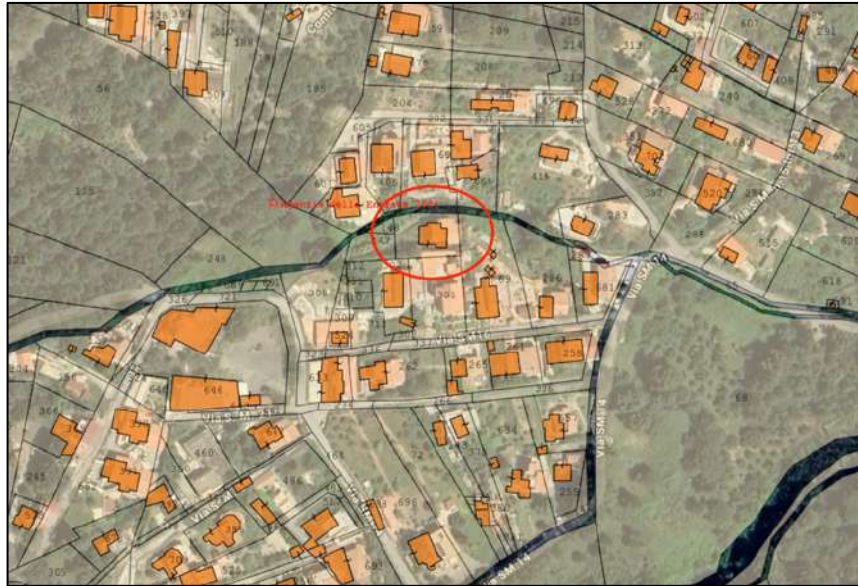
Sovrapposizione ortofoto attuale e mappa catastale tratta da Stimatrix forMaps