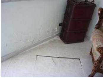
Foto 10 – Pavimentazione e porzione di muro ammalorata nel salone