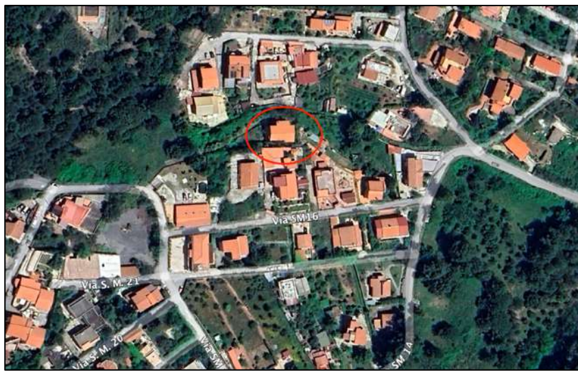
Ortofoto attuale

Ai fini dell'esatta individuazione dell'immobile oggetto del pignoramento si è effettuato un raffronto tra un'ortofoto satellitare attuale e la mappa catastale con l'ausilio del portale Stimatrix forMaps (All. 6), riscontrando la corrispondenza tra quanto pignorato e la situazione reale dei luoghi.