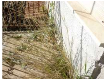
Foto 11 – Presenza di vegetazione in corrispondenza dello zocchetto nel balcone