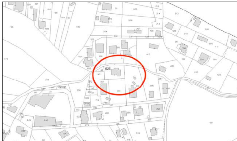
Estratto di mappa catastale