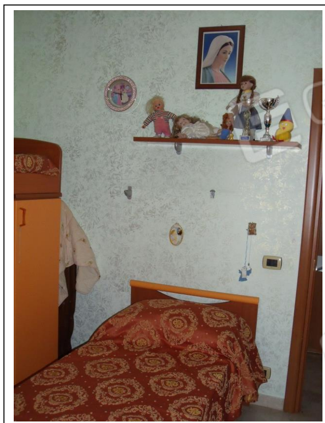
16. Interno u.i. vano camera da letto singola, verso lato O, in foto porta di ingresso al vano.