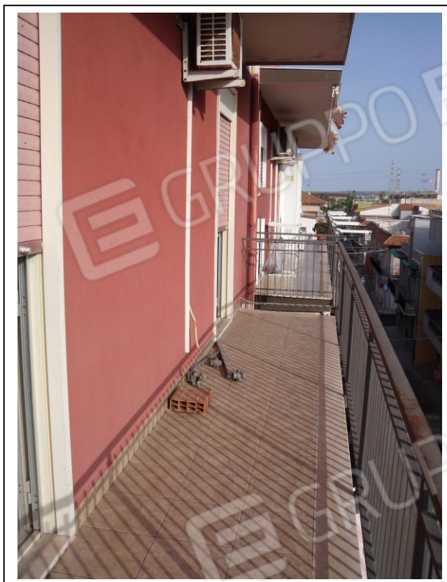
19. Esterno u. i. balcone in aggetto su via Milano, con vista verso lato sud-est.