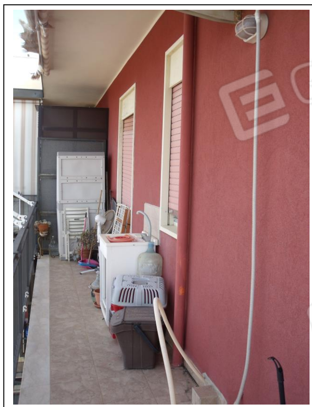
20. Esterno u. i. balcone in aggetto su corte interna, con vista verso lato sud-est.