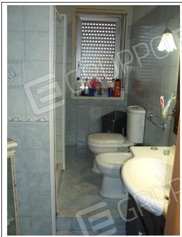
13. Interno u. i. servizio igienico, con vista verso lato NE, presenza di finestra di affaccio su corte interna.