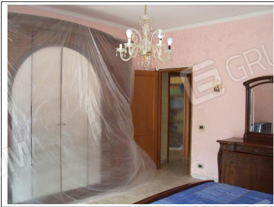
08. Interno u.i. vano camera da letto doppia, verso lato N, in foto porta di ingresso al vano.