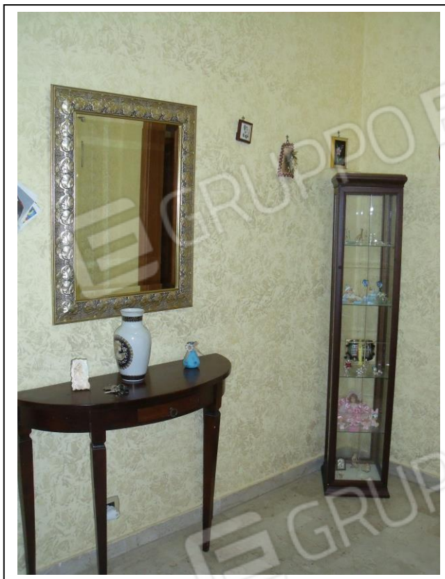
05. Interno unità immobiliare vano ingresso, verso lato ovest.