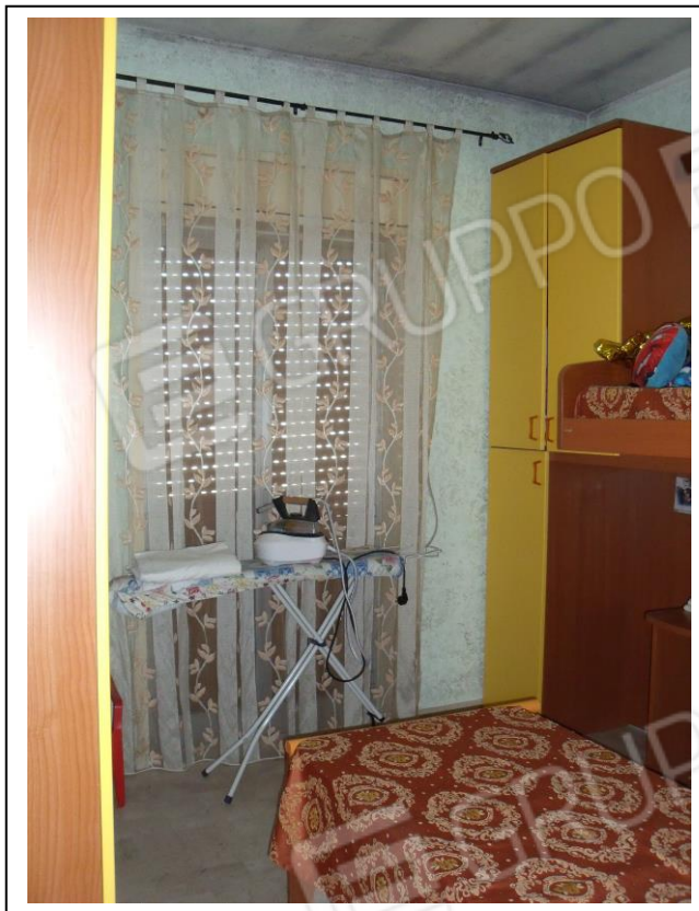
15. Interno u. i. camera letto singola, con vista verso lato E. Presenza di porta-finestra di affaccio su corte interna.