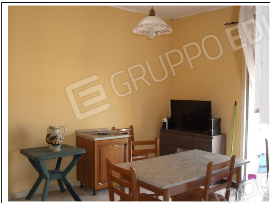
11. Interno unità immobiliare, vano cucina, vista verso lato N, presenza di porta-finestra di affaccio su corte interna.