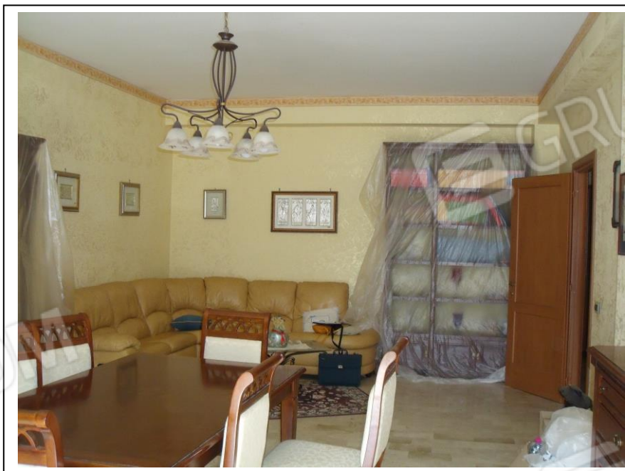
10. Interno u.i. vano salone/soggiorno, verso lato E, in foto porta di ingresso al vano.