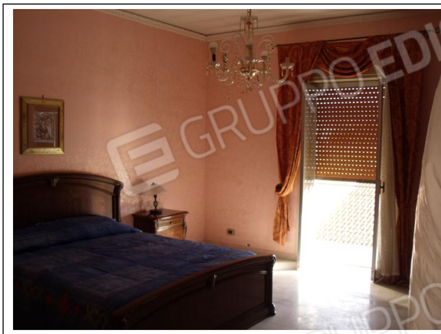
07. Interno u.i. vano camera da letto doppia, verso lato S, in foto porta-finestra di affaccio al balcone su lato strada (via Milano).