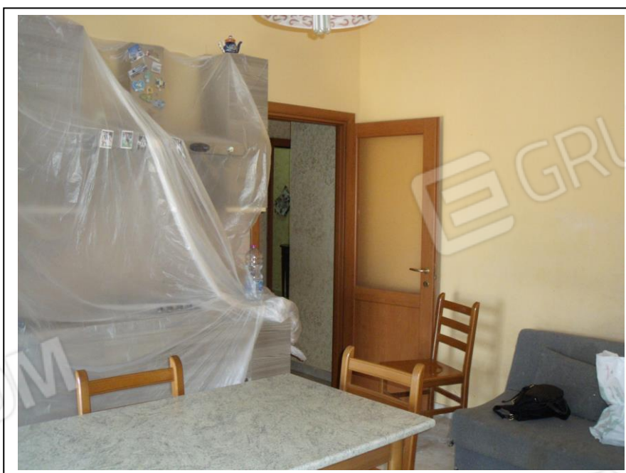
12. Interno u.i. vano cucina, verso lato S, in foto porta di ingresso al vano.