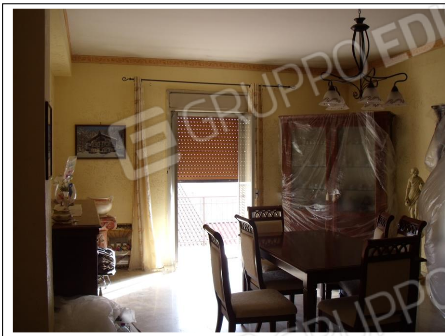
09. Interno u.i. vano salone/soggiorno, verso lato O, in foto porta-finestra di affaccio al balcone su lato strada (via Milano).