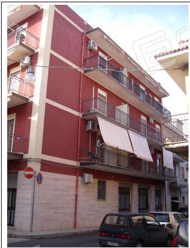
02. Prospetto dell'edificio con affaccio su via Como, esposizione SE.