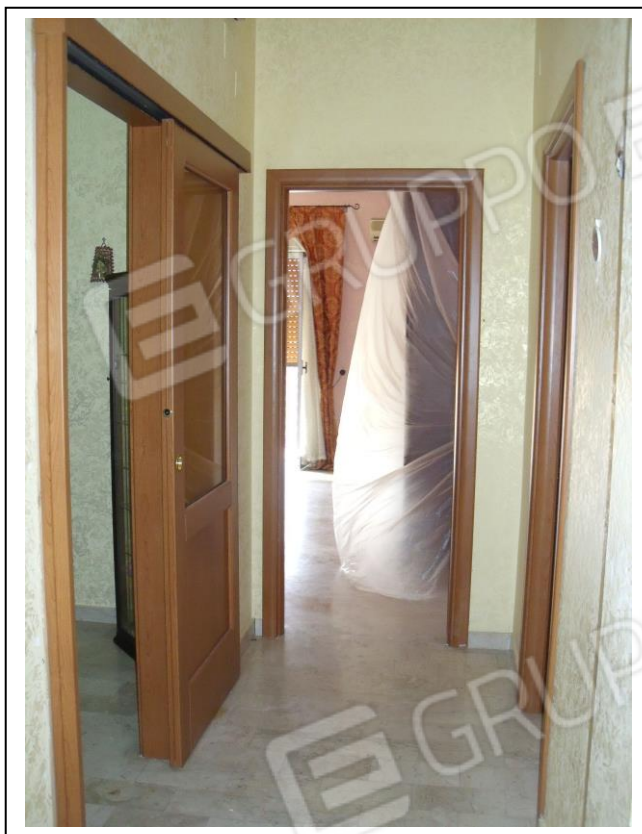
17. Interno u. i. vano corridoio, con vista verso lato sud-ovest.