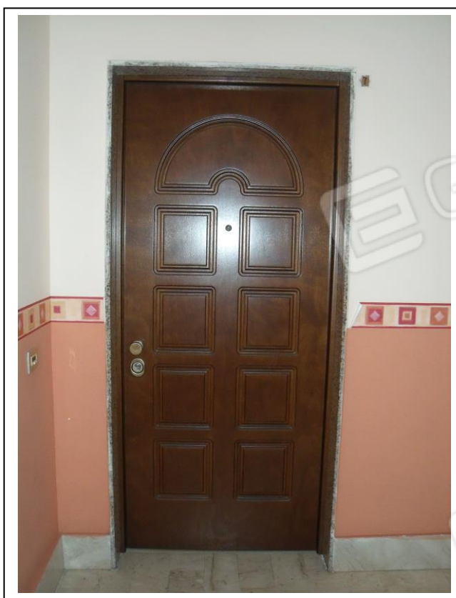
04. Porta blindata d'ingresso all'unità immobiliare al piano 3.