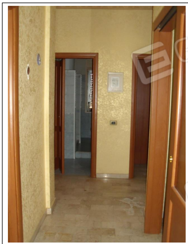
18. Interno u. i. vano corridoio, con vista verso lato nord-est.