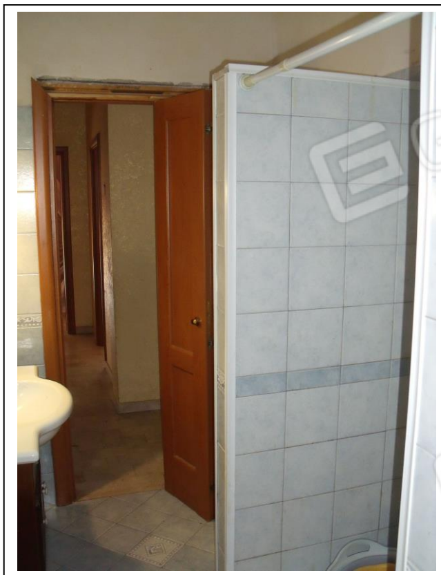
14. Interno u. i. servizio igienico, con vista verso lato SO, in foto porta di accesso al vano.