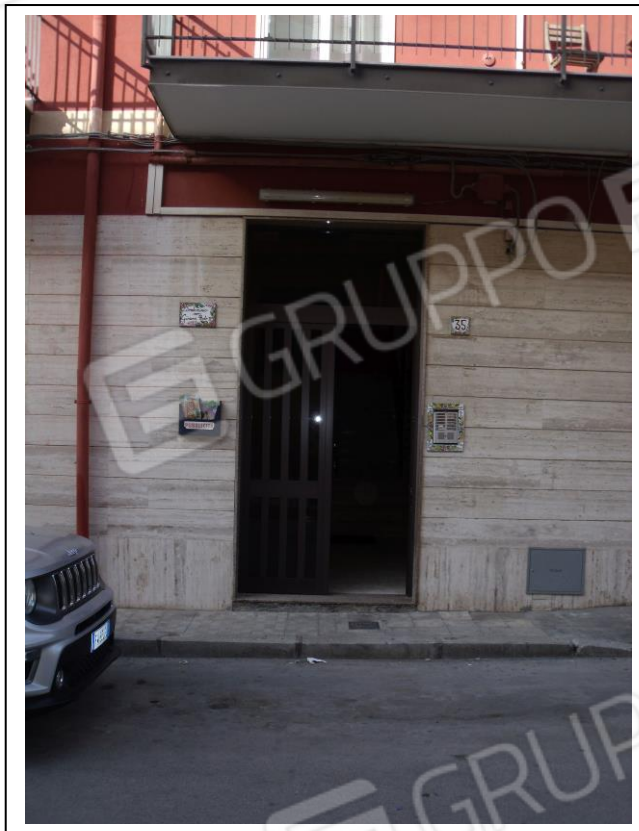
03. Prospetto principale con portone d'ingresso verso androne condominiale.