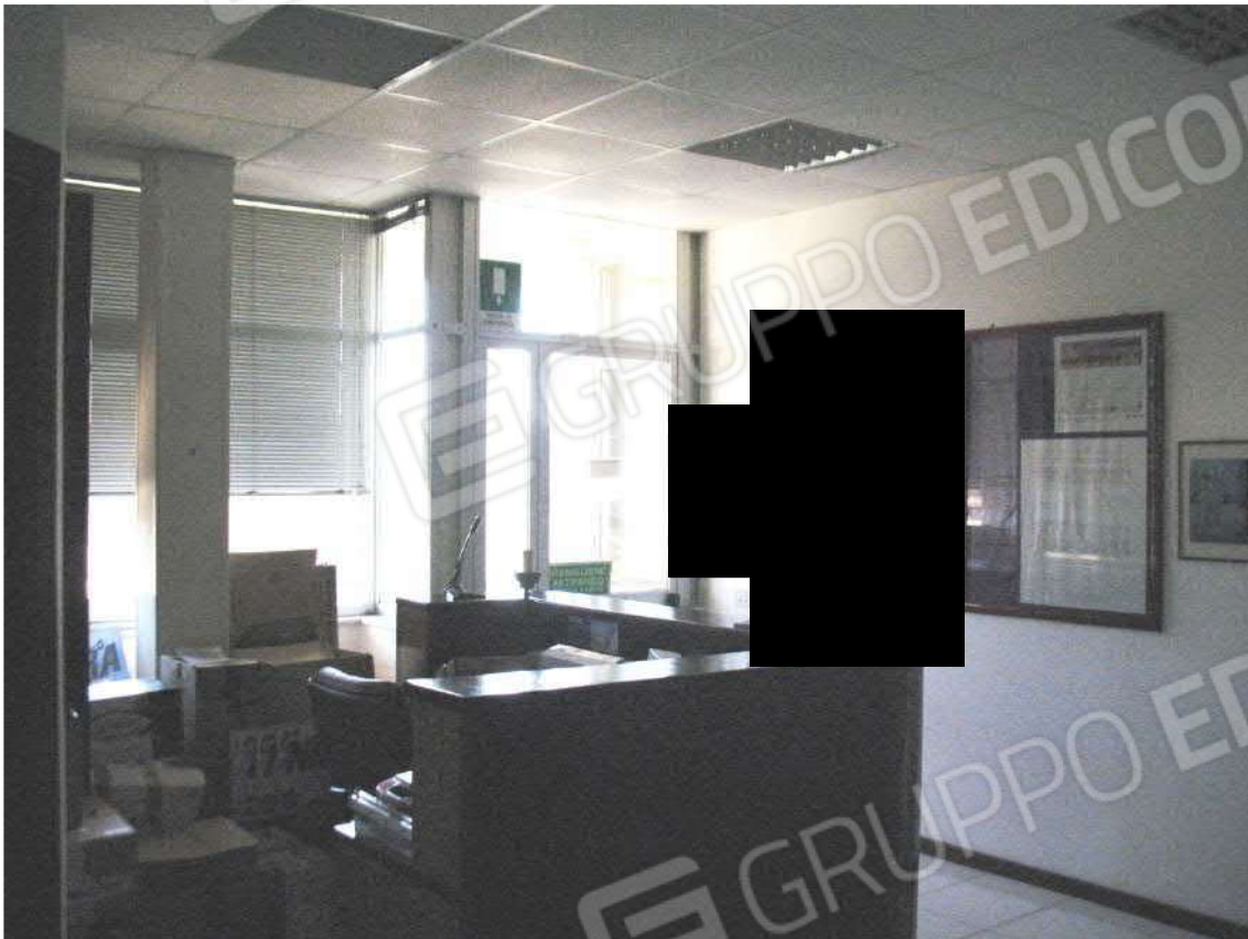
Foto 17 - Corpo uffici e servizi (B) piano primo (Sub 3): Ingresso - Reception