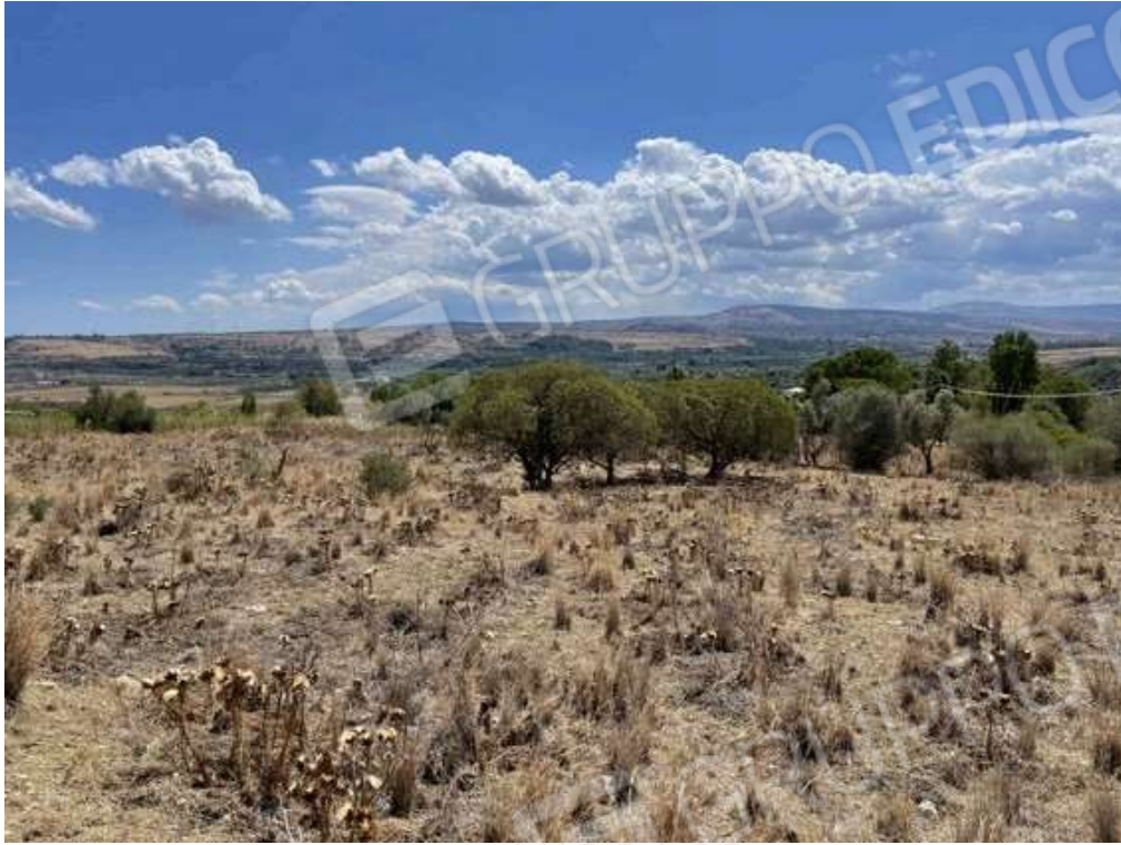
Fotografia D.73 - Terreno: confine con la particella 1299