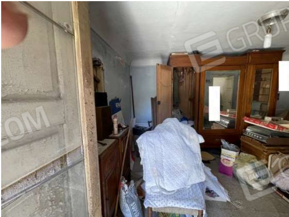
Fotografia D.32 - Piano secondo: locale che si affaccia sulla terrazzino