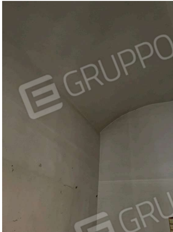
Fotografia D.9 - Piano primo lato ovest