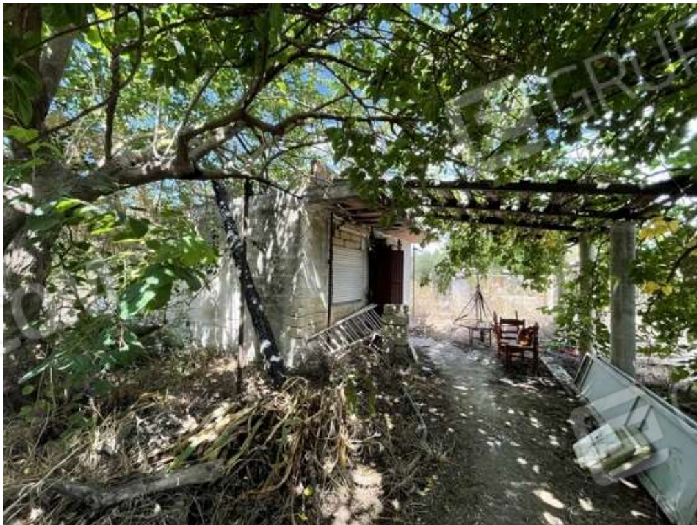
Fotografia D.64 - Magazzino: prospetto est