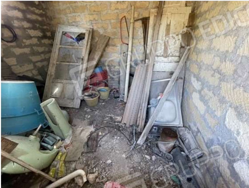
Fotografia D.55 - manufatto al confine nord-est