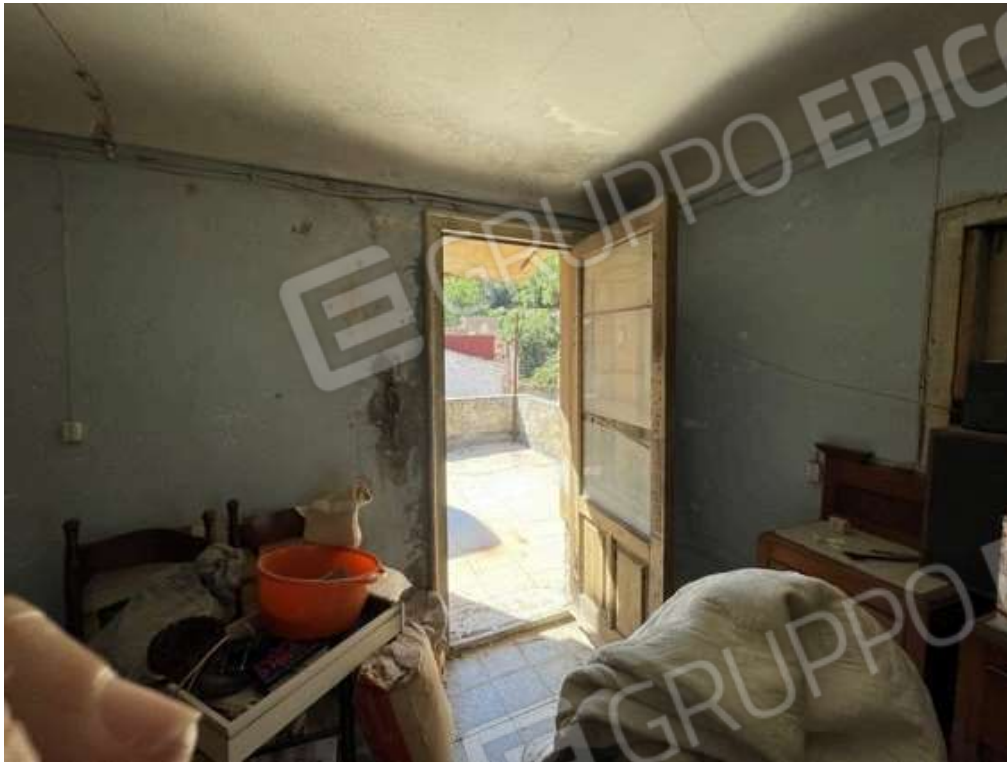
Fotografia D.35 - Piano secondo: locale che si affaccia sulla terrazzino