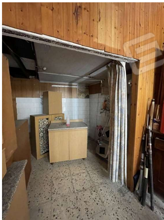
Fotografia D.6 - Piano terra: lato prospiciente via E. Marchiafava