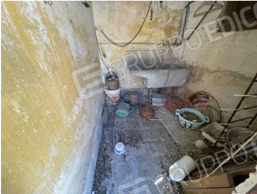
Fotografia D.29 - Piano secondo: interni del manufatto