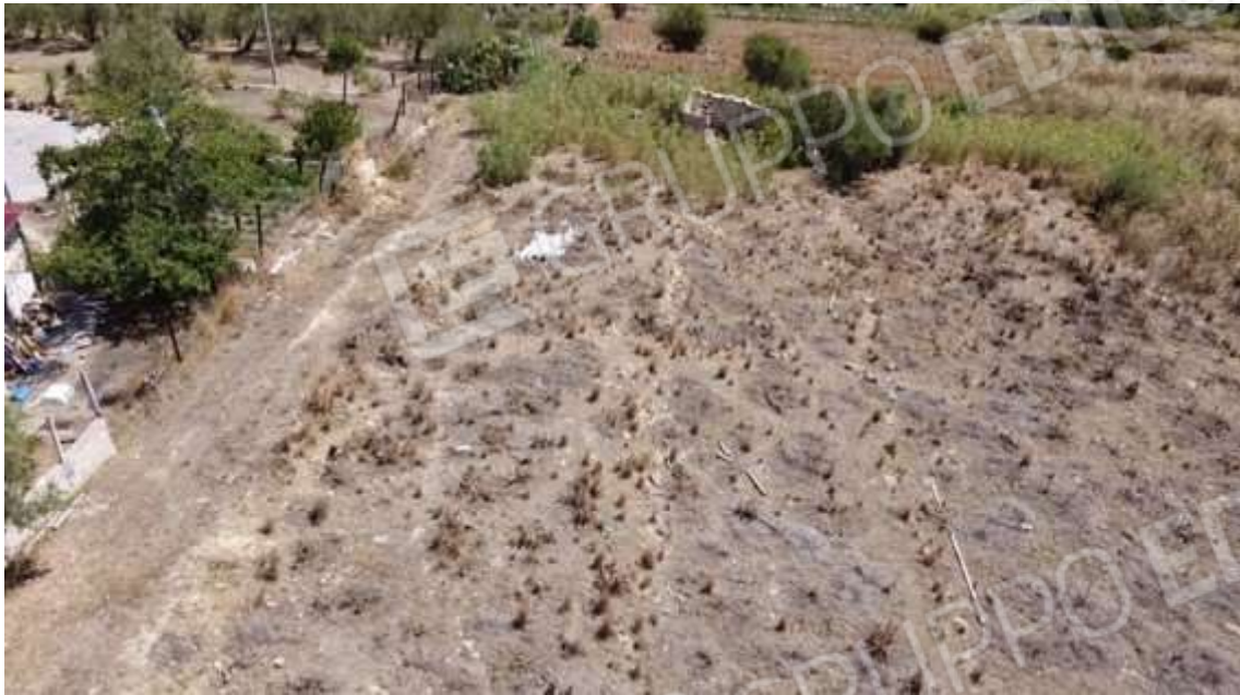
Fotografia D.75 - Terreno: lato sud della particella 363