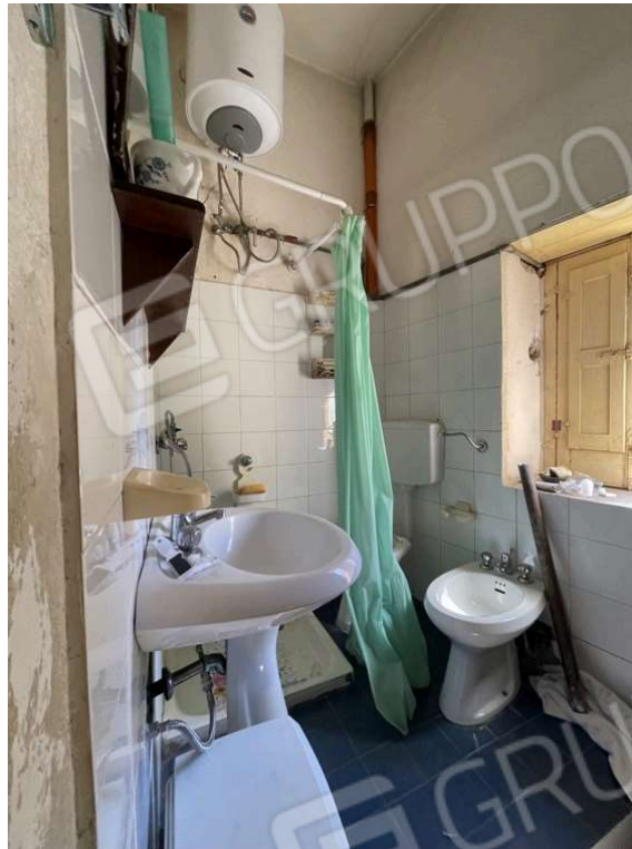
Fotografia D.19 - Piano primo: bagno