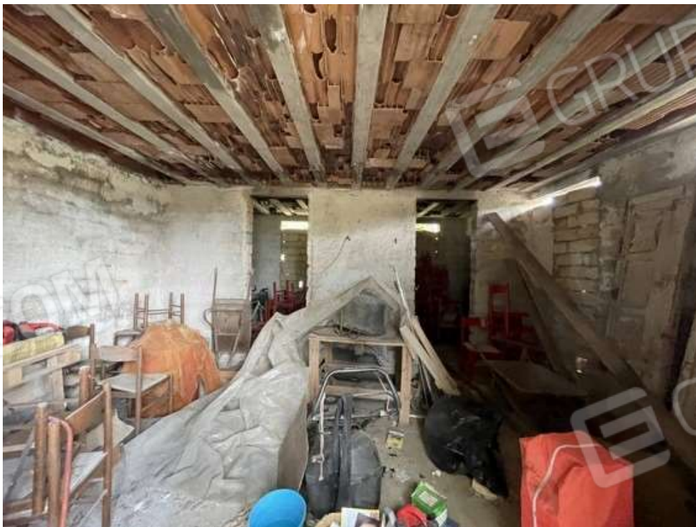
Fotografia D.52 - Magazzino: entrata