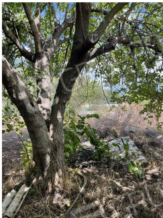
Fotografia D.69 - Confine con la particella 638