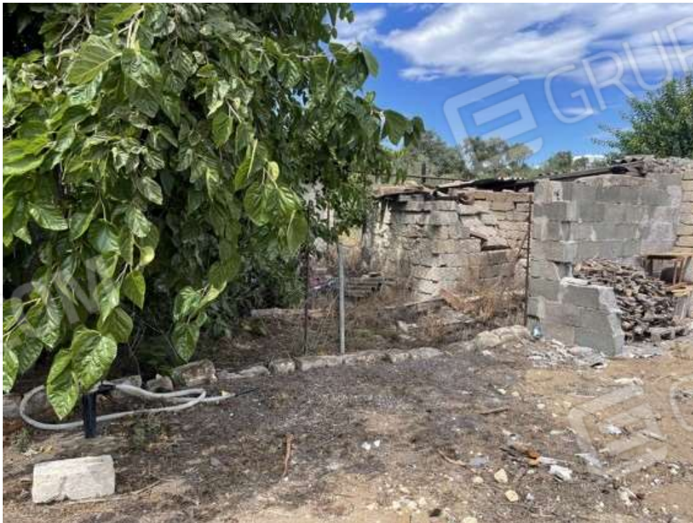
Fotografia D.40 - Confine est fra la particella 637-636