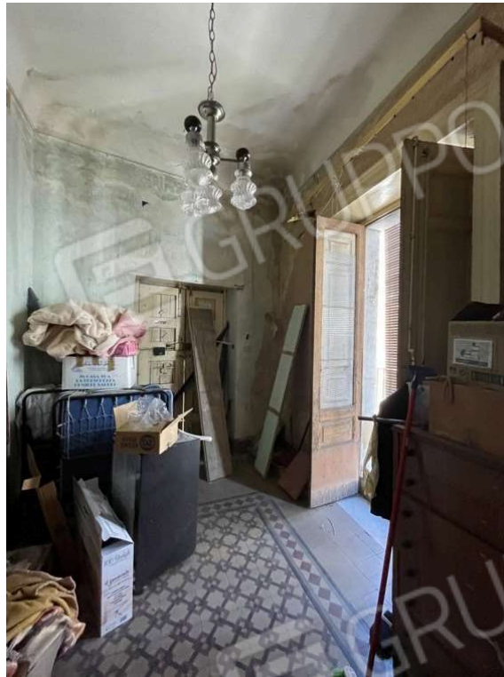
Fotografia D.17 - Piano primo: porta che da sulla scalinata esterna-lato via E. Marchiafava