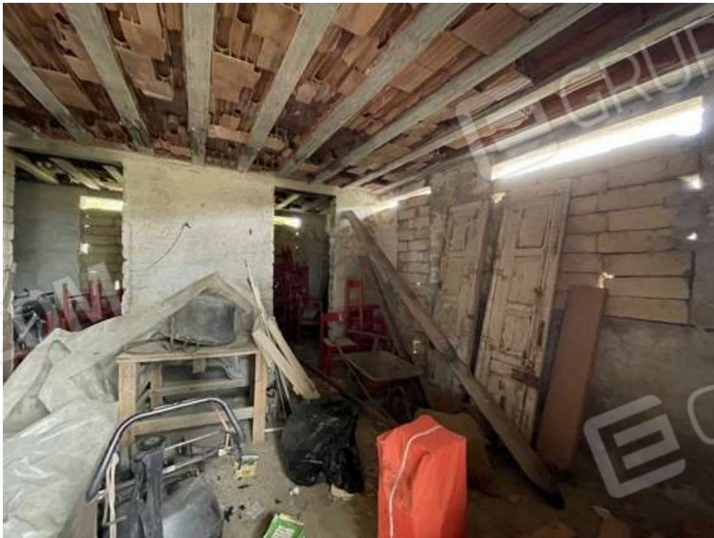
Fotografia D.50 - Magazzino: entrata