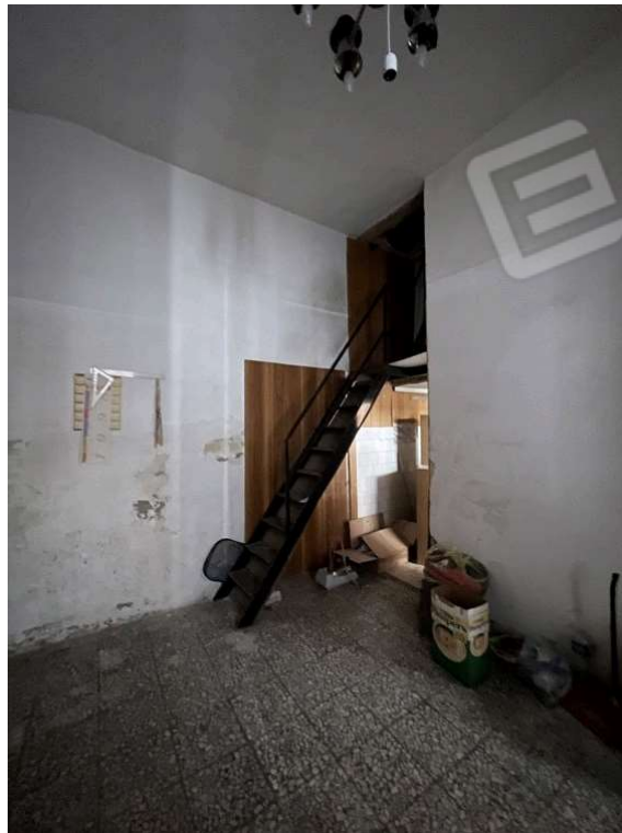
Fotografia D.2 - Piano terra: scala interna che portano al piano primo