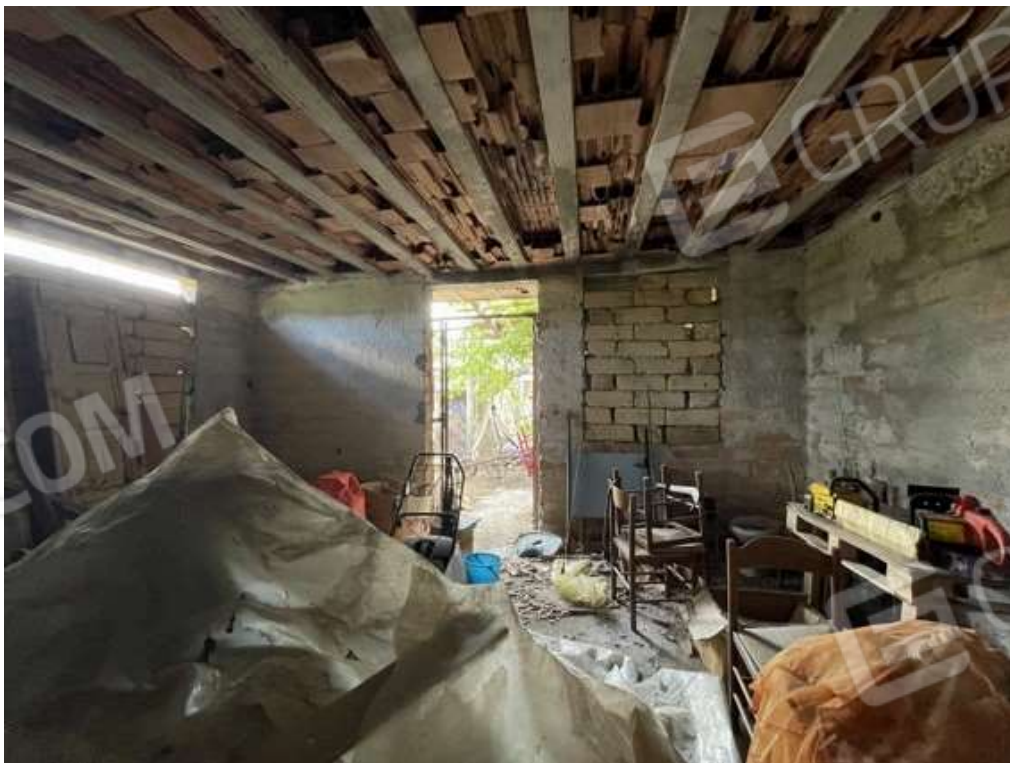
Fotografia D.44 - Magazzino: entrata