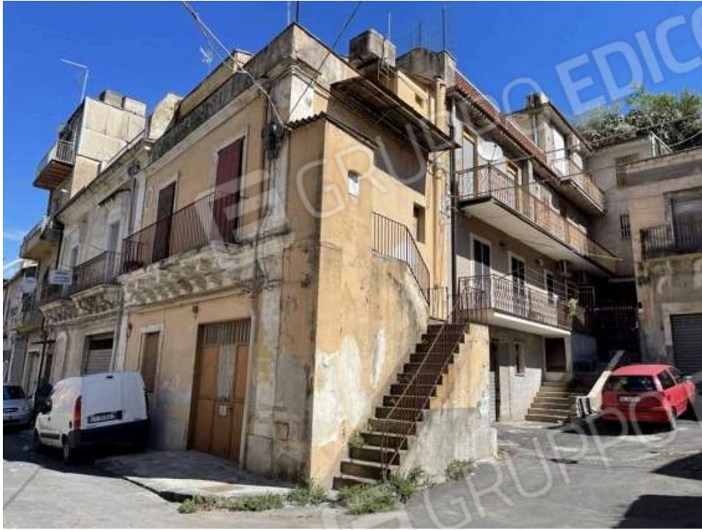
Fotografia D.1 - Immobile: via Gioachino Rossini