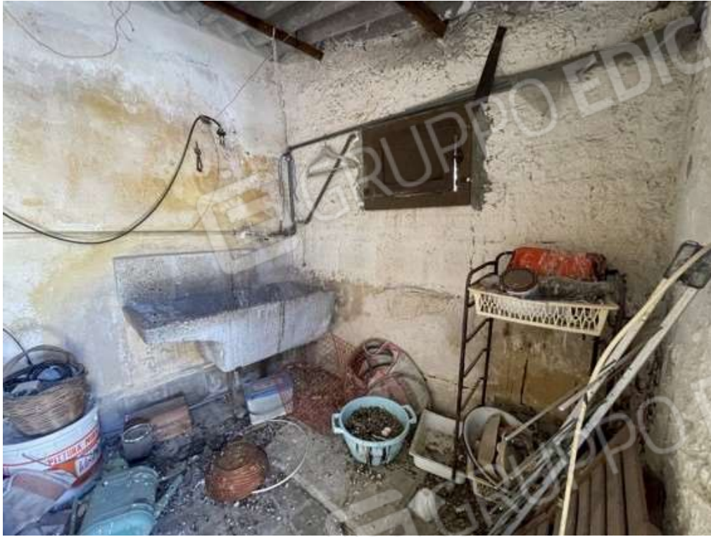
Fotografia D.31 - Piano secondo: interni del manufatto