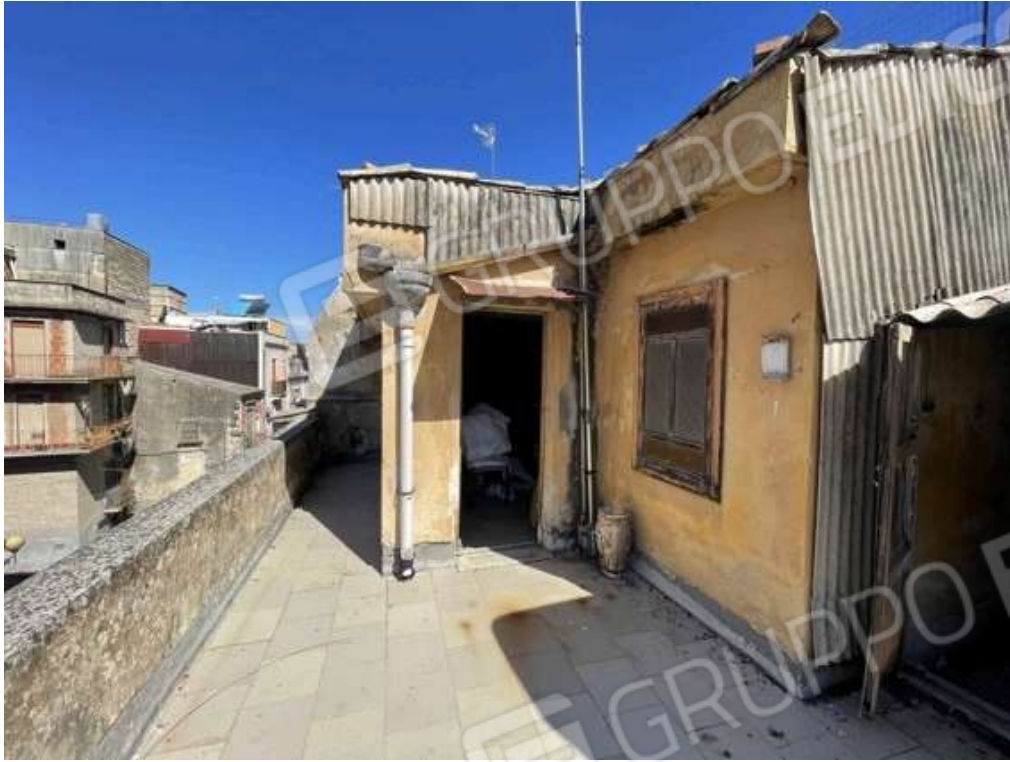
Fotografia D.27 - Piano secondo: locale e vano scala