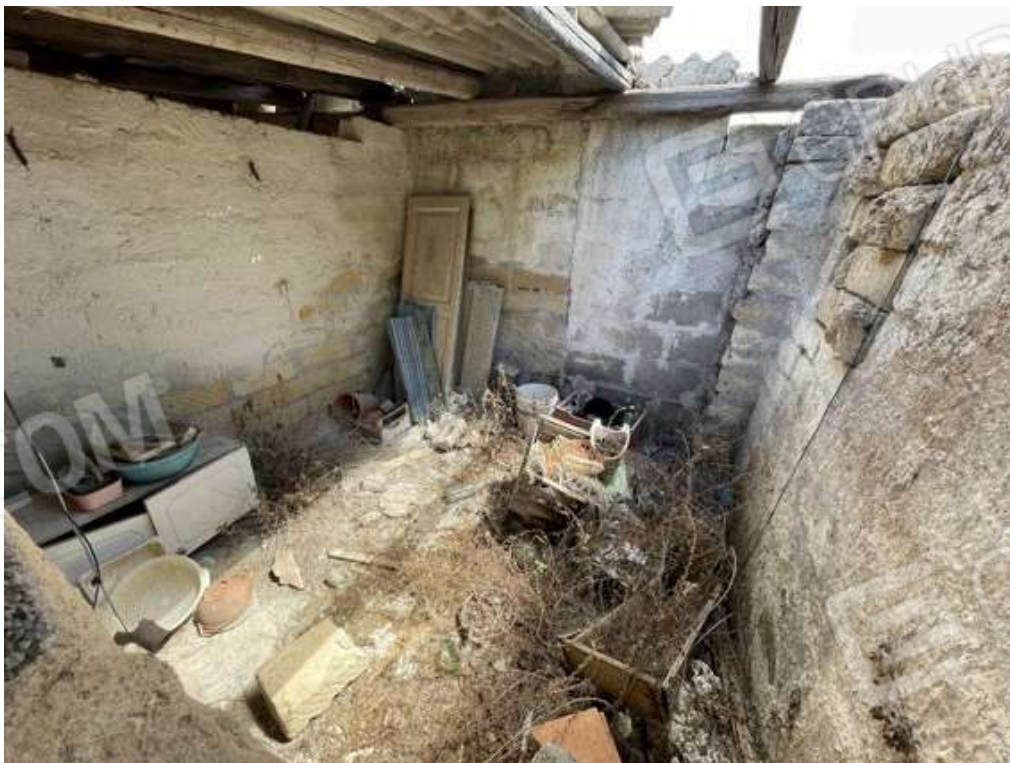
Fotografia D.58 - Manufatto: Interno pareti e copertura