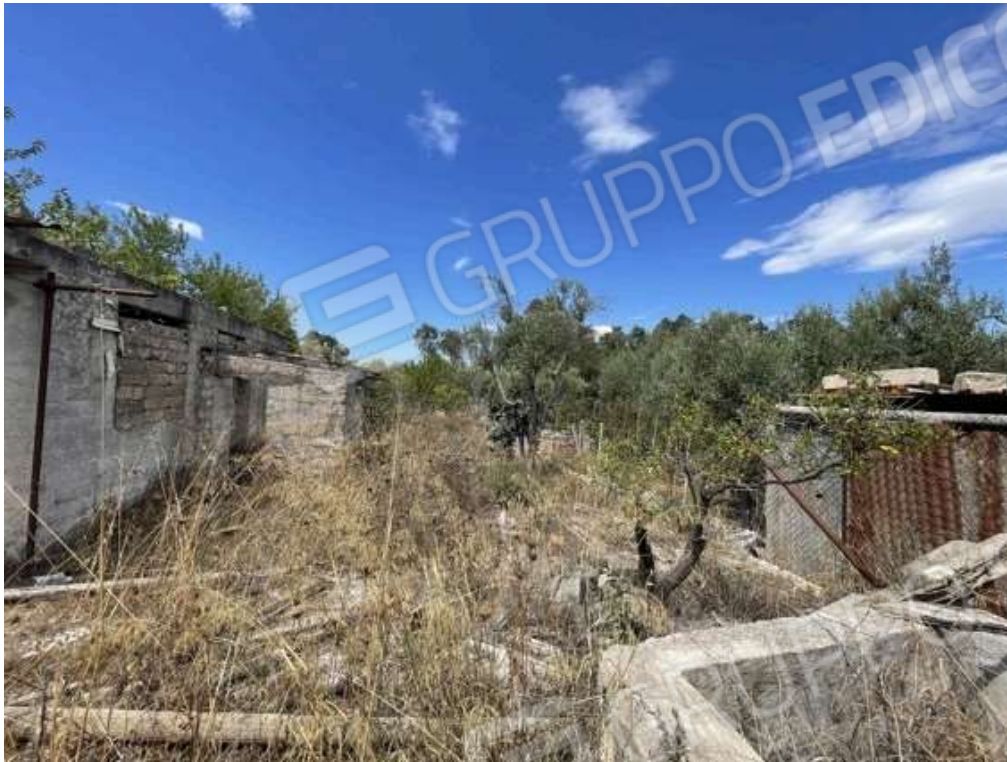
Fotografia D.53 - Esterno: lato nord del magazzino