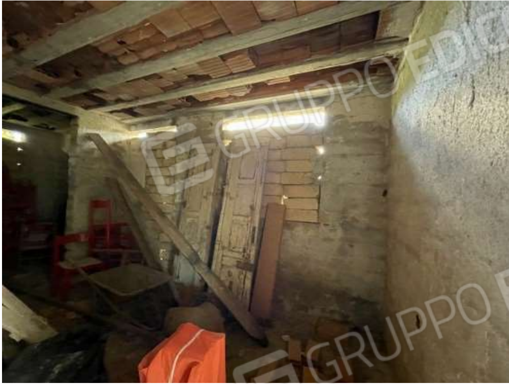
Fotografia D.49 - Magazzino: interno