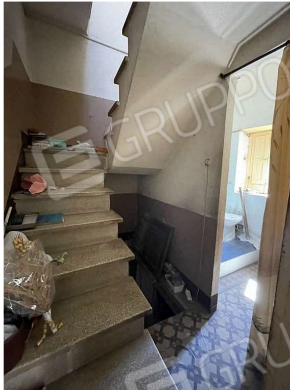
Fotografia D.21 - Scale che portano al piano terra ed al piano secondo