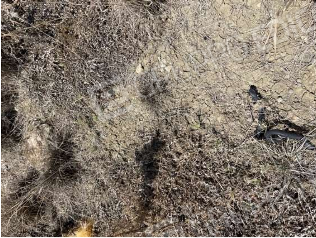
Fotografia D.71 - Terreno: particolare delle caratteristiche del terreno