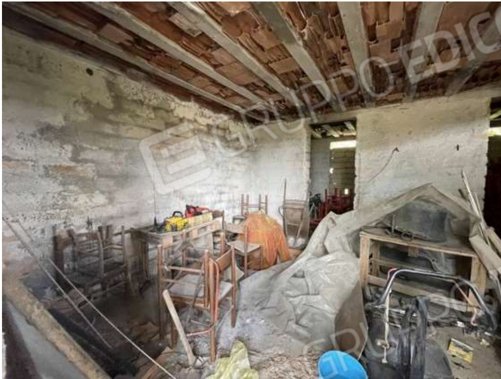
Fotografia D.51 - Magazzino: entrata