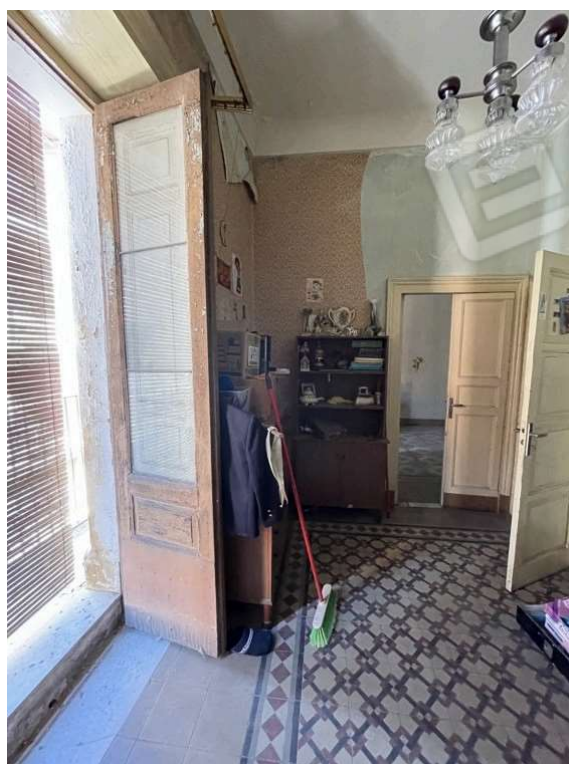
Fotografia D.14 - Piano primo: balcone che si affaccia sulla via Gioachino Rossini- lato ovest