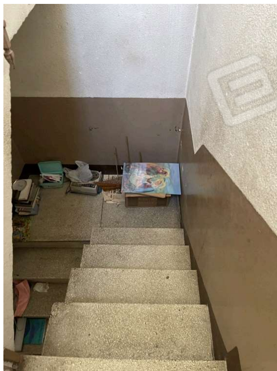
Fotografia D.38 - Scala che collega il piano primo con il piano secondo