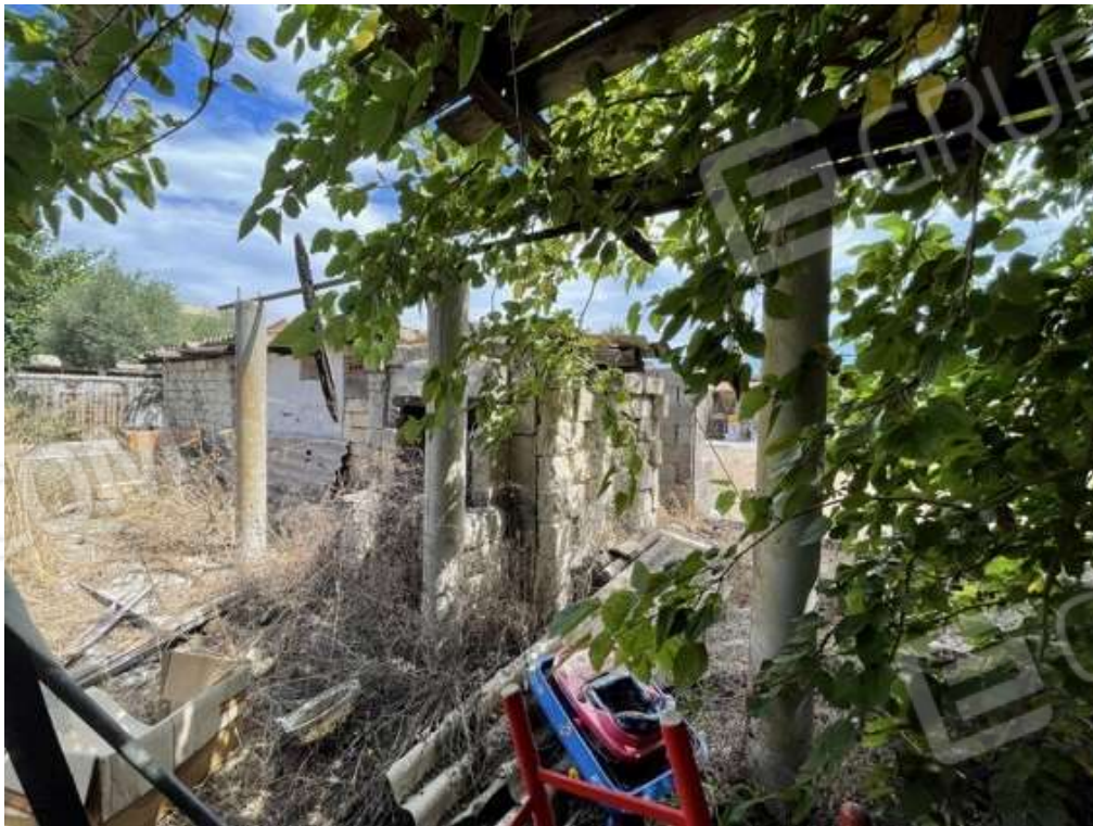
Fotografia D.60 - Veranda esterna al magazzino con pilastri in cemento armato