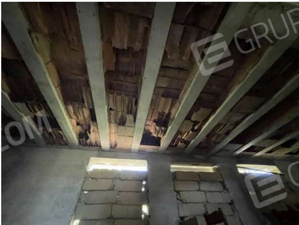
Fotografia D.46 - Magazzino: entrata