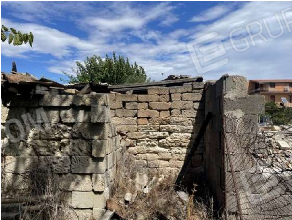
Fotografia D.62 - Manufatto al confine con la p.lla 636