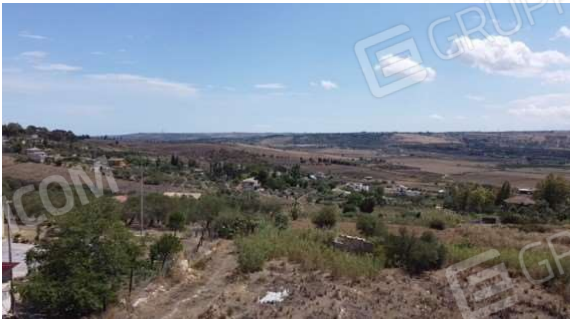
Fotografia D.76 - Terreno: lato sud della particella 363