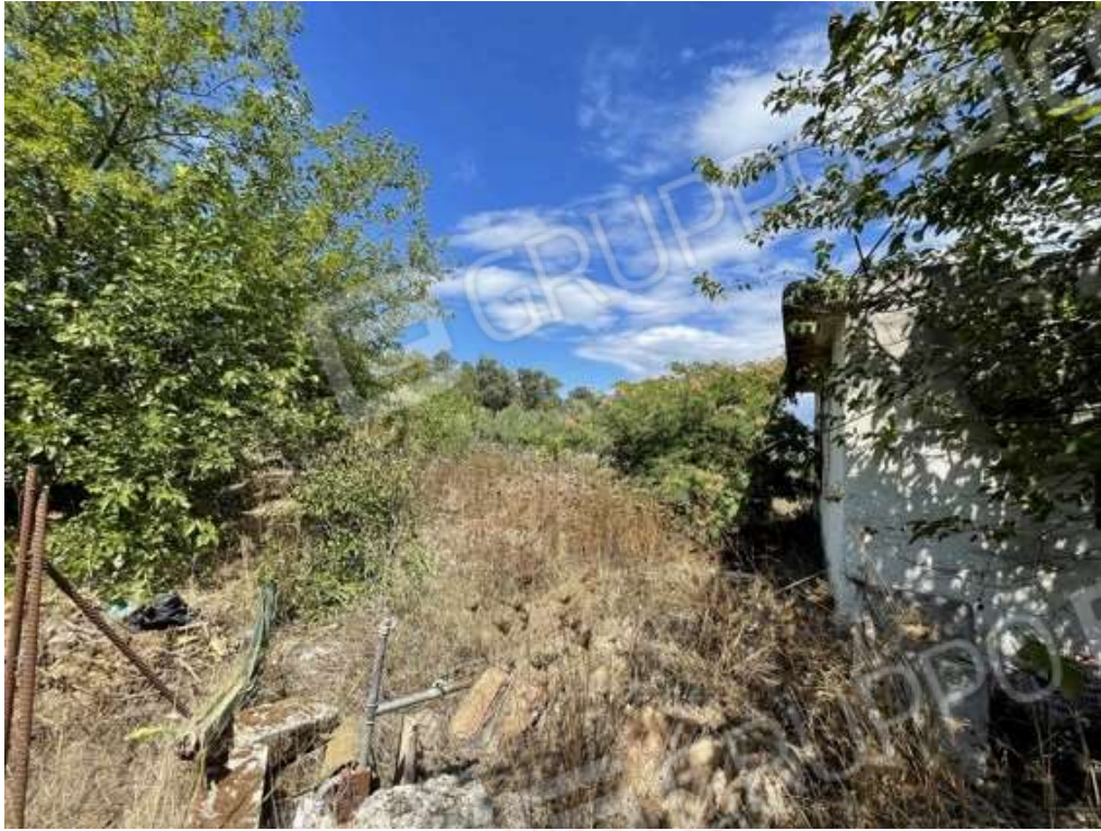
Fotografia D.65 - Magazzino prospetto sud-est