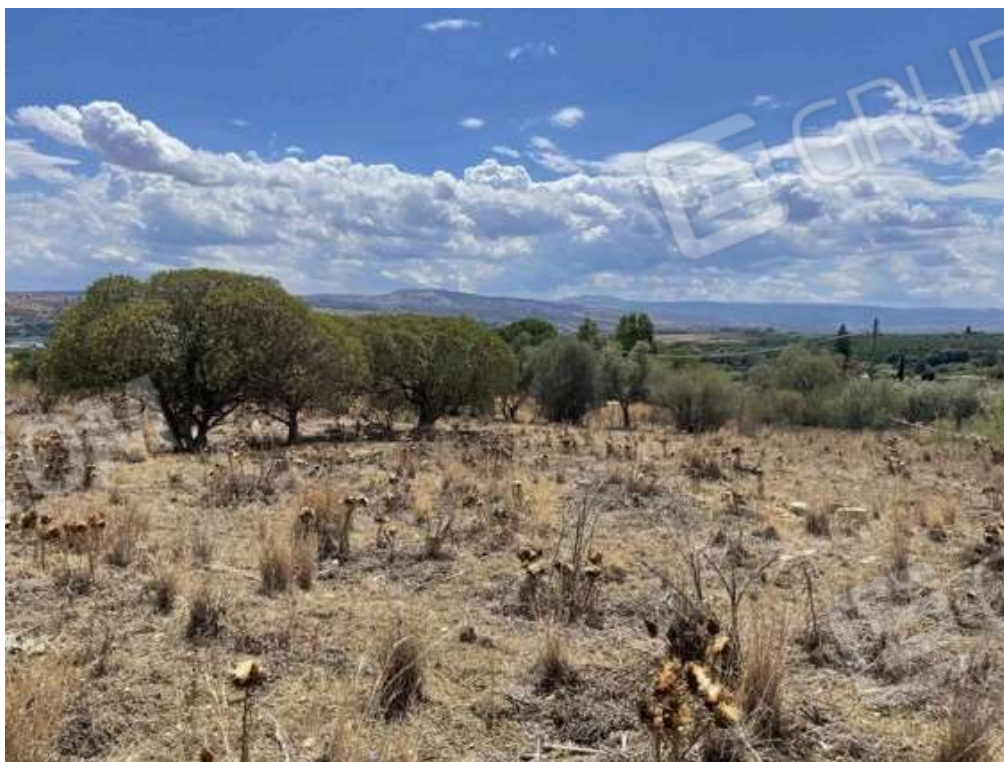
Fotografia D.70 - Terreno: confine con la particella 1299