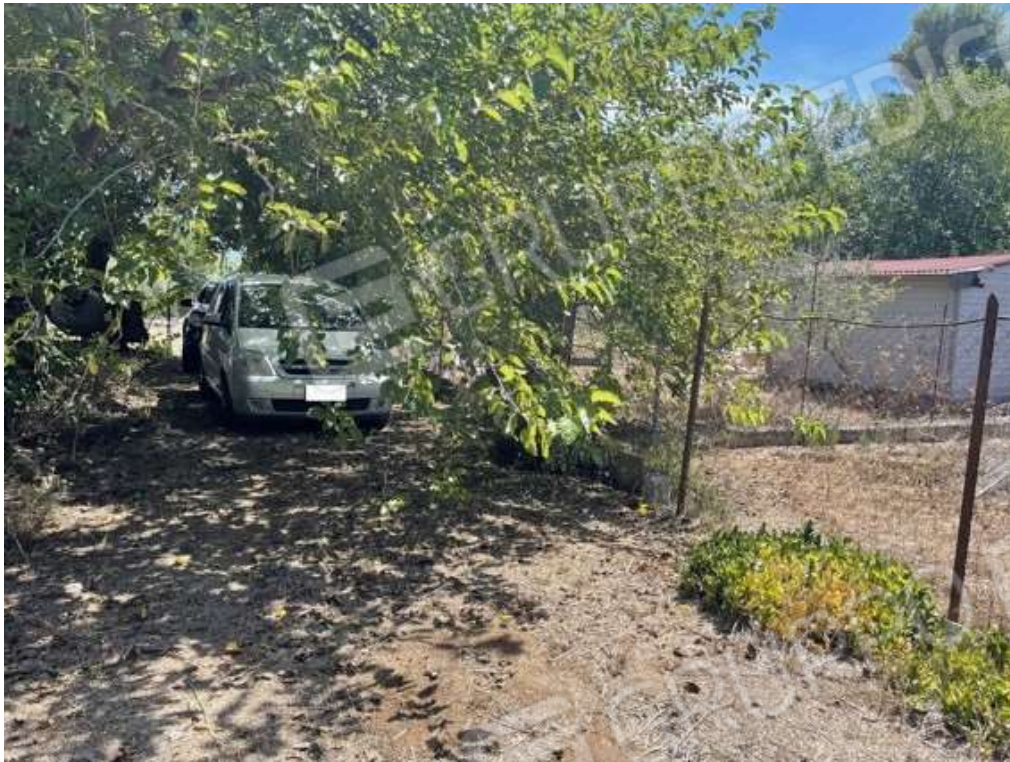
Fotografia D.67 - Entrata lato sud della particella 637