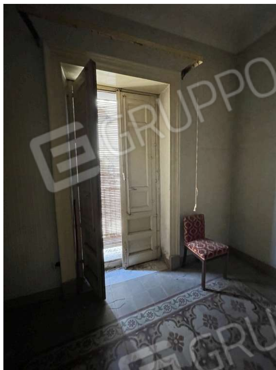
Fotografia D.11 - Piano primo: balcone che si affaccia sulla via Gioachino Rossini