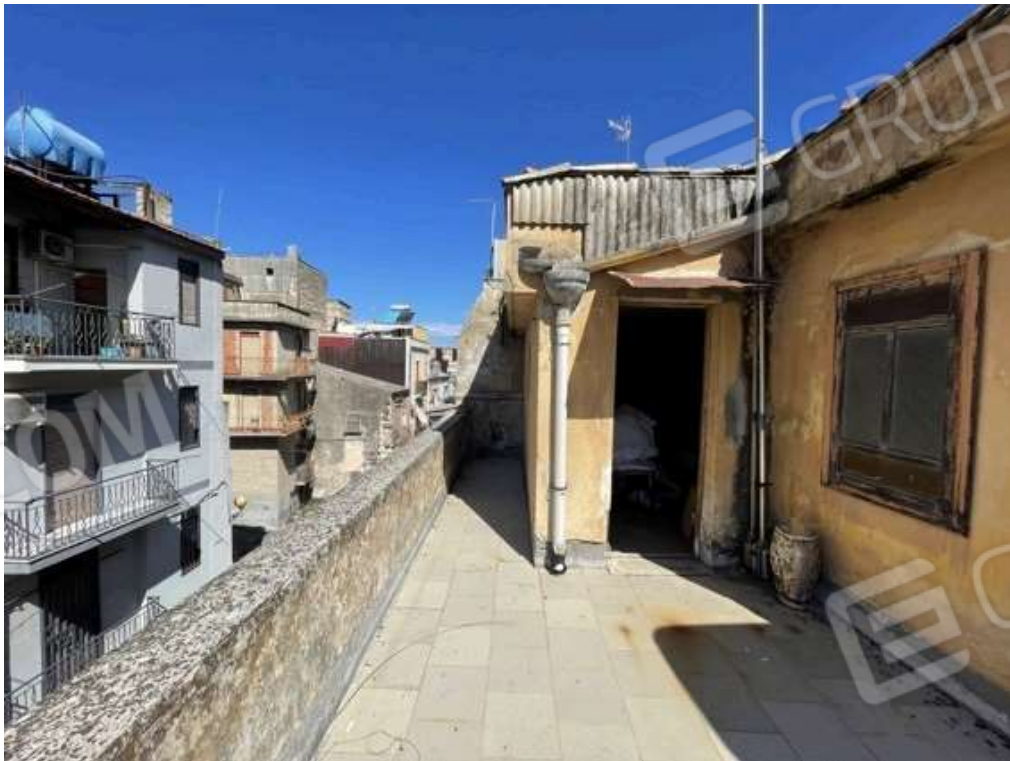
Fotografia D.28 - Piano secondo: particolare della terrazza