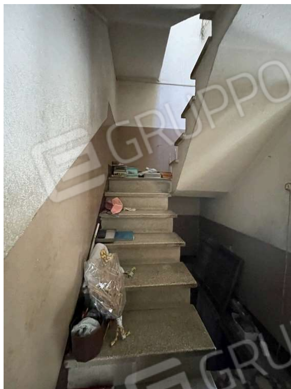
Fotografia D.23 - Scale interne