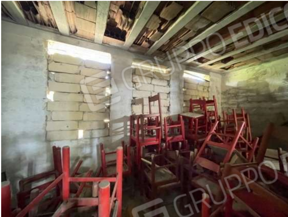
Fotografia D.43 - Magazzino: particolare del soffitto in latero-cemento