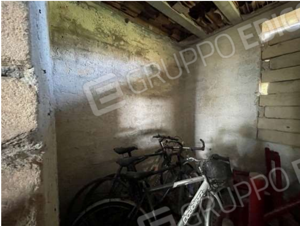
Fotografia D.45 - Magazzino: Interno