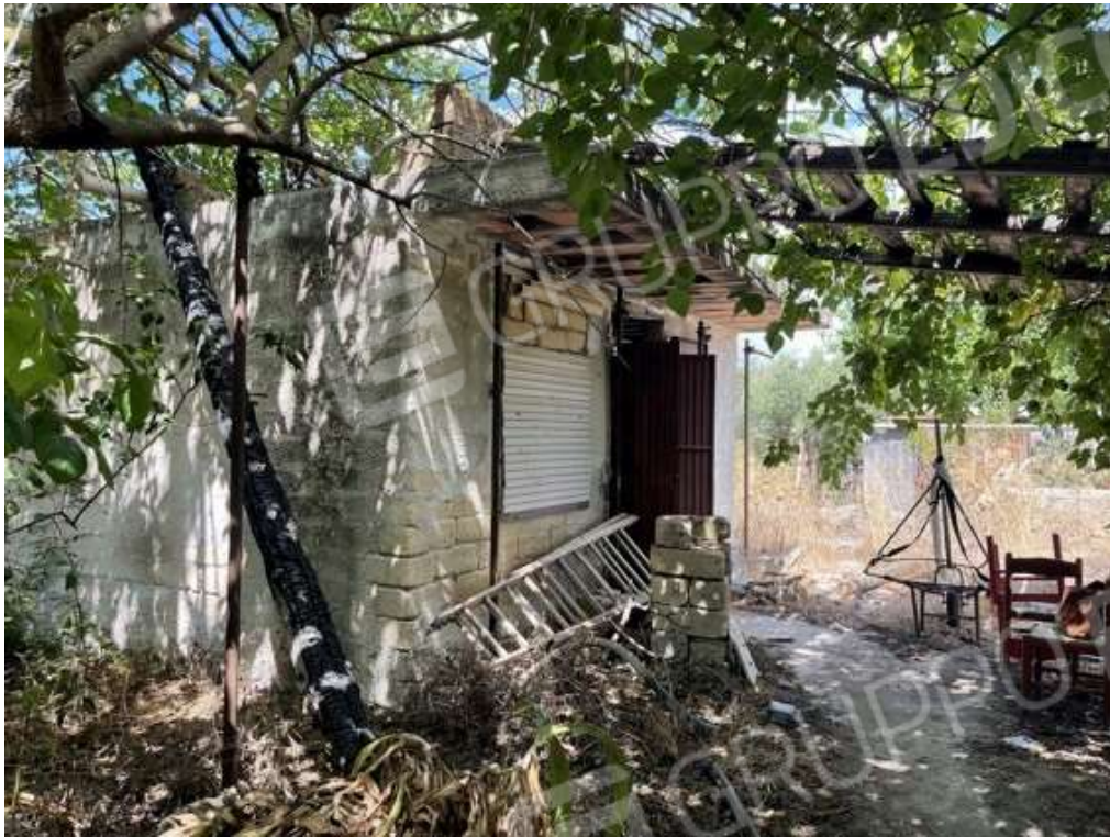
Fotografia D.63 - Magazzino: prospetto est