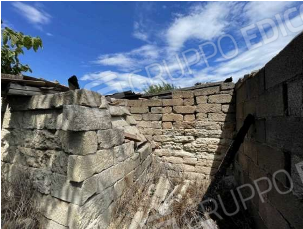
Fotografia D.61 - Manufatto al confine con la p.lla 636