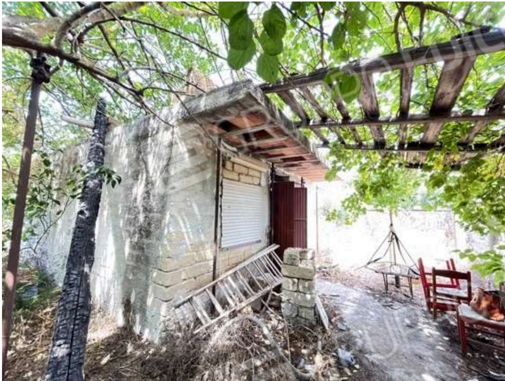
Fotografia D.41 - Prospetto est magazzino