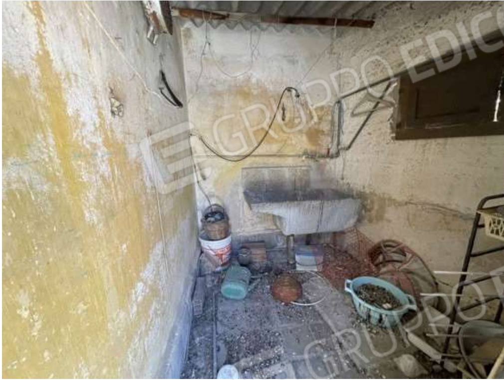
Fotografia D.25 - Piano secondo: interno del manufatto