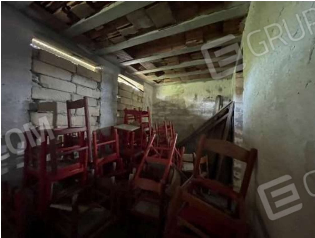
Fotografia D.48 - Interno: locale ovest del magazzino diviso da muro con apertura