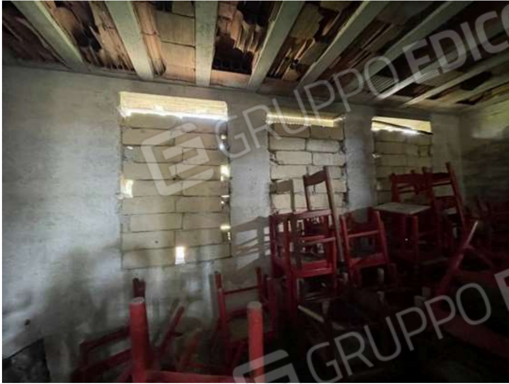
Fotografia D.47 - Magazzino: entrata