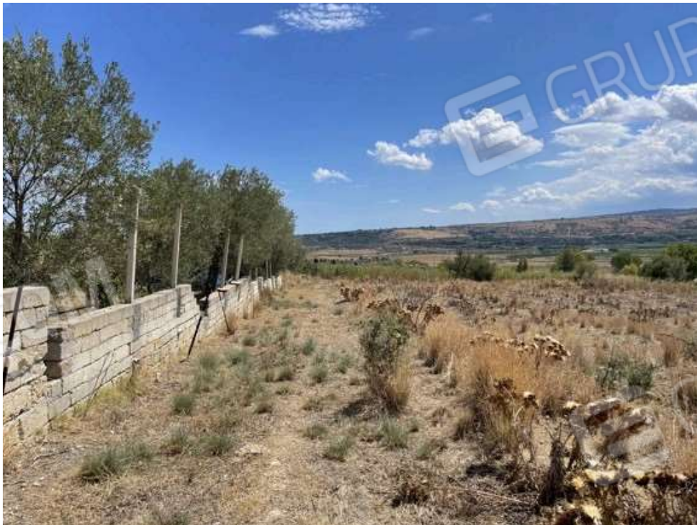
Fotografia D.72 - Terreno: confine con la particella 2228