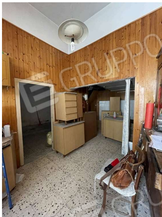
Fotografia D.3 - Piano terra: lato scala-via E. Marchiafava. In fondo alla stanza è presente un soppalco