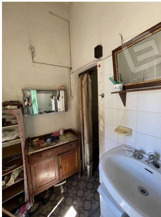
Fotografia D.18 - Piano primo: bagno