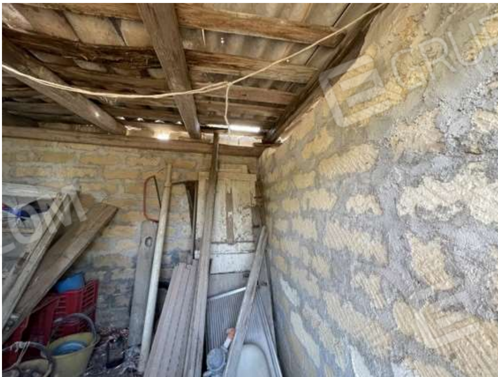
Fotografia D.56 - Copertura del manufatto