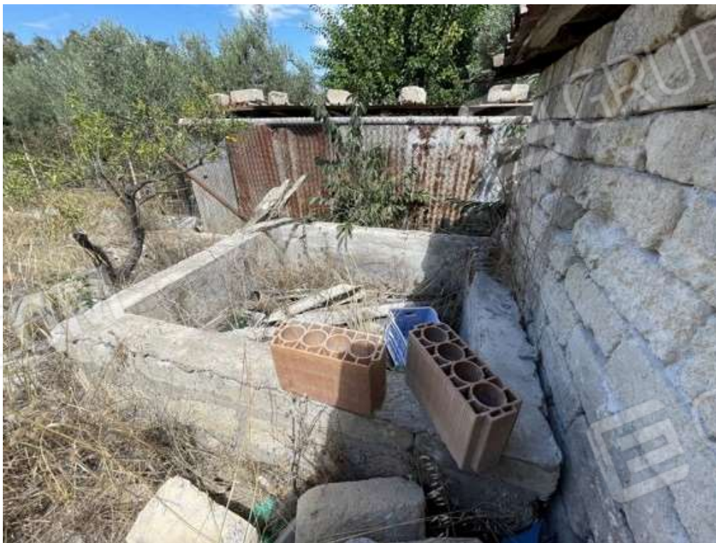
Fotografia D.54 - Vasca e confine nord