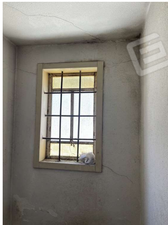
Fotografia D.36 - Scala che collega il piano primo e il piano secondo