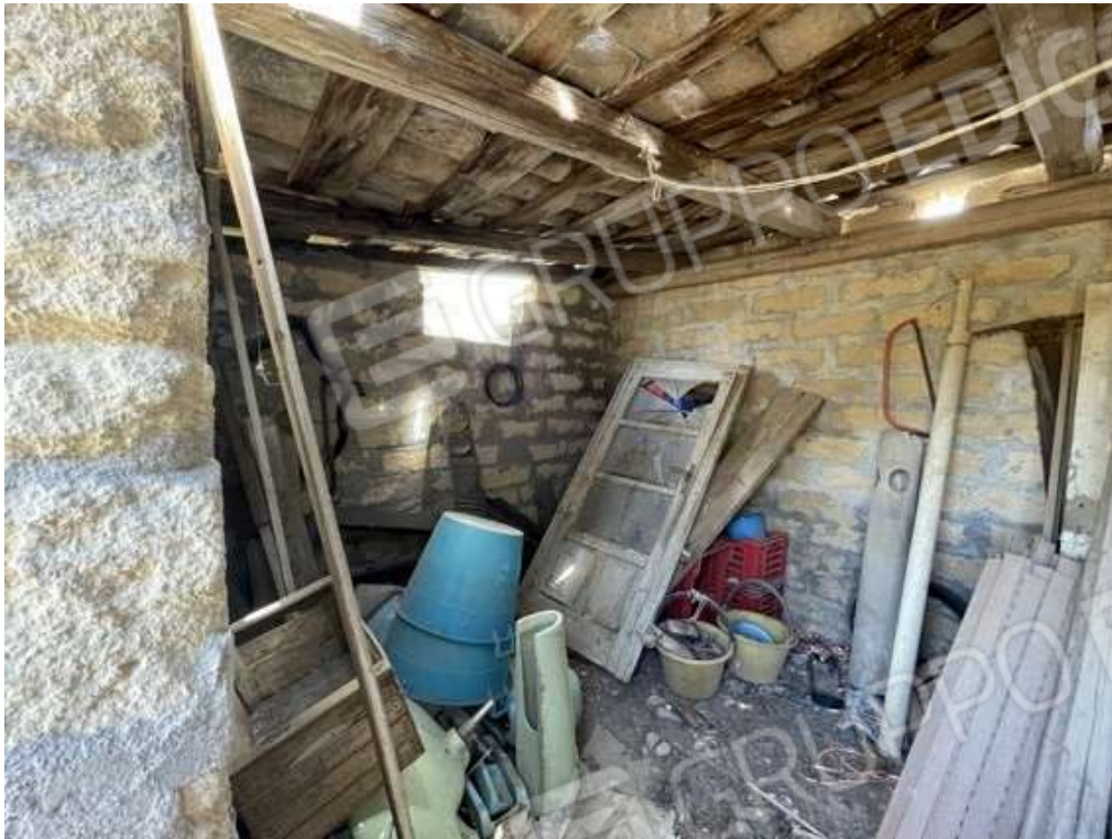
Fotografia D.57 - Copertura