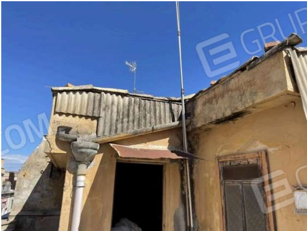
Fotografia D.26 - Copertura