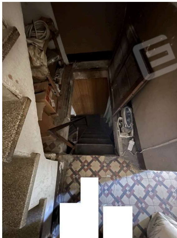
Fotografia D.22 - Scala che porta al piano terra e che attraversa il soppalco