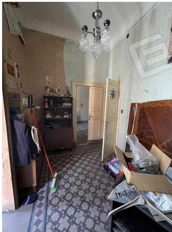
Fotografia D.16 - Piano primo: lato ovest-porta che da sulle scale e sul bagno retrostante