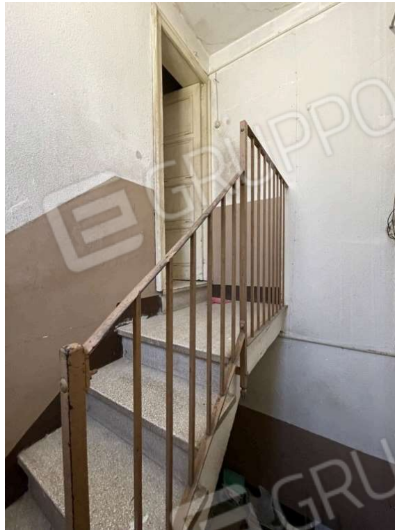
Fotografia D.39 - Scala che porta all'ingresso del locale al piano secondo