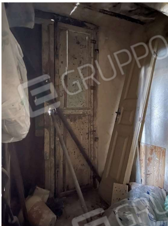
Fotografia D.7 - Porta che si affaccia sulle scale in via E. Marchiafava