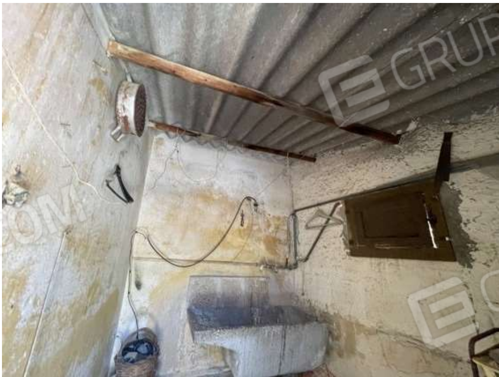
Fotografia D.30 - Piano secondo: interni del manufatto