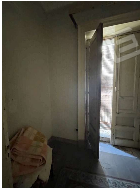
Fotografia D.10 - Piano primo: balcone che si affaccia sulla via Gioachino Rossini