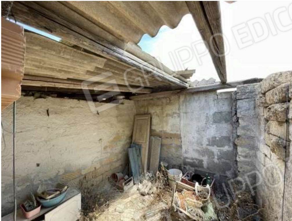
Fotografia D.59 - Interno e copertura precaria