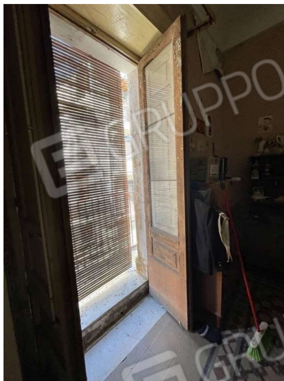
Fotografia D.13 - Piano primo: balcone che si affaccia sulla via Gioachino Rossini