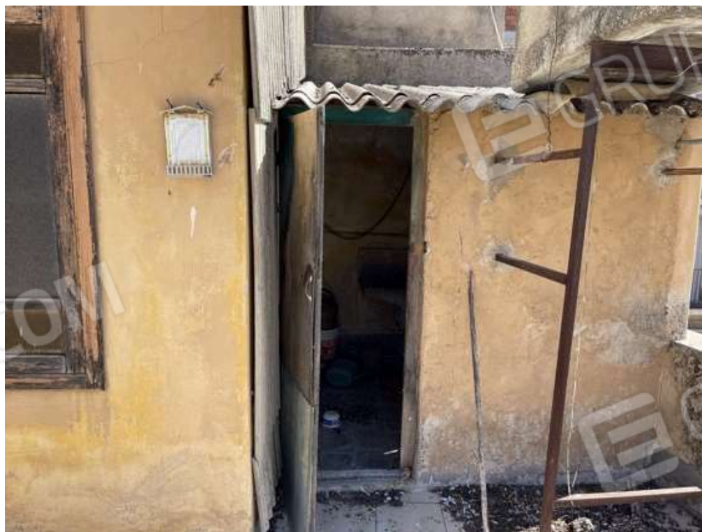
Fotografia D.24 - Piano secondo: manufatto a fianco della scala non presente in planimetria