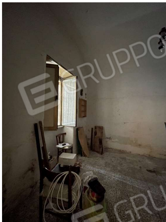
Fotografia D.5 - Piano terra: particolare della finestra