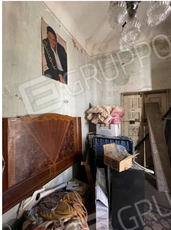
Fotografia D.15 - Piano primo: lato ovest