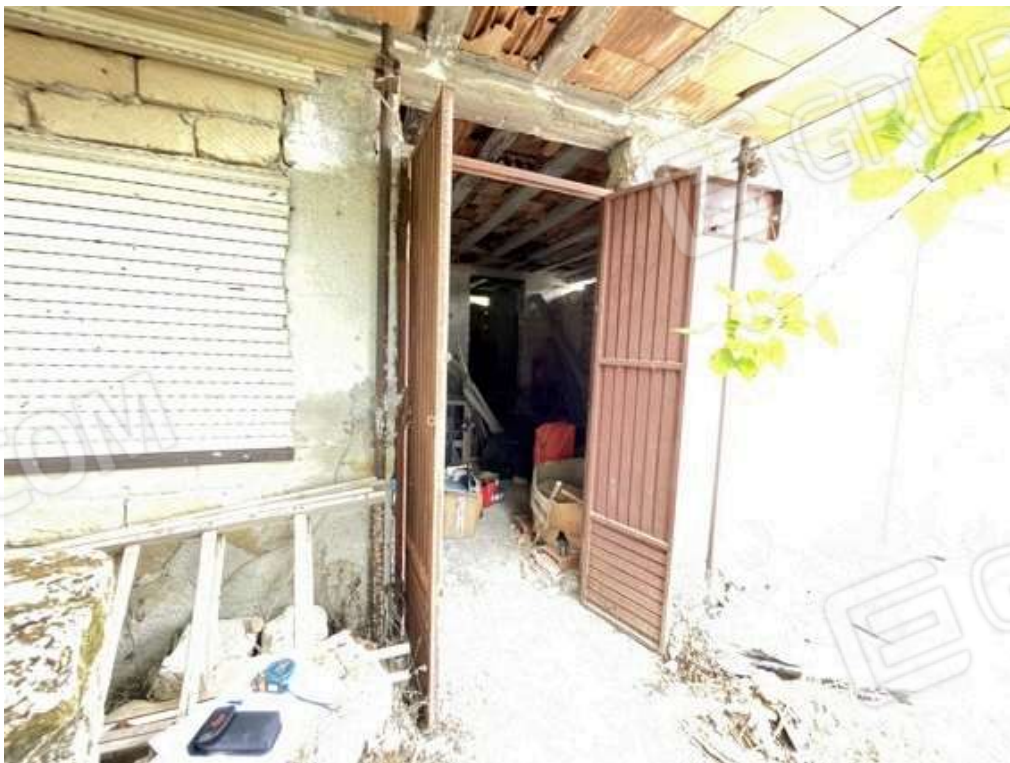
Fotografia D.42 - Prospetto est magazzino