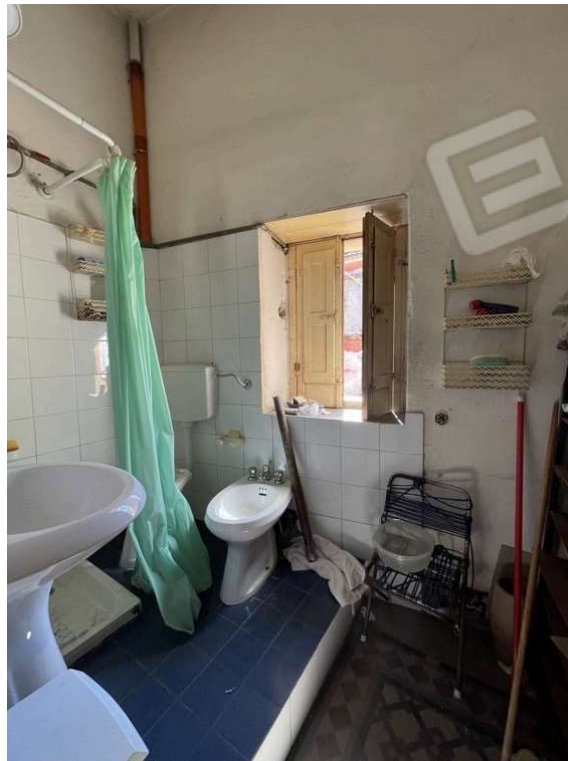
Fotografia D.20 - Piano primo: bagno