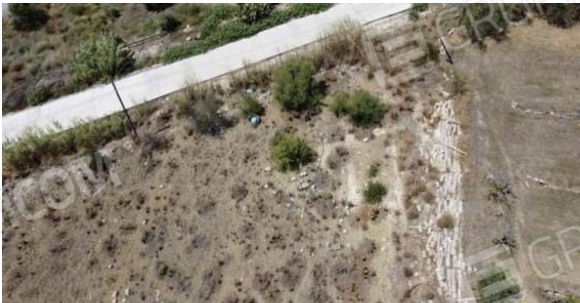
Fotografia D.74 - Terreno: lato nord-ovest della p.lla 363