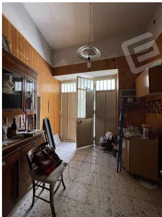
Fotografia D.4 - Entrata da via Gioachino Rossini