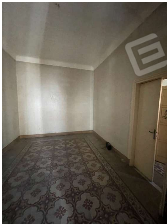
Fotografia D.12 - Satnza piano primo