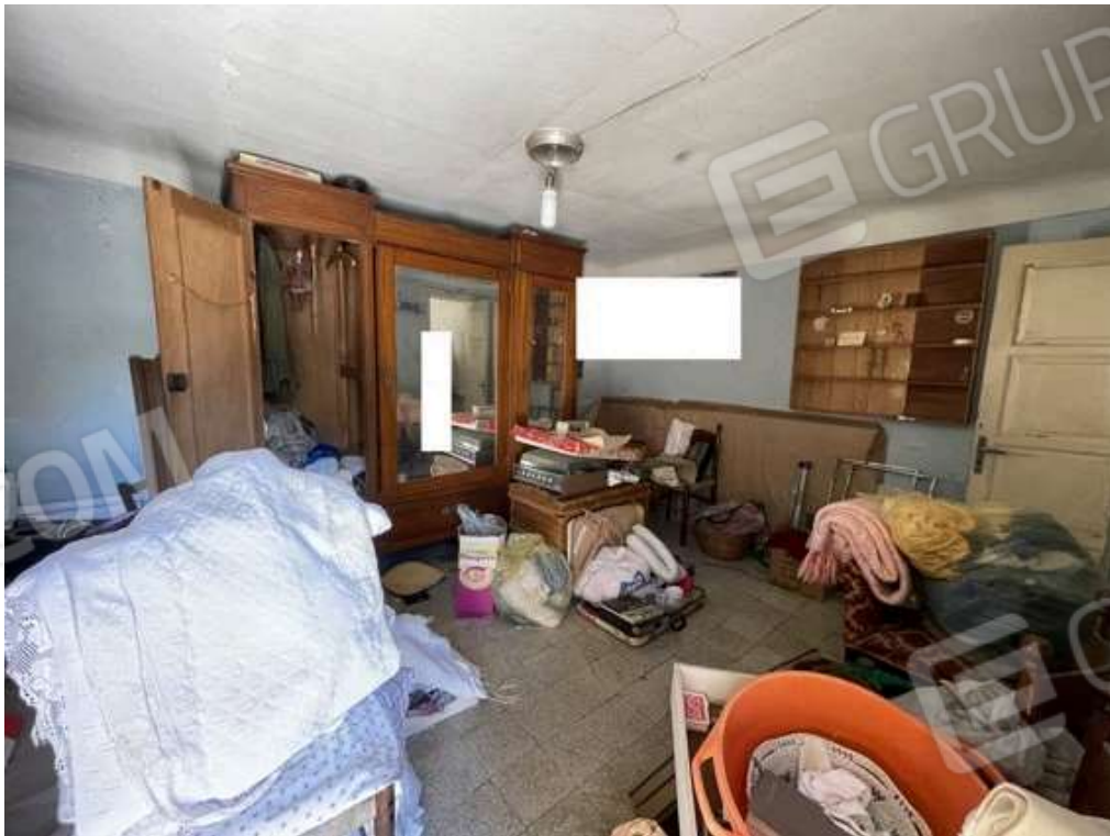
Fotografia D.34 - Piano secondo: locale che si affaccia sulla terrazzino