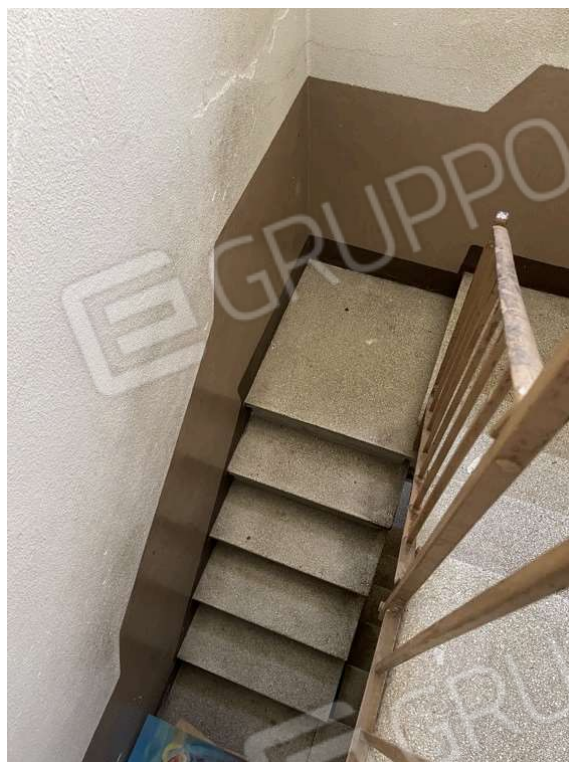
Fotografia D.37 - Scala che collega il piano primo con il piano secondo