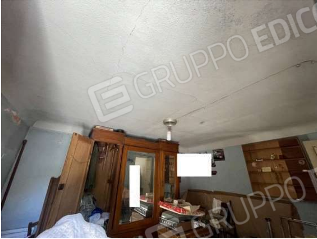
Fotografia D.33 - Piano secondo: locale che si affaccia sulla terrazzino