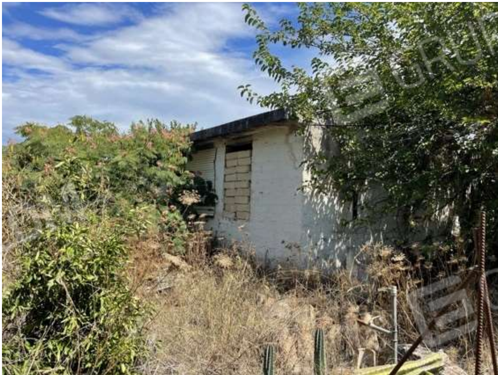
Fotografia D.66 - Magazzino: prospetto sud