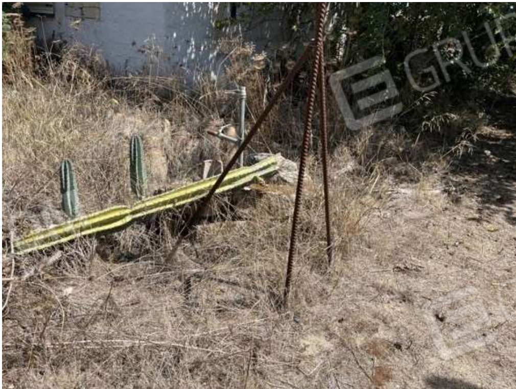
Fotografia D.68 - Particolare