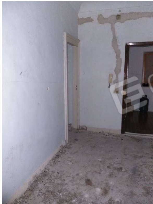
Foto 4_ingresso dell'appartamento