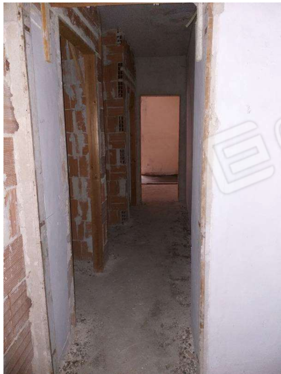
Foto 6_U.I. in ristrutturazione