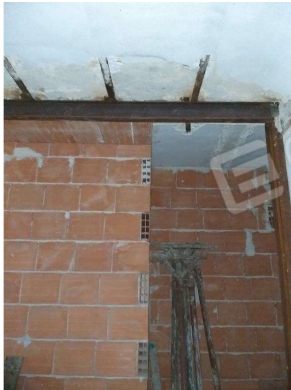
Foto 12_ particolare della trave IPE