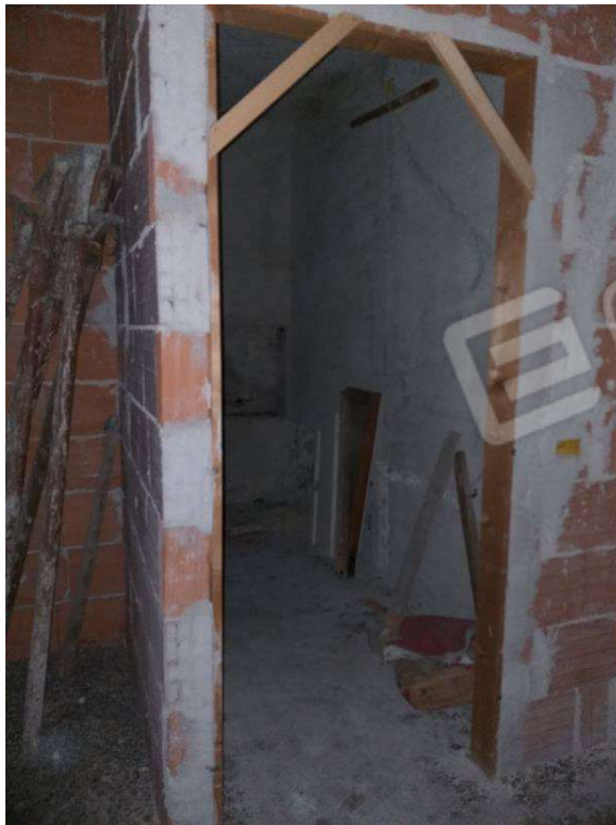
Foto 10_ U.I. in ristrutturazione