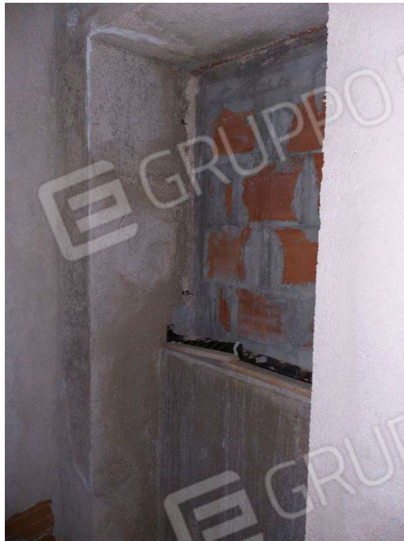
Foto 11_ particolare di una finestra murata