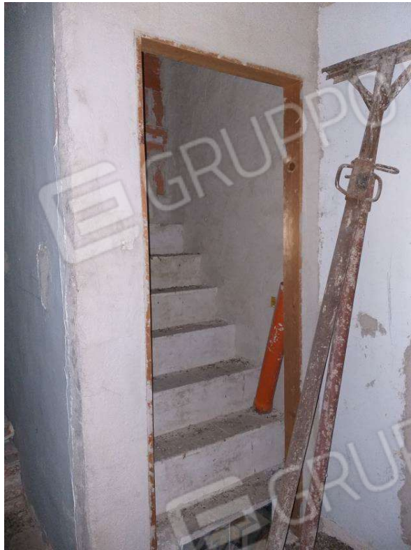
Foto 7_accesso con gradini murato