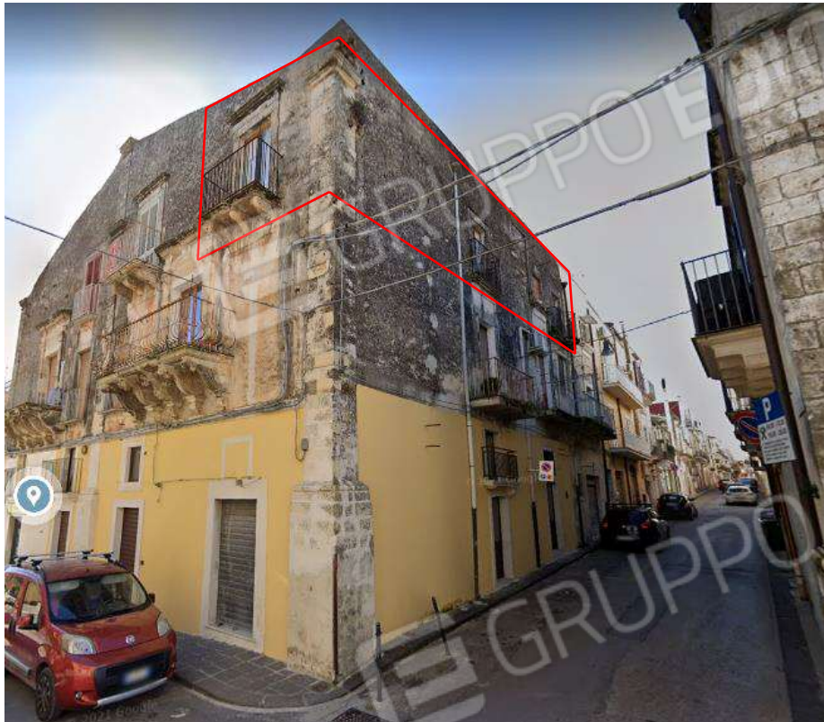
Foto 1 _individuazione dell'edificio dove si trova l'appartamento