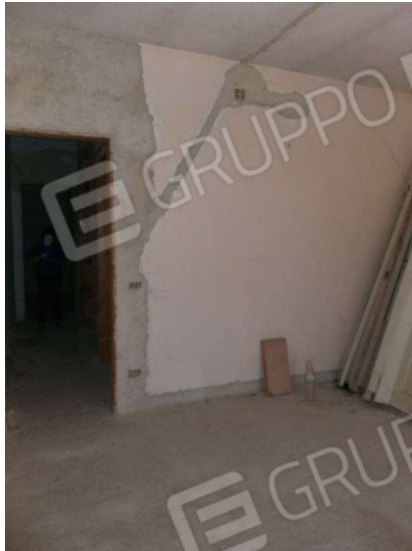
Foto 5_U.I. in ristrutturazione