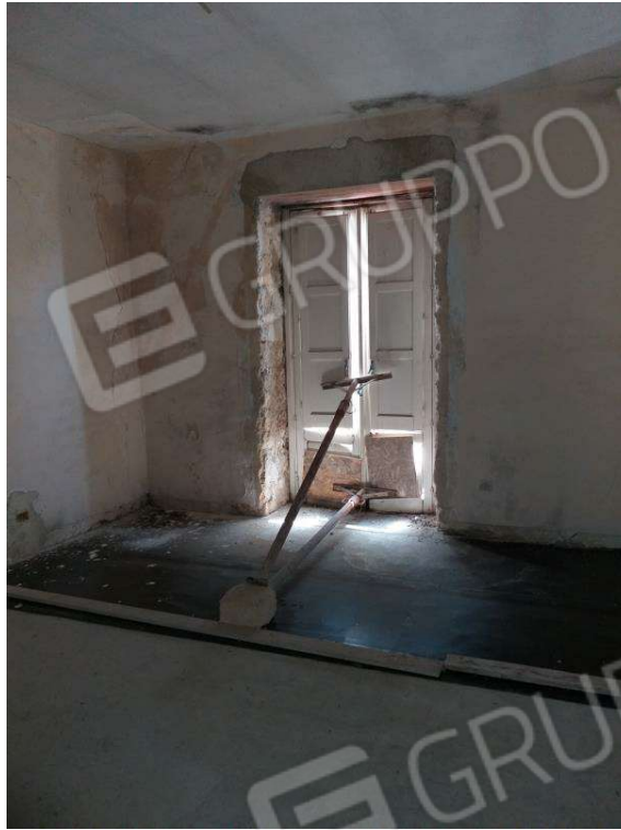
Foto 9_ U.I. in ristrutturazione