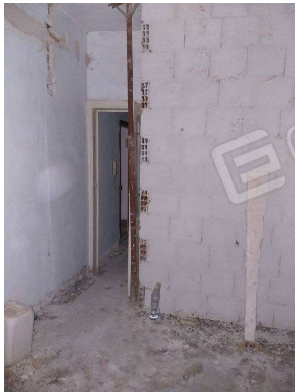
Foto 8_U.I. in ristrutturazione