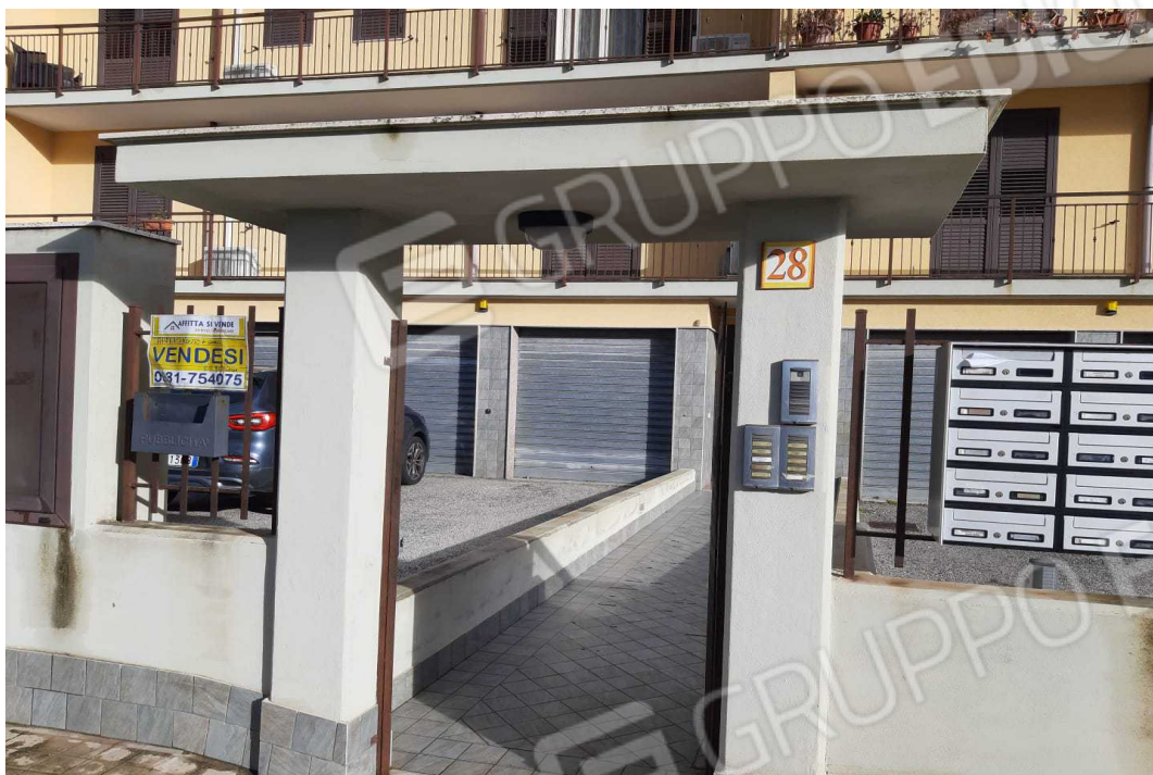
G.03A – Esterno lato Ovest – Ingresso all'edificio condominiale, dal civico 28 di via Pitagora.