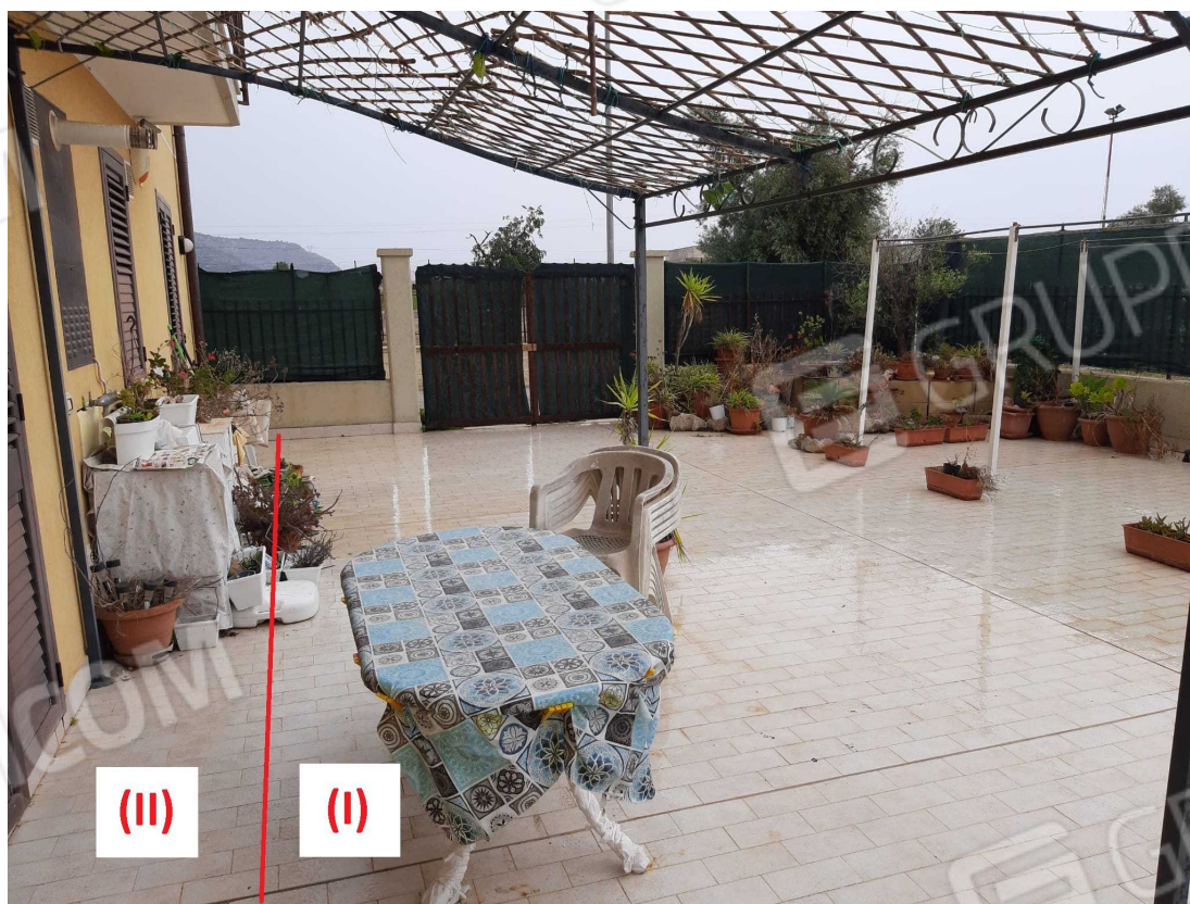
G.16A – Immobile A. Parti esterne lato Est. Spazio Condominiale (I) e spazio di pertinenza dell'immobile A (II), definiti in base alla C.E. n. 68/2008.