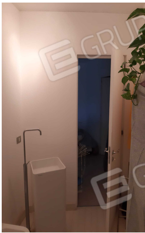
G.13A – G.14A – Immobile A. Vedute dell'Ambiente Bagno

Architetto Antonino Merendino - Via Trapani n. 5 – Siracusa