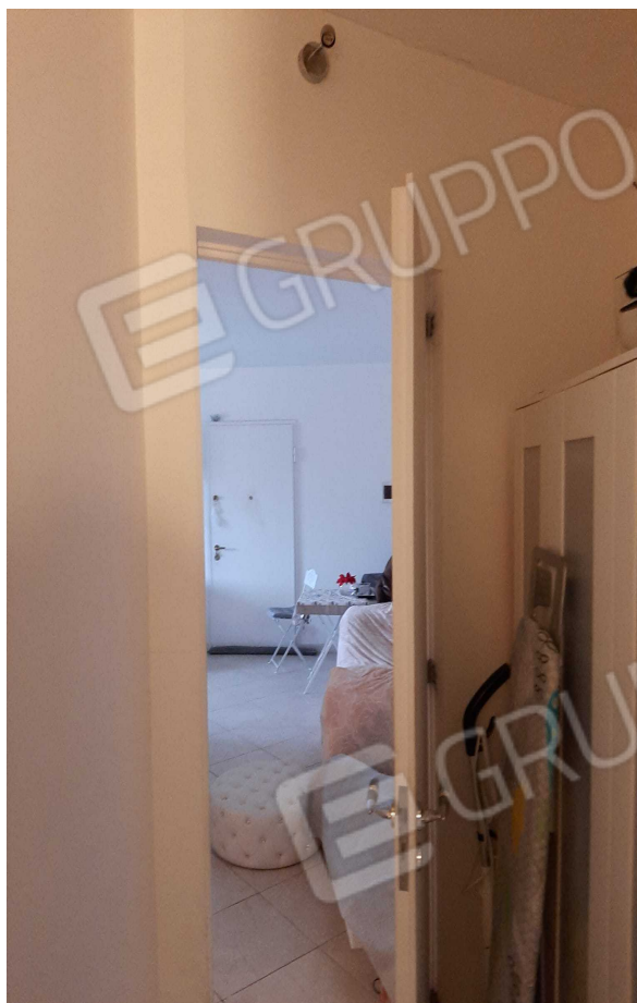
G.12A – Immobile A. Disimpegno che collega camera e soggiorno.