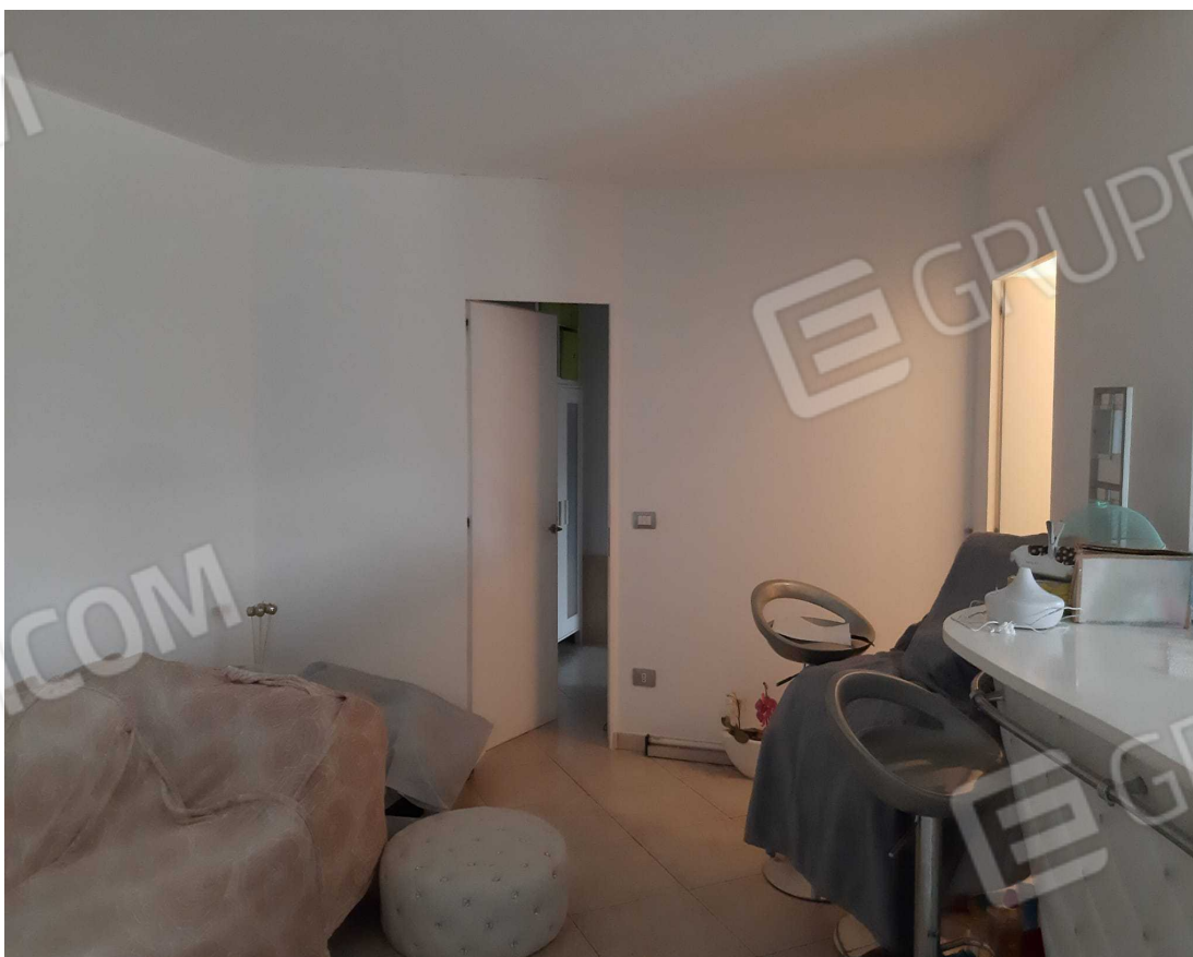
G.08A – Immobile A. Altra veduta spazio Soggiorno-cucina