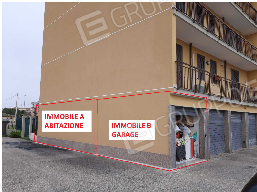
G.01B – Individuazione Immobili A e B. Veduta d'angolo da Nord-Ovest.

piano terra – ingresso da Via Pitagora n. 30 – Floridia (SR) Rip. Al C.F. al F. 19 p.lla 3091 sub. 1