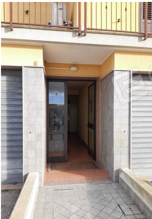
G.04A – Esterno lato Ovest – Portone d'ingresso all'atrio e vano scala

Architetto Antonino Merendino - Via Trapani n. 5 – Siracusa