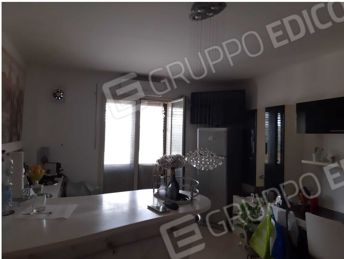
G.07A – Immobile A. Altra veduta spazio Soggiorno-cucina