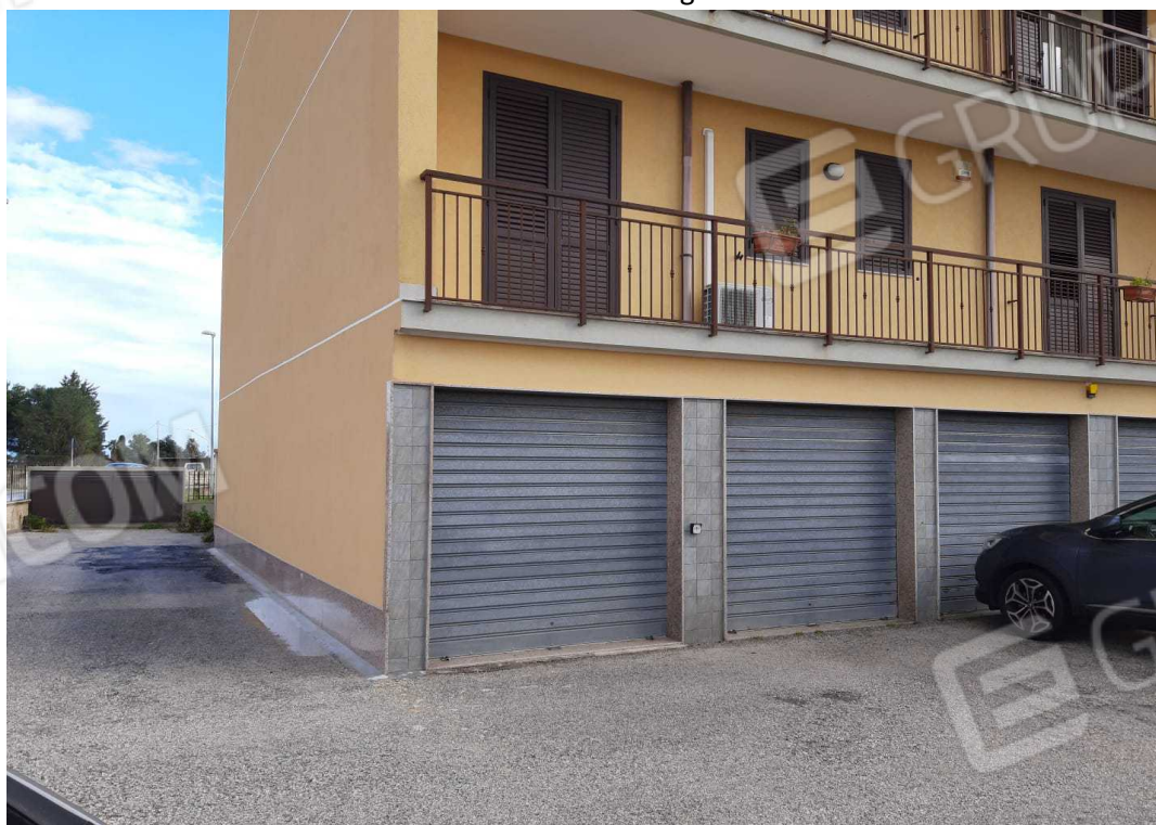
G.02B – Immobile B. Altra Veduta d'angolo da Nord-Ovest.