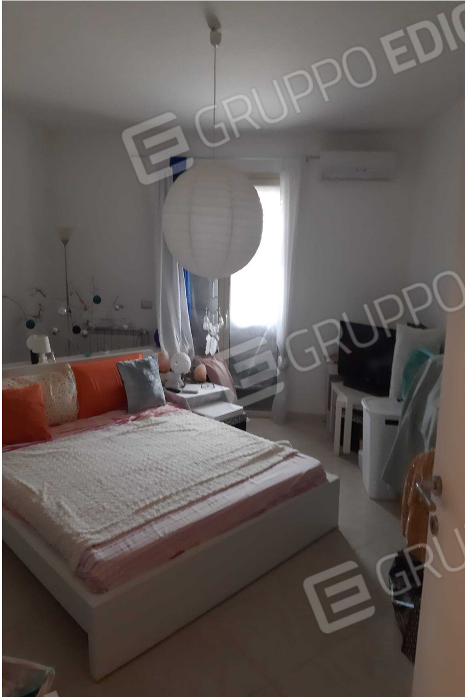
G.09A – Immobile A. Ambiente camera da letto.