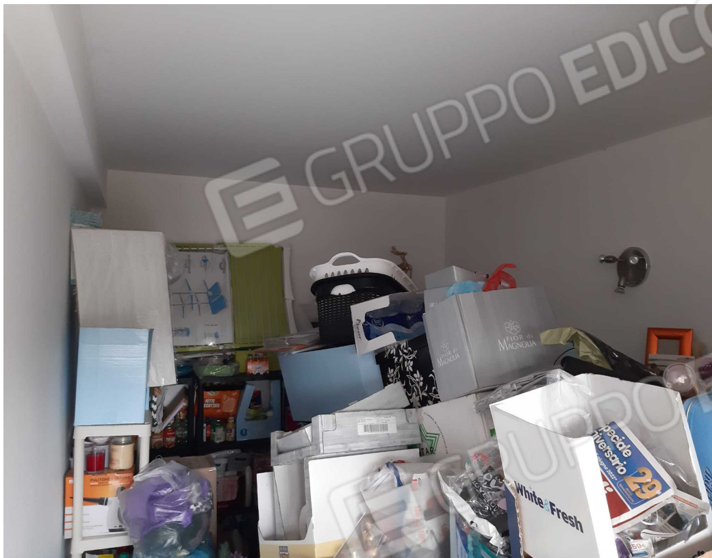
G.05B – Veduta interna dell'immobile B, composto da un monovano.