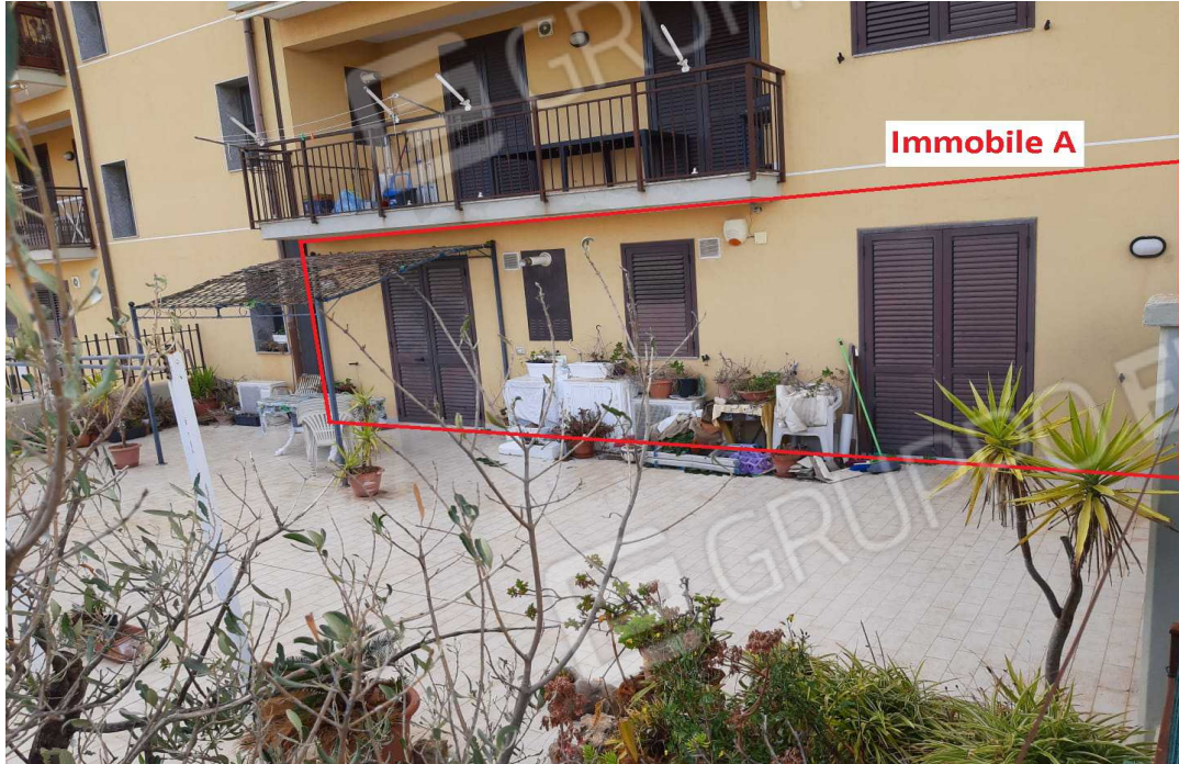
G.01A – Esterno lato Est - edificio in cui è ubicato al piano terra l'Immobile A.