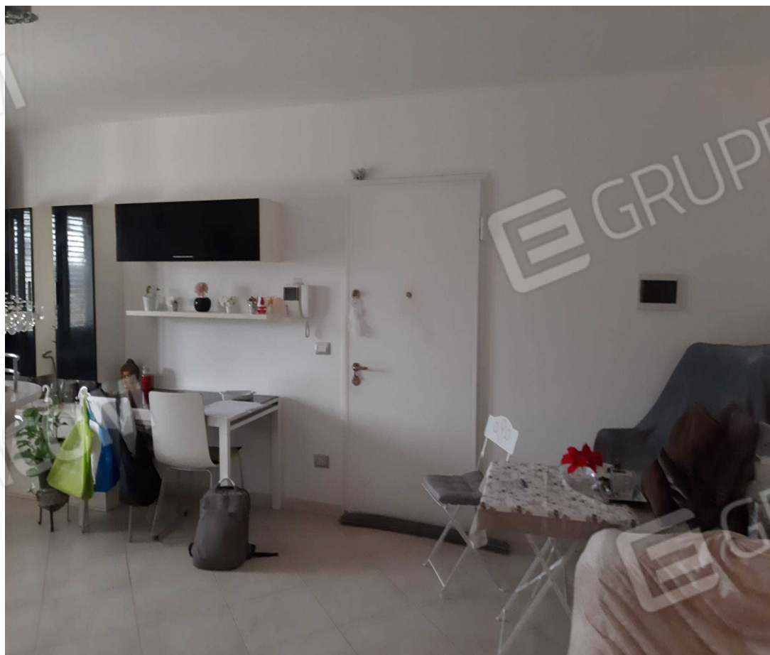
G.06A – Immobile A. Spazio Soggiorno-cucina

Architetto Antonino Merendino - Via Trapani n. 5 – Siracusa