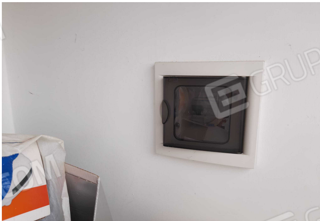
G.06B – Altra veduta interna dell'immobile B, composto da un monovano.