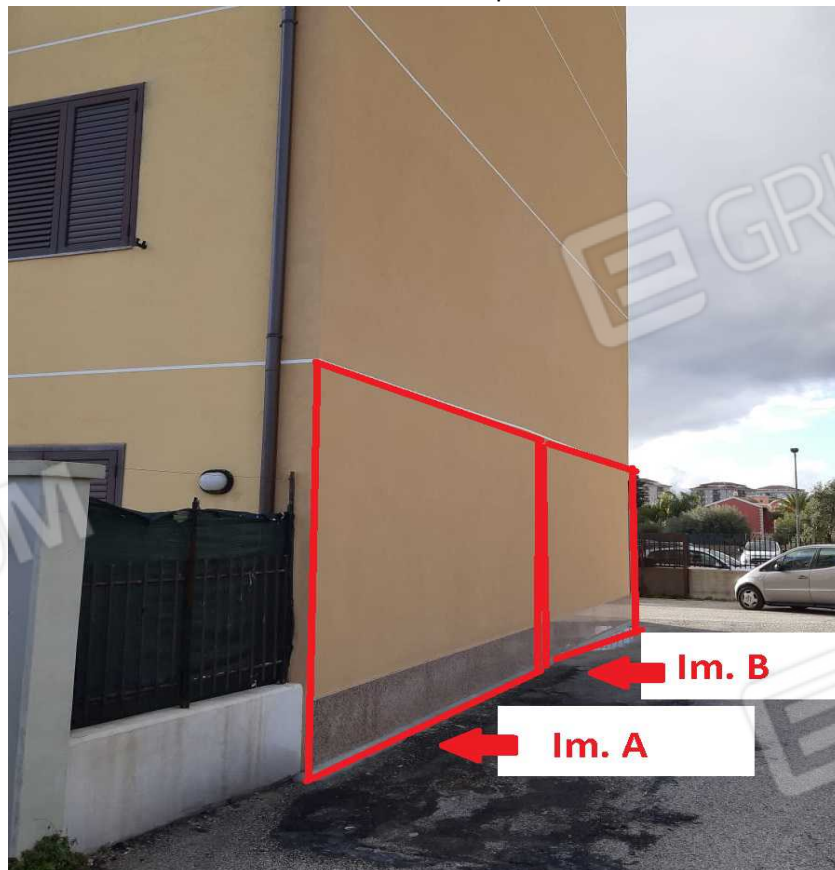
G.02A – Esterno lato Nord – indicazione al piano terra Immobili A e B.

Architetto Antonino Merendino - Via Trapani n. 5 – Siracusa