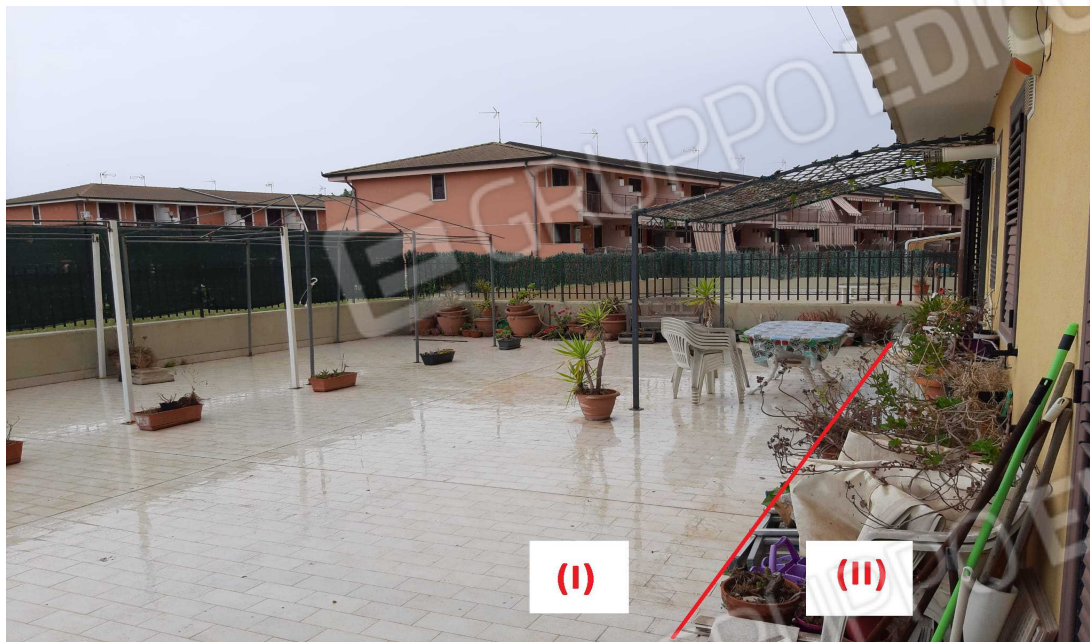
G.15A – Immobile A. Parti esterne lato Est. Spazio Condominiale (I) e spazio di pertinenza dell'immobile A (II), definiti in base alla C.E. n. 68/2008.