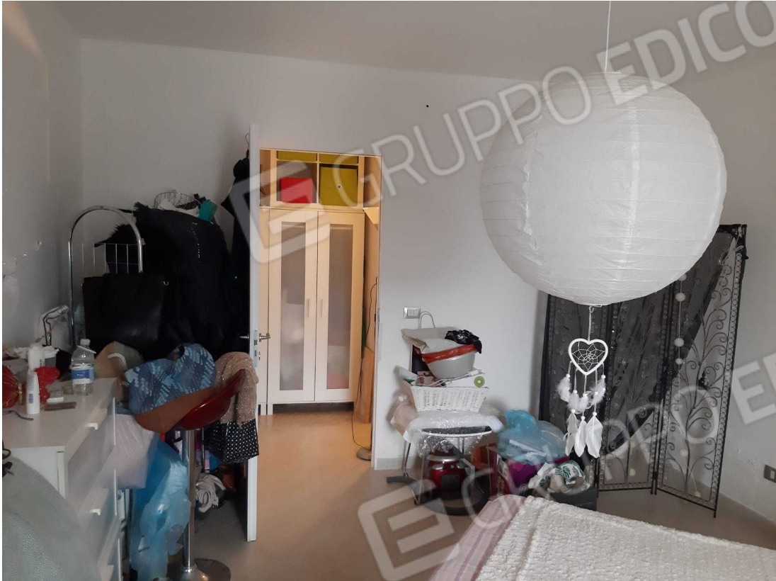
G.10A – Immobile A. Altra veduta dell'ambiente camera da letto.