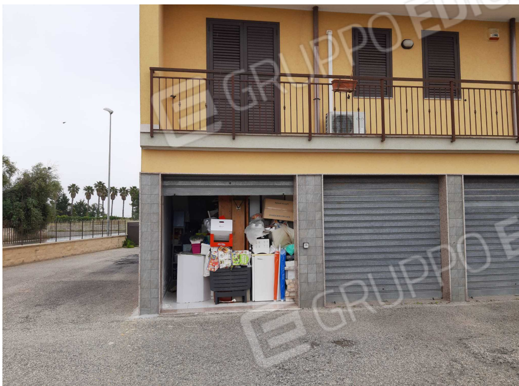
G.03B – Veduta dal lato Ovest. Ingresso all'immobile B da spazio esterno condominiale