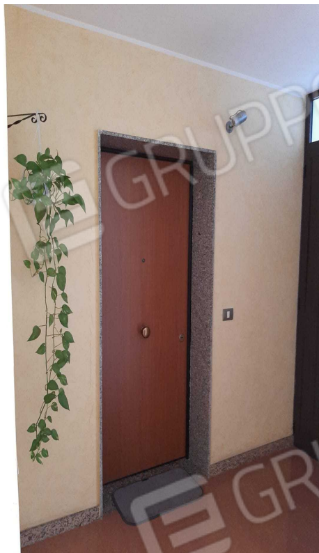
G.05A – Porta d'ingresso Immobile A – Piano terra, int. 1 .