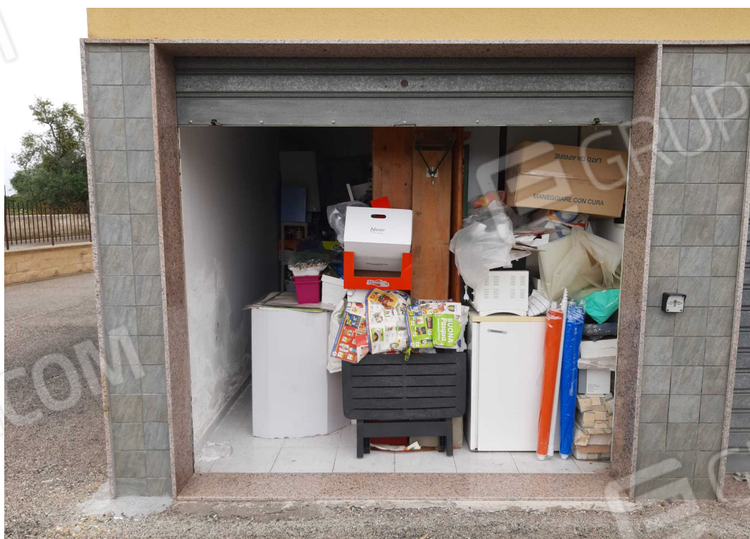
G.04B – altra Veduta dal lato Ovest. Ingresso all'immobile B da spazio esterno condominiale