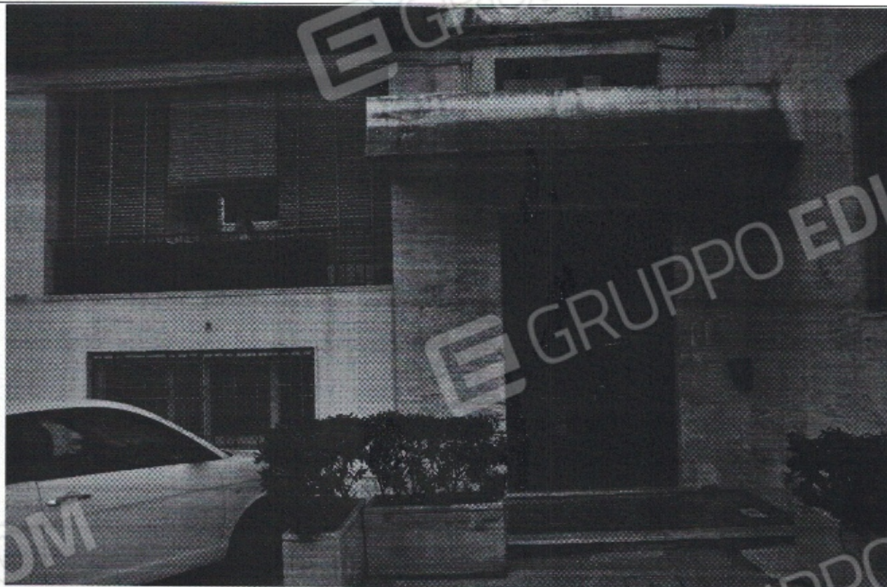
FOTO N.1 – Portone d'ingresso palazzina A scala D, prospetto nord