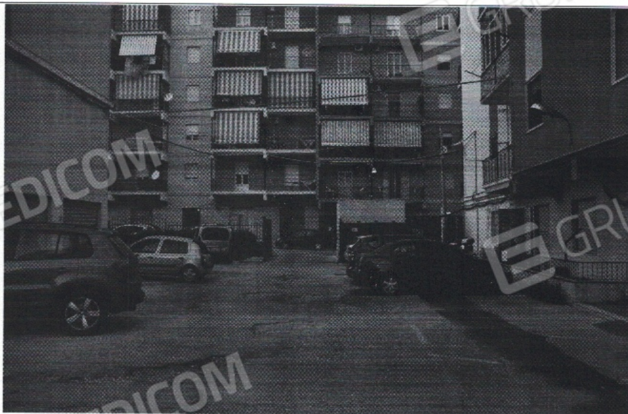
FOTO N.2 – Cortile condominiale e cancello d'ingresso dalla via Emilia