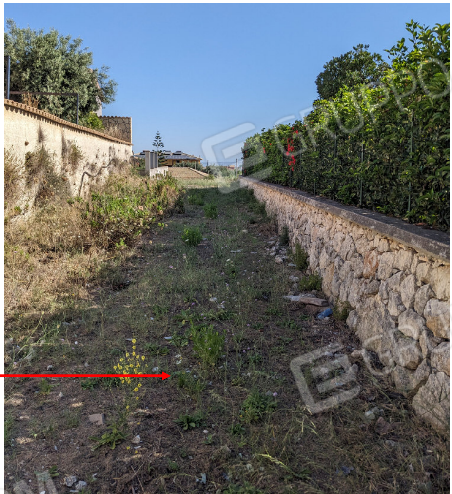
Particella 1070 Stradella di accesso di proprietà comunale