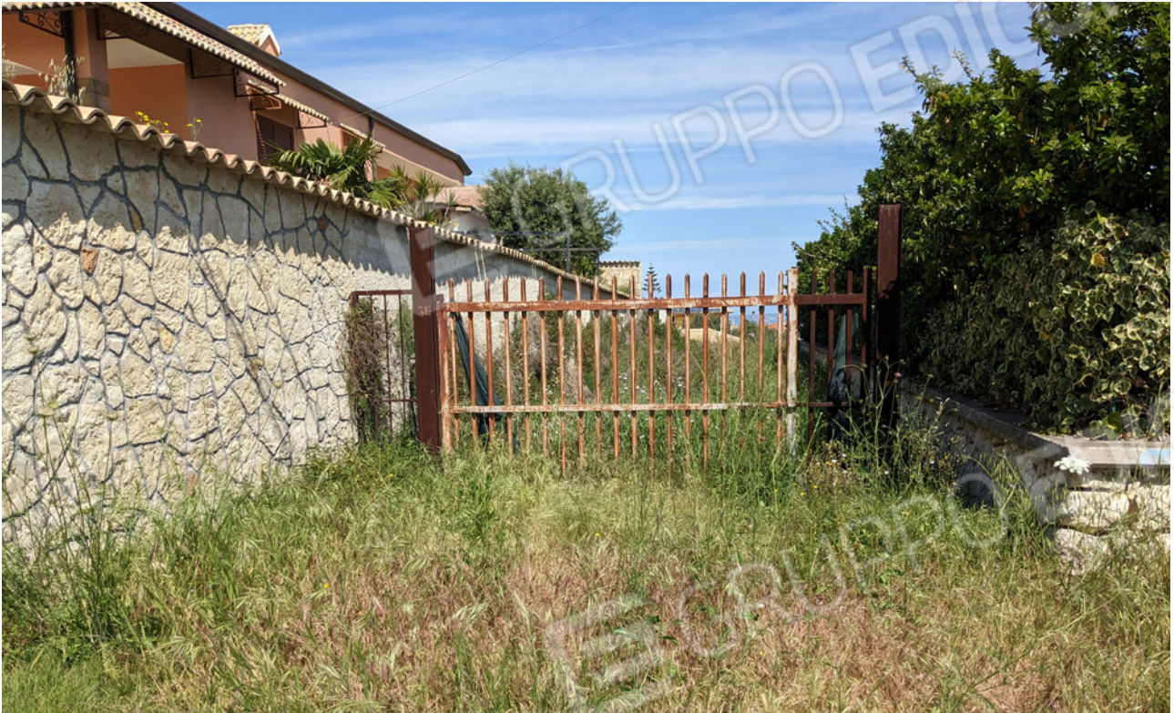
Accesso da Via Mascagni n.36