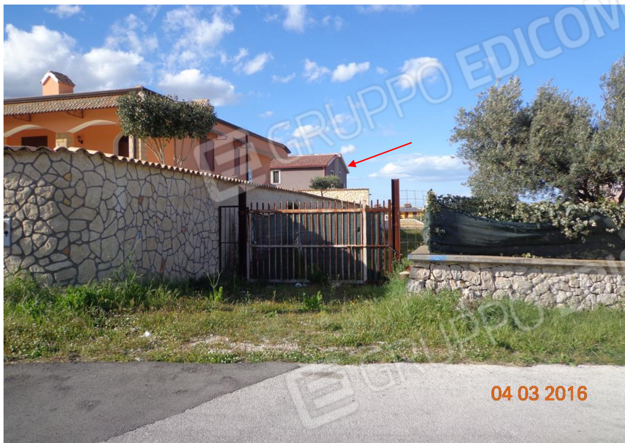
Via Mascagni n.36, Città Giardino, Melilli