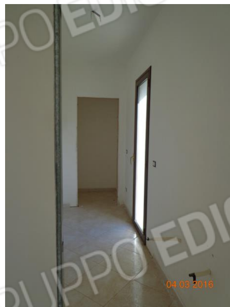
Lavanderia e ripostiglio