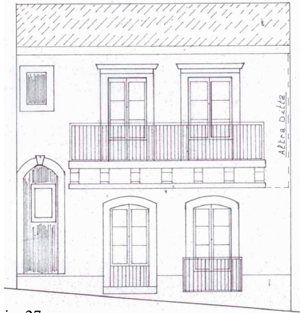
Prospetto su via Paolo Sarpi n.27