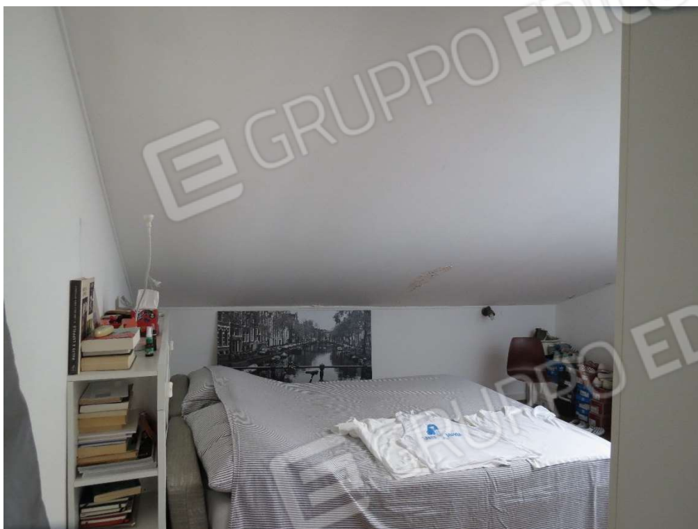
Foto n. 32: Porzione del sub 37 di proprietà di altra ditta abusivamente annessa al Lotto B6