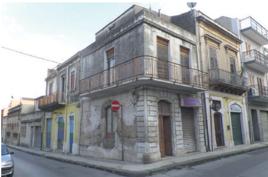
Immagine 1. Immobile sito a Floridia in Via Archimede n° 146 angolo Via Giusti

Sia nel terrazzo che nel balcone prospiciente su Via Giusti non sono definiti i confini con l'unità immobiliare adiacente (lato Est) che in passato costituiva un'unica abitazione con quello oggetto di perizia.