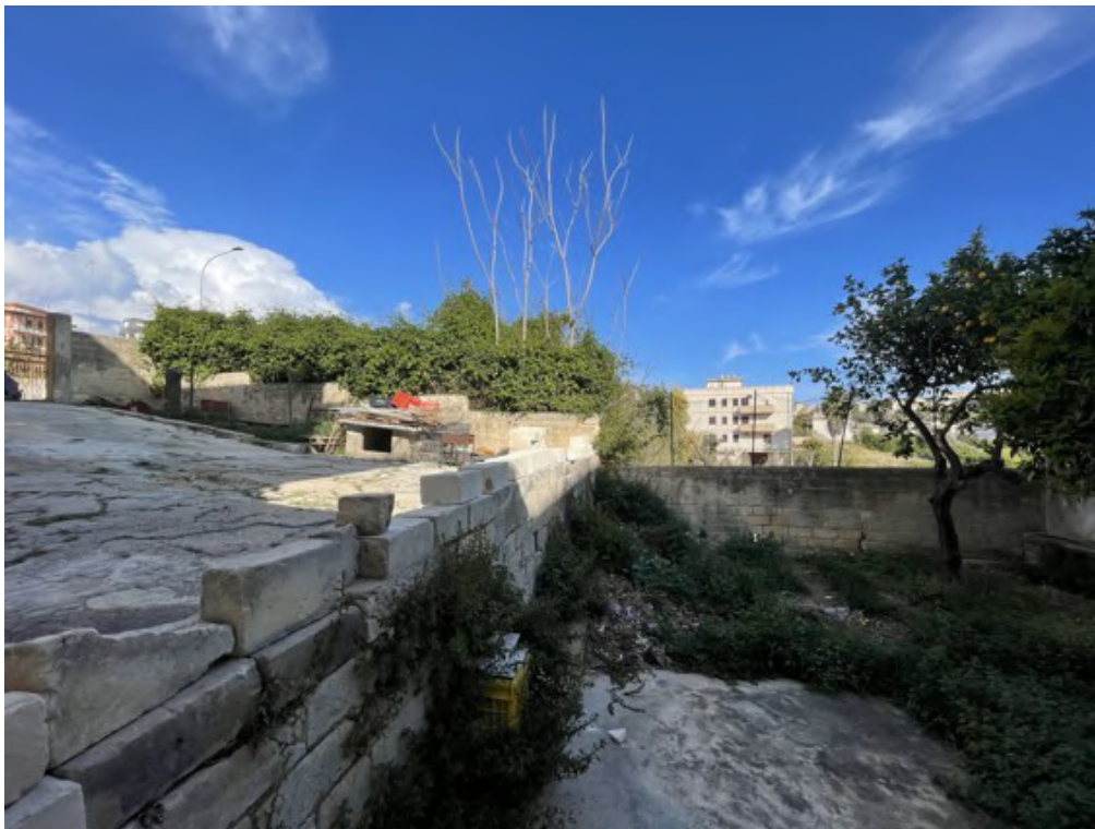
Fotografia C.8 - Confine con la particella 687