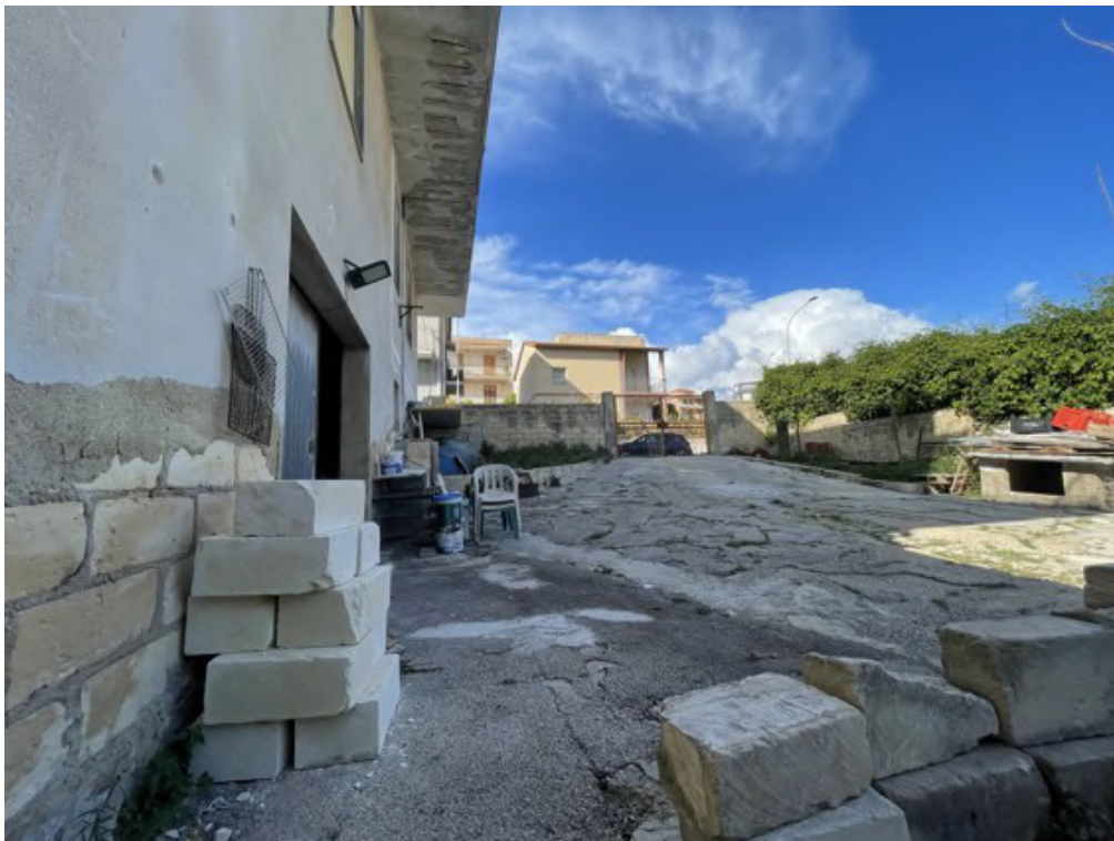
Fotografia C.6 - Area di pertinenza: area edificabile utilizzata come parcheggio (p.lla 686).