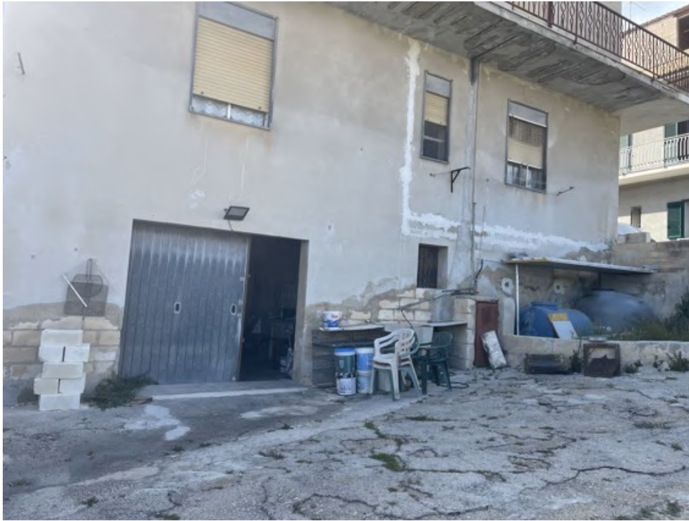
Fotografia C.9 - Entrata garage