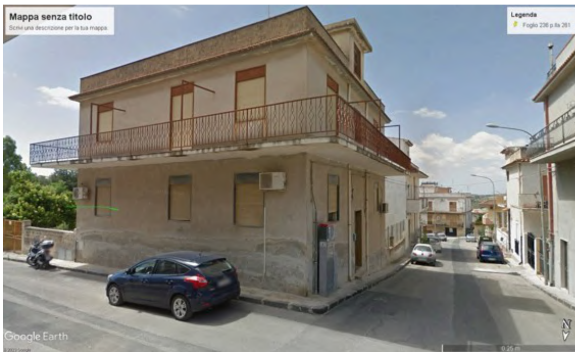
Fotografia C.3 - Prospetto nord-ovest