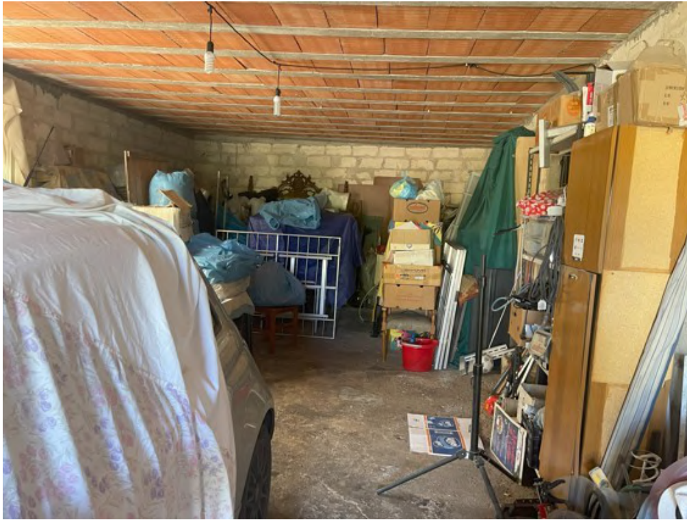
Fotografia C.17 - Piano sottoscala: garage