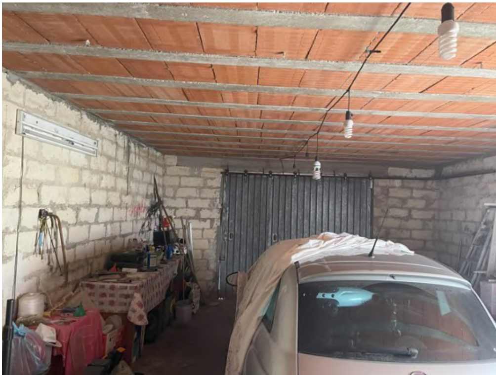
Fotografia C.18 - Piano sottostrada: garage