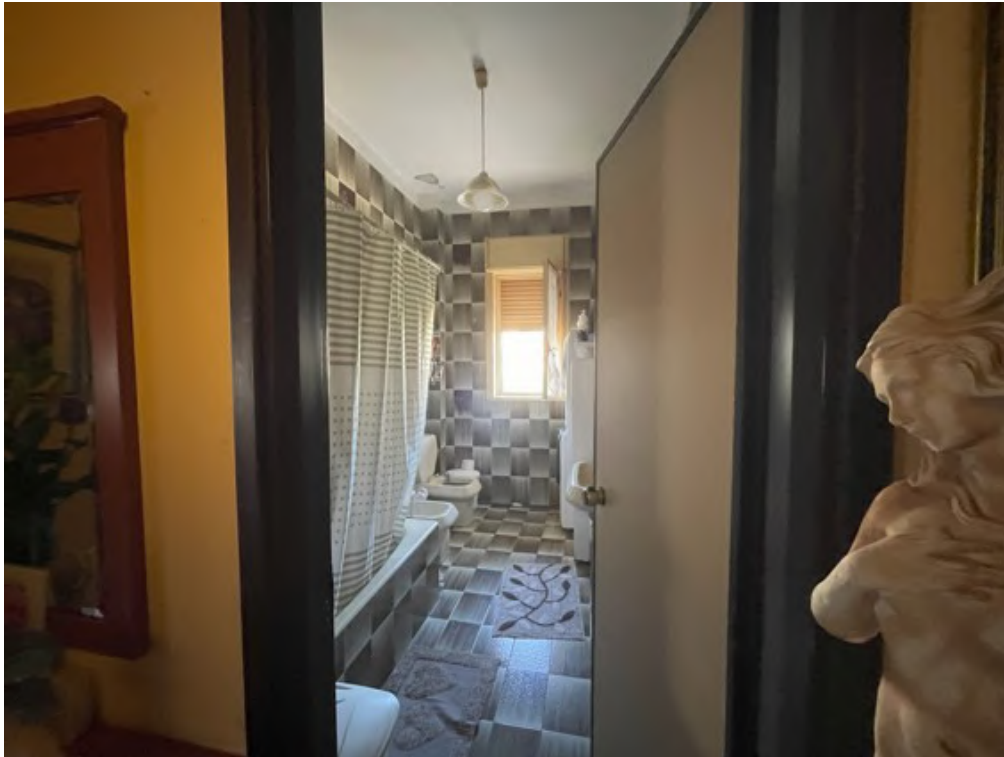
Fotografia C.15 - Pino terra rialzato:bagno