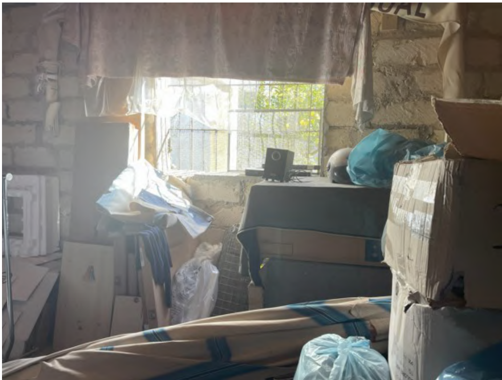
Fotografia C.20 - Piano sottostrada: w.c.