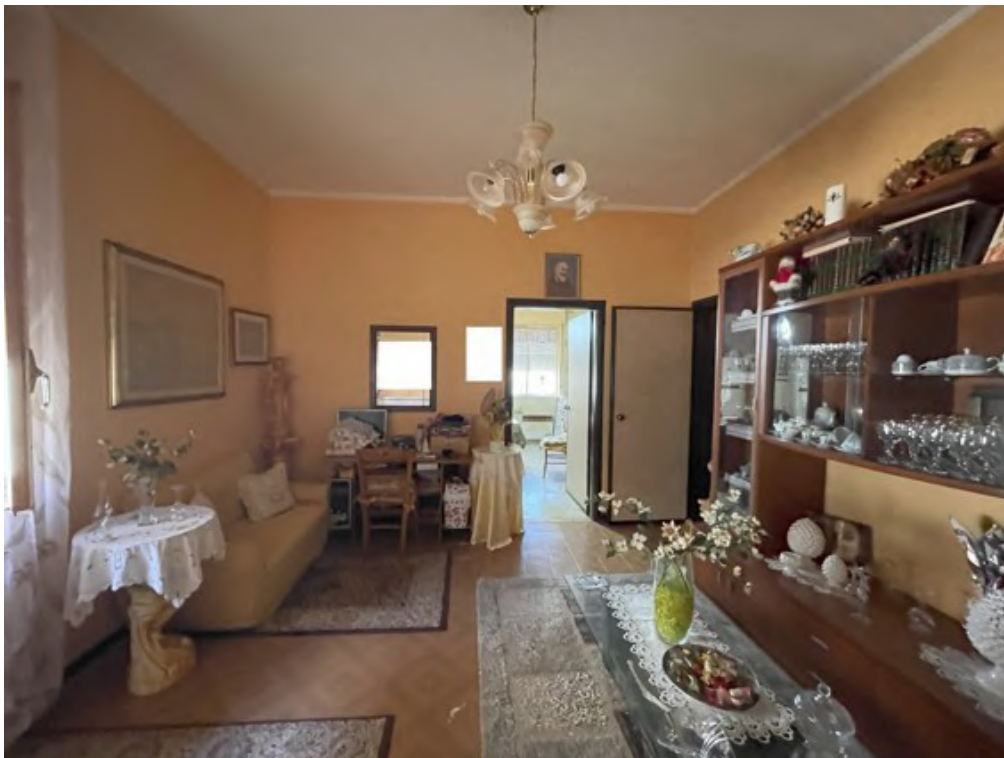
Fotografia C.14 - Piano terra rialzato: soggiorno