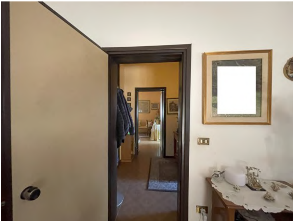
Fotografia C.12 - Piano terra rialzato