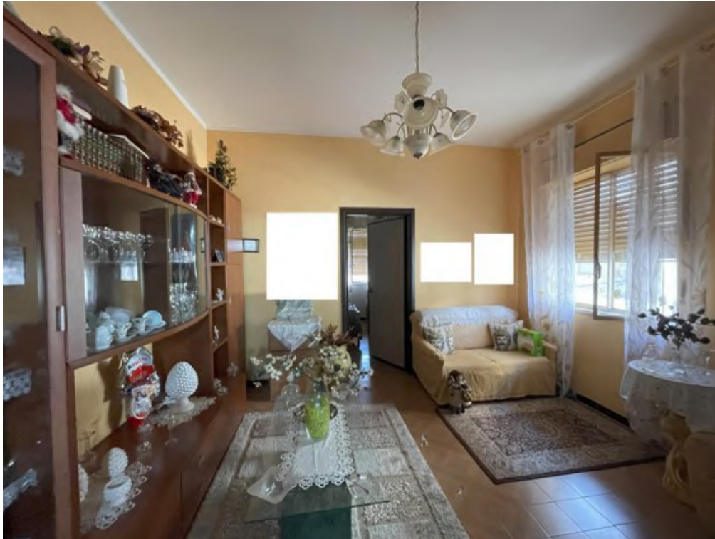
Fotografia C.13 - Piano terra rialzato: soggiorno