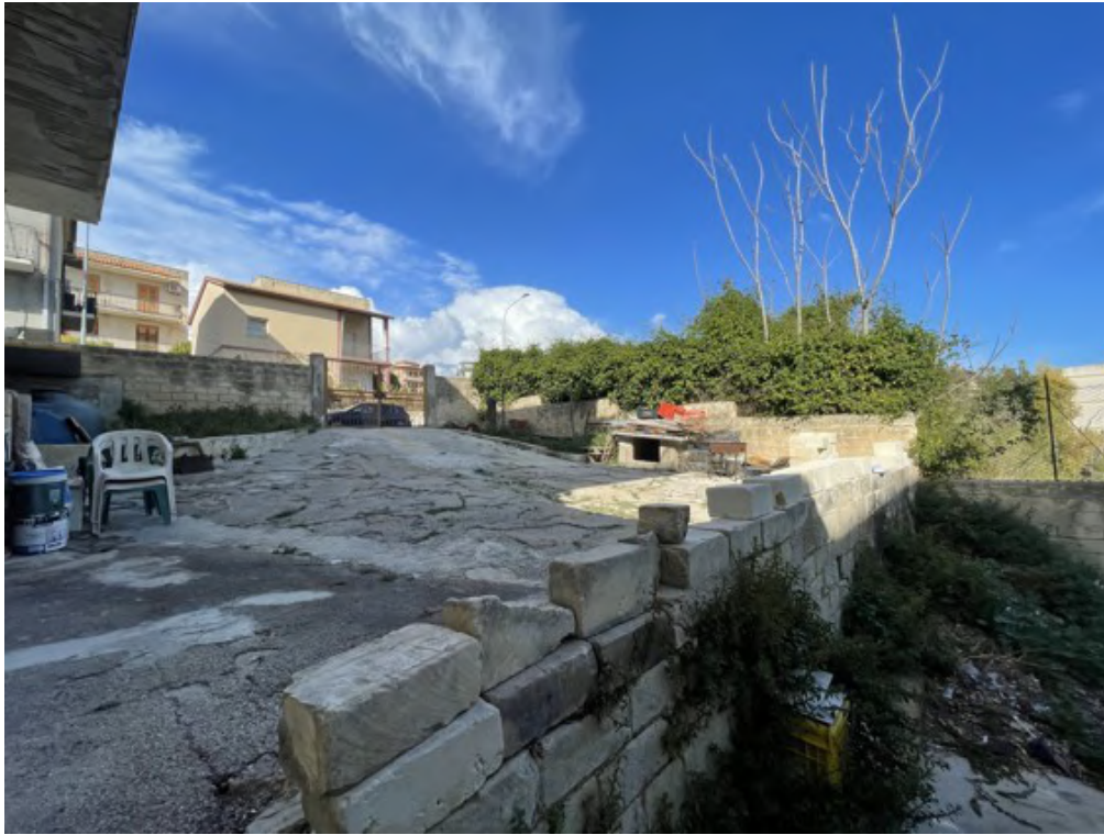
Fotografia C.7 - Confine con la particella 687