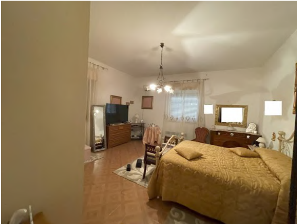
Fotografia C.11 - Piano terra rialzato: letto