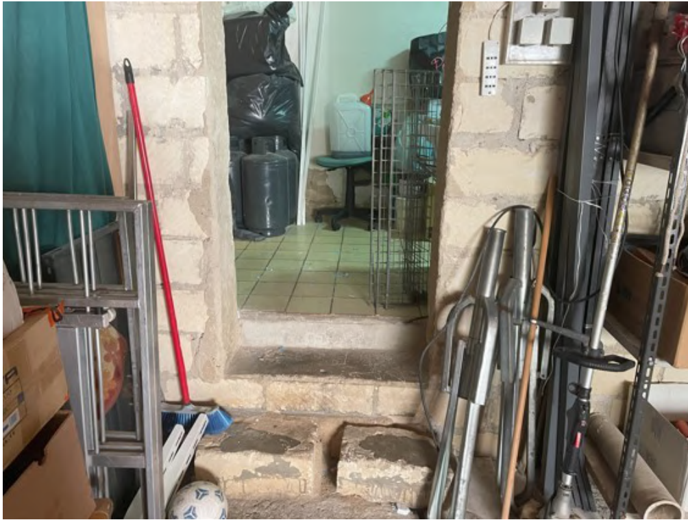
Fotografia C.19 - Piano sottostrada: entrata garage