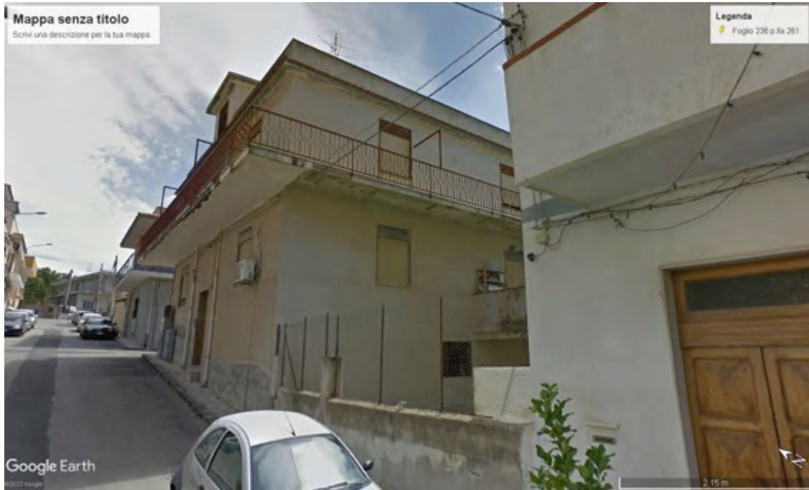
Fotografia C.1 - Prospetto sud-ovest