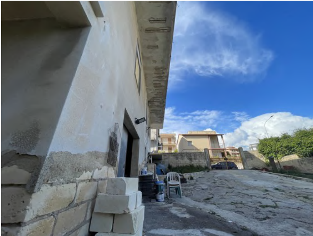
Fotografia C.5 - Piano sottostrada: entrata lato nord