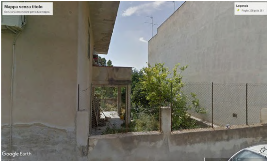
Fotografia C.2 - Prospetto sud-ovest