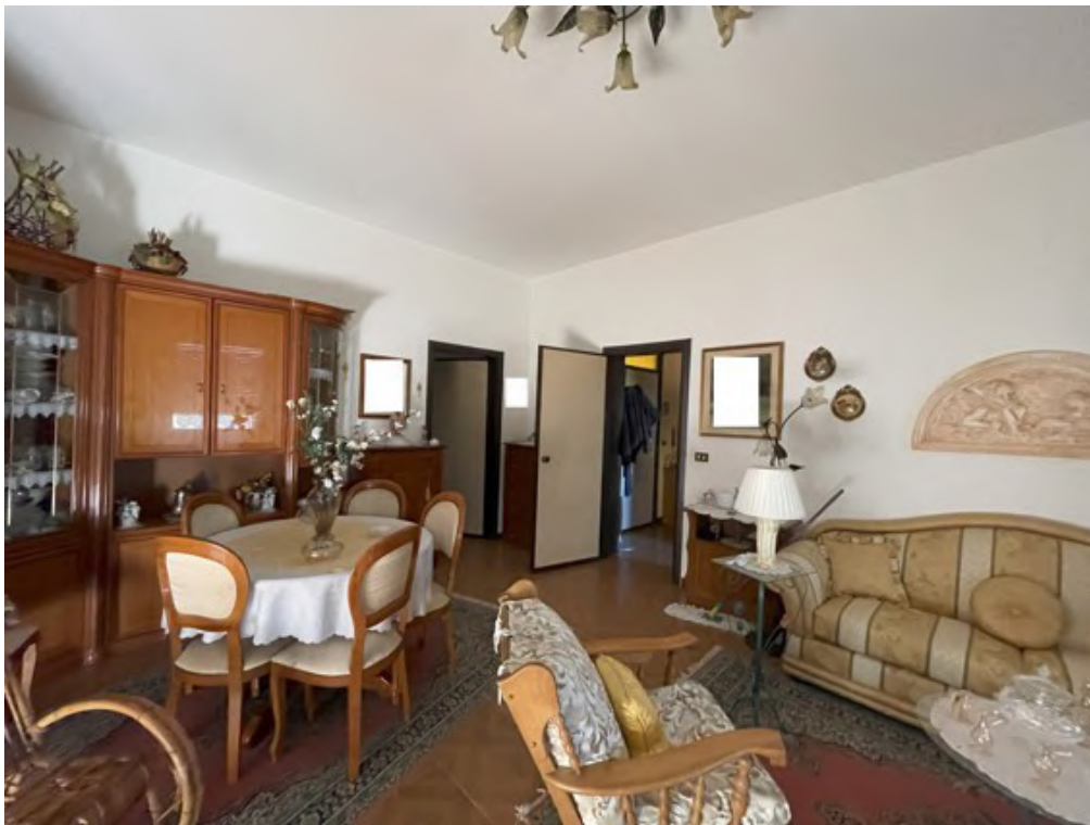
Fotografia C.10 - Piano terra rialzato: salotto