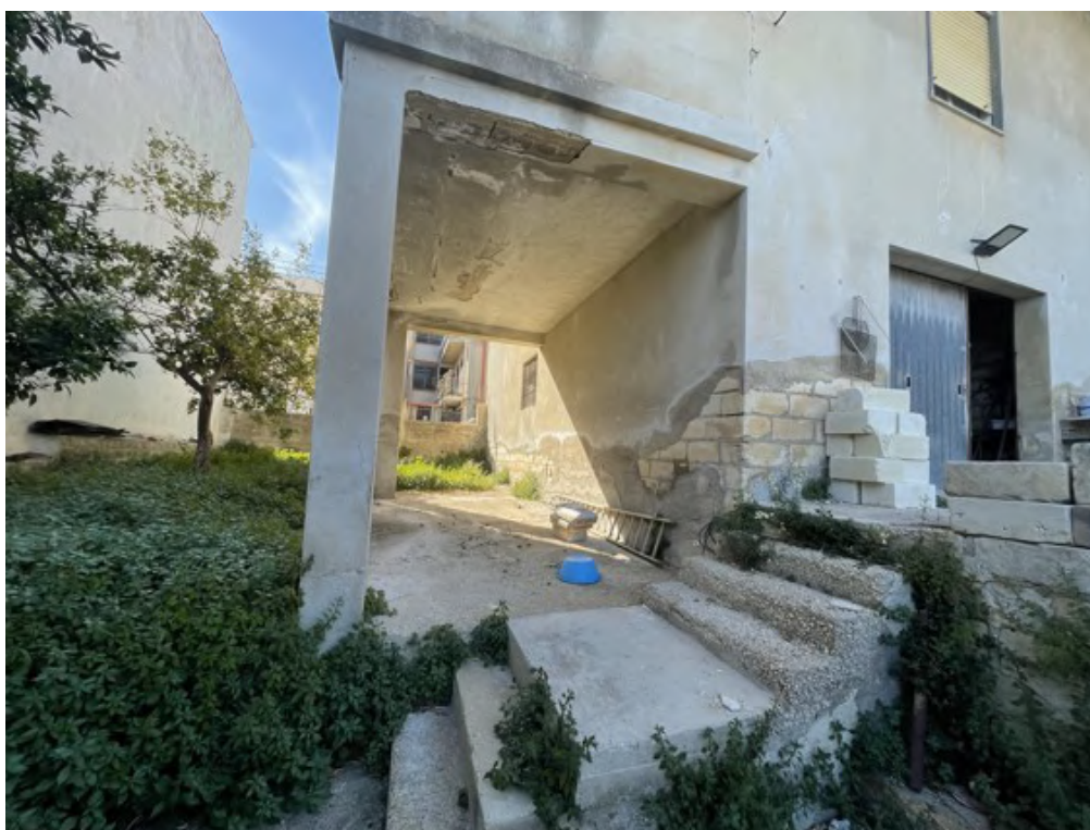
Fotografia C.4 - P.Ila 261 sub 5 (Portico):non rientra nel compendio pignorato.