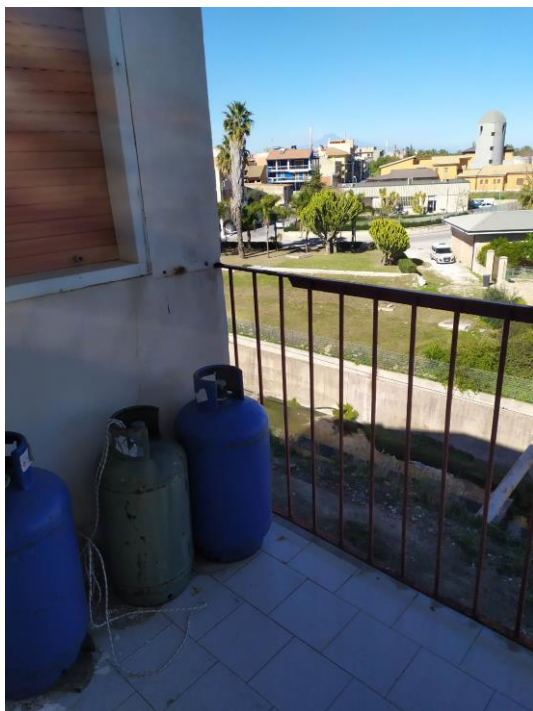
Loggia sul lato nord