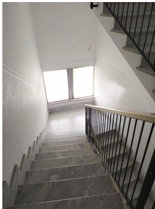
Vano scala del condominio

Nella seguente tabella si riportano le superfici utili dell'appartamento: