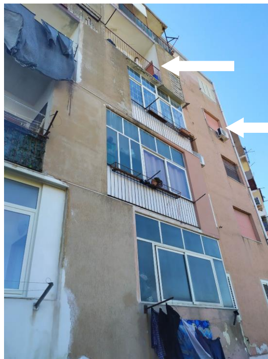
Prospetti est e ovest con indicazione del piano dell'appartamento pignorato