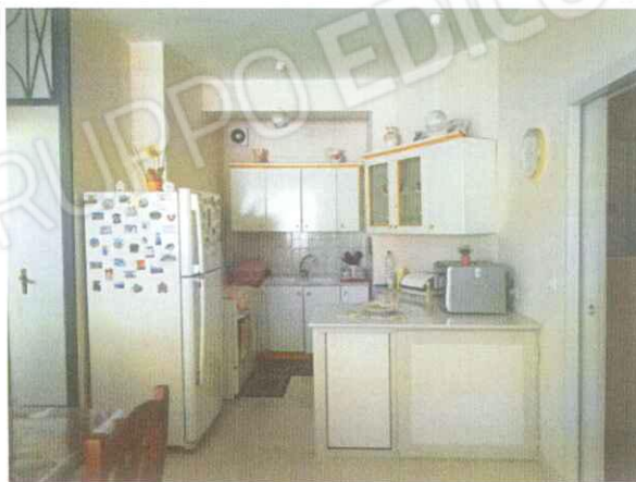
foto 6 - soggiorno-cucina