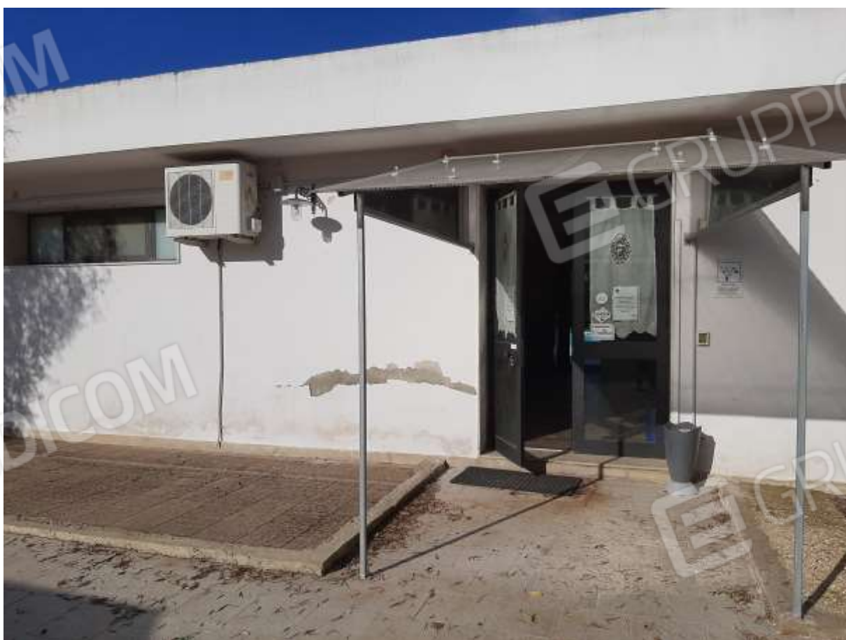
Foto n.9 – ingresso principale al fabbricato antistante le piscine, destinato a ristorante