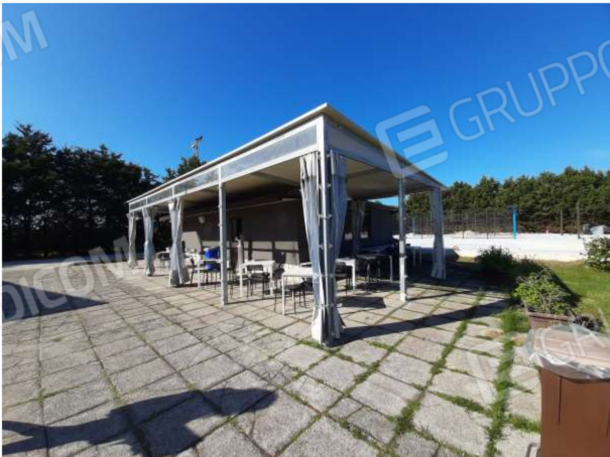
Foto n. 16 e 17 - una copertura chiusa con pannelli (ad uso Bar) con veranda per tavolini