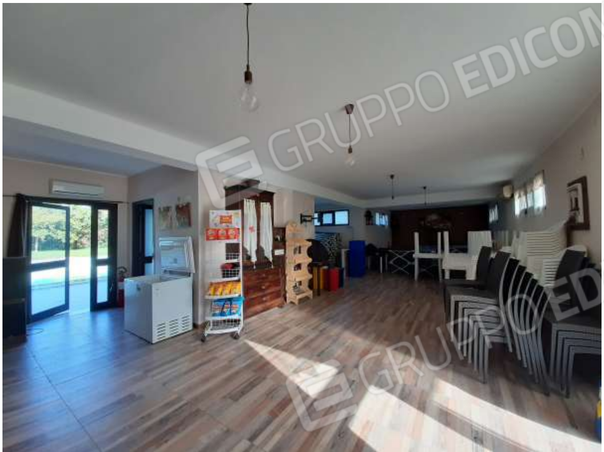
Foto n.10 e 11 – ingresso principale al fabbricato antistante le piscine, destinato a ristorante