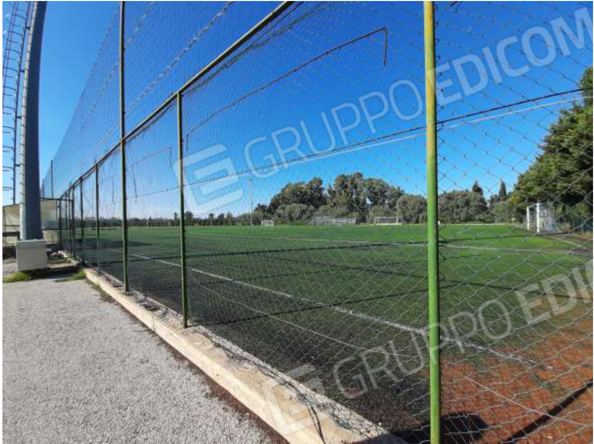
Foto n.29/30 – un campo da calcio a undici in erba sintetica, recintato e dotato di impianto di illuminazione con pali