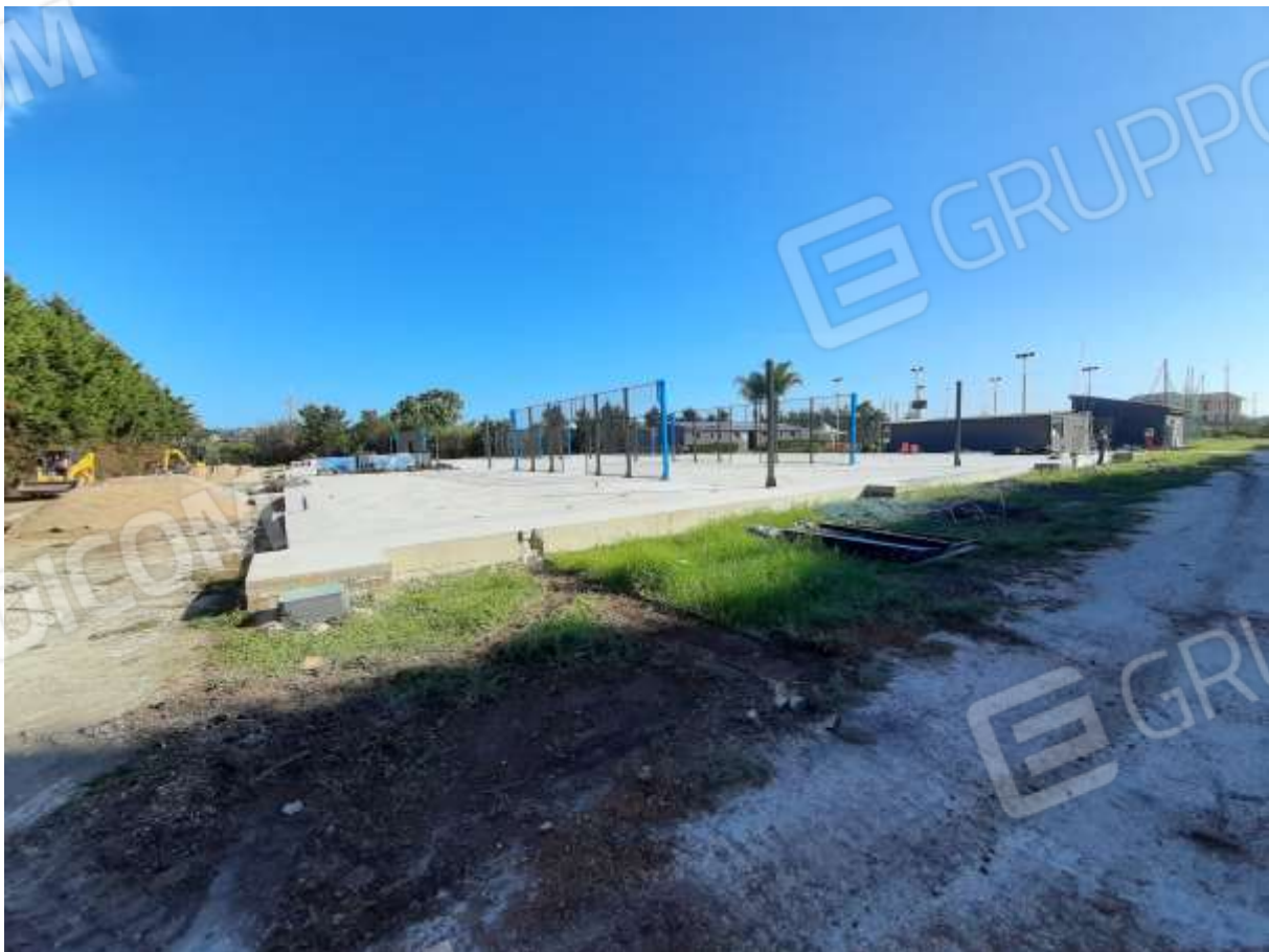
Foto n.15 – campi da Padel-Tennis in sostituzione di un campo di calcio a 7