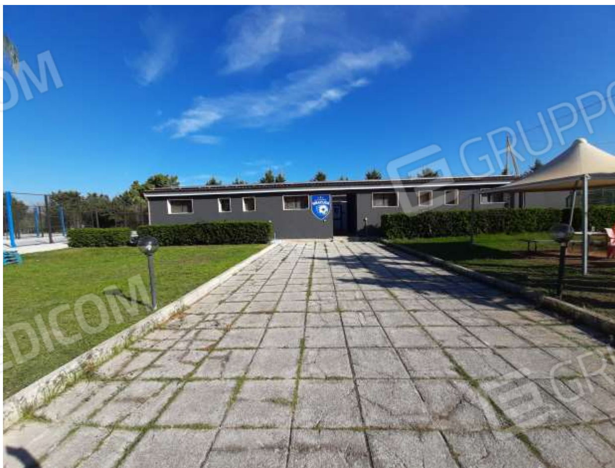
Foto n. 24-25 -26-27-28 – due fabbricati adibiti a spogliatoi al servizio dei campi da calcio