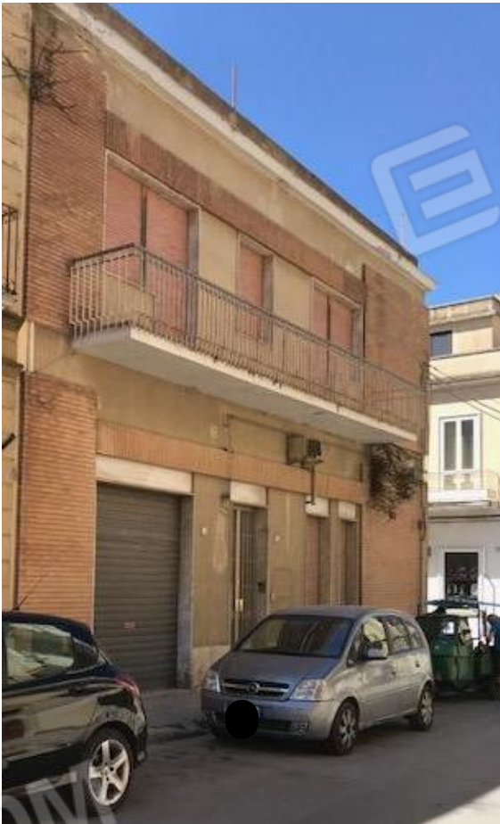
VISTA 1_ Prospetto Via Garrano