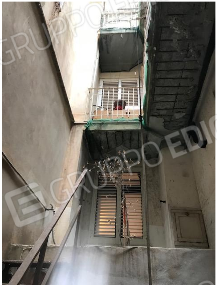
VISTA 2_ Pozzo Luce