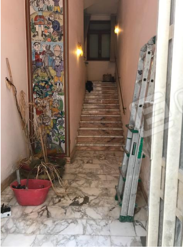
VISTA 8 _ Vano scala P.T./P.1°