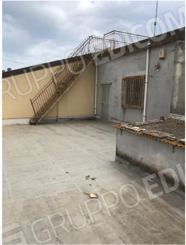
VISTA 5 _ Terrazzo