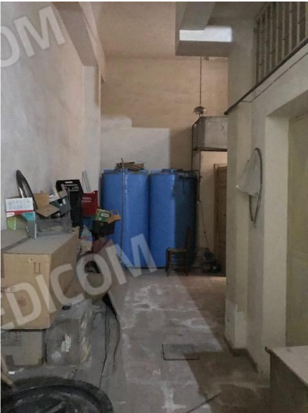
VISTA 6 _ Garage