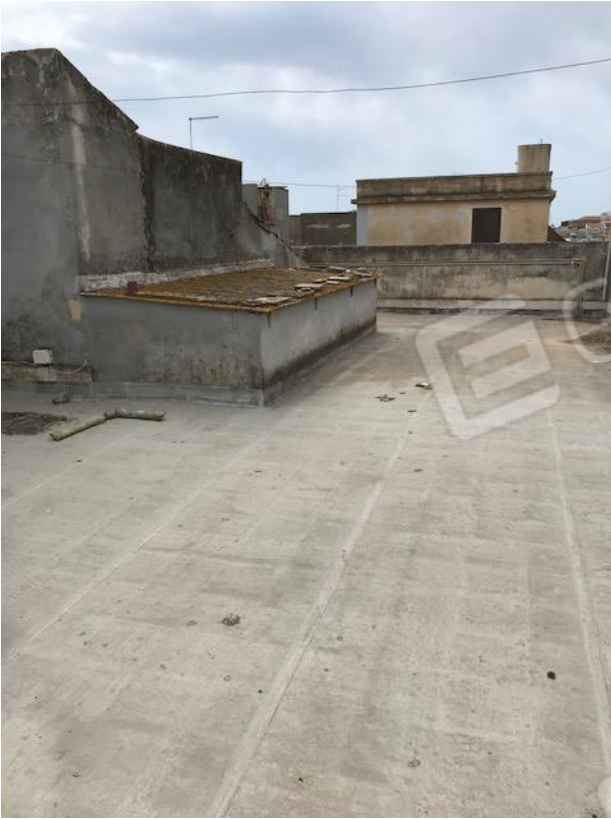
VISTA 4 _ Terrazzo