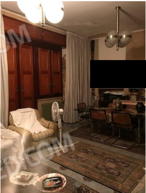
VISTA 10 _ Soggiorno