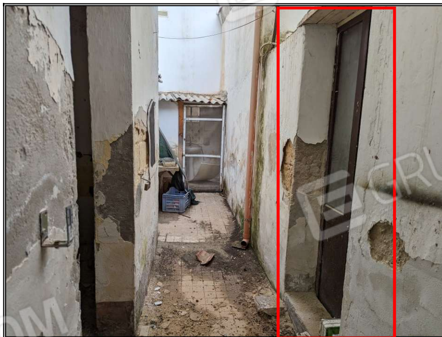
Foto n° 19 – Cortile interno con particolare porta comunicante con proprietà contermine