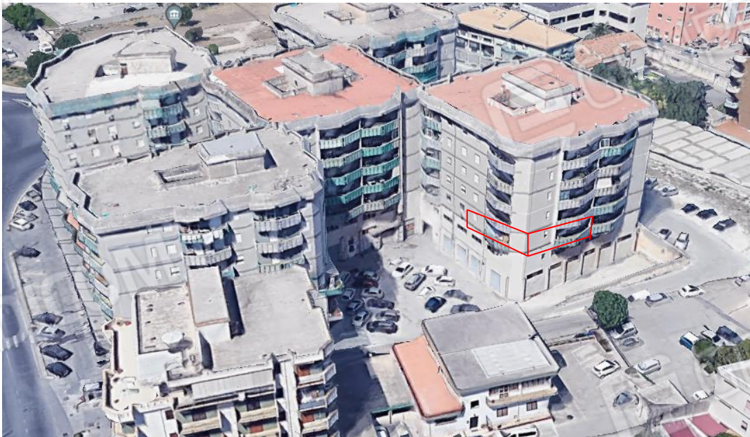
Foto_02 individuazione dell'unità immobiliare al piano primo- pal.E