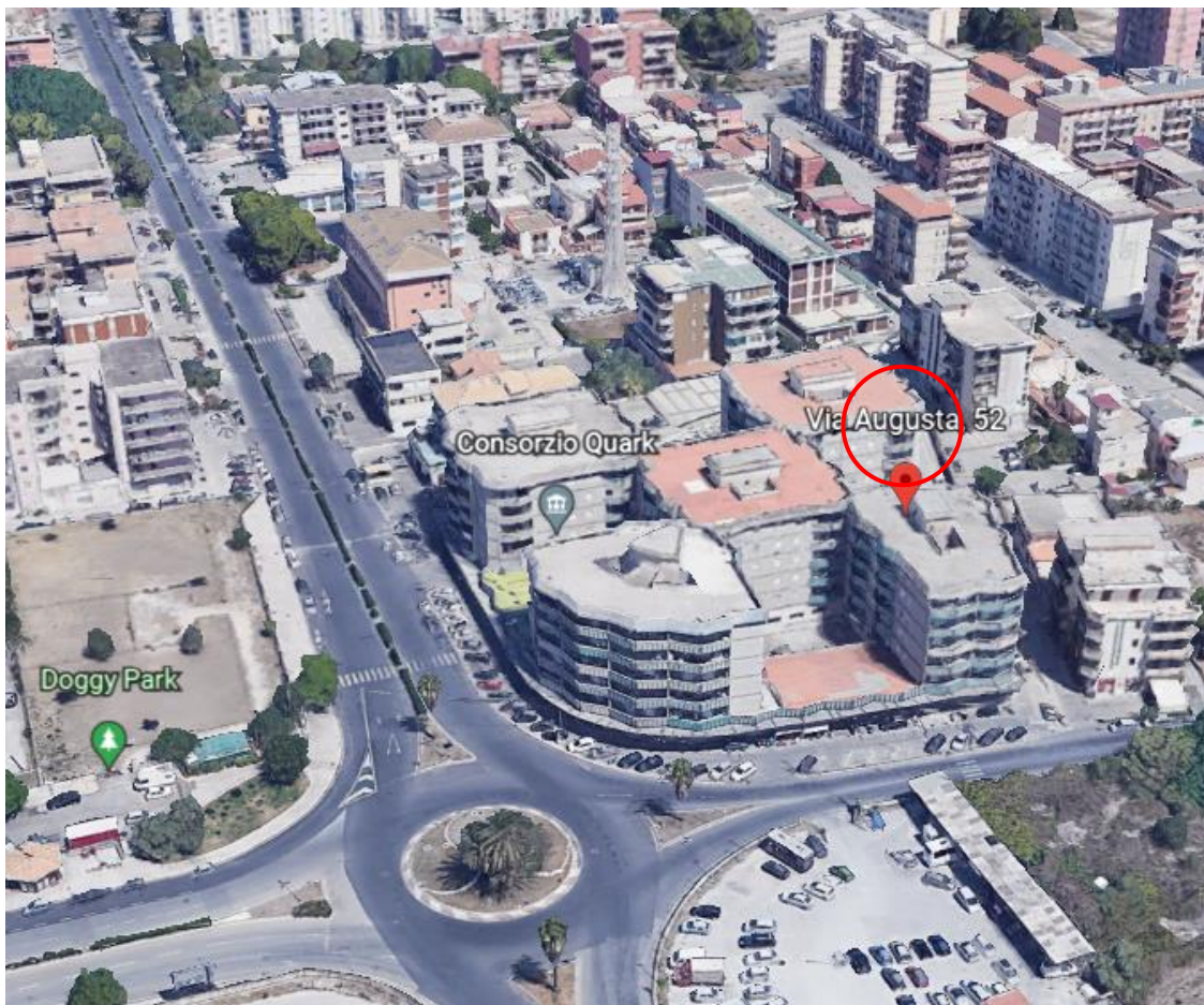
Individuazione dell'edificio in cui si trova l'appartamento pignorato