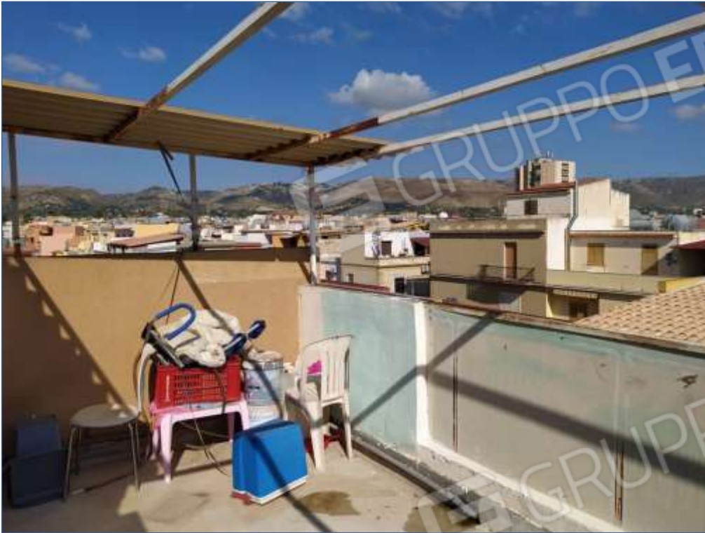
Fot. 9: piano terzo, terrazza esterna