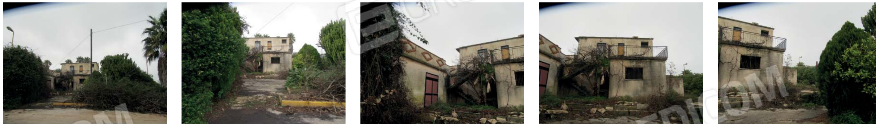
Foto da 1 a 20_ area di accesso al bene