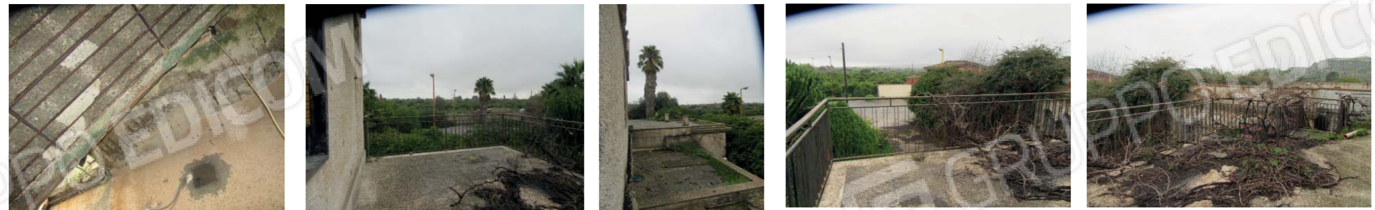
Foto da 43 a 51_ terrazza di accesso e di pertinenza esclusiva del bene