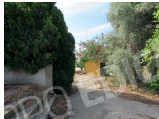
Rilievo fotografico 2 del 06/07/2020

Lotto n. 1 - abitazione a piano primo con terrazzi di pertinenza esclusivi, sito in Florida, Contrada Fegotto, facente parte di un insediamento a prevalente destinazione commerciale, composto da una costruzione comprendente due unità immobiliari, edificata su un lotto di terreno esteso catastalmente 57.95are, con ingressi non autonomi da traversa alla SP 74, denominata Strada Scala di Gemmazza, al punto geografico 37°04'20.0"N 15°07'45.1"E e al punto geografico 37°04'21.4"N 15°07'43.7"E censita nel NCEU del Comune di Florida (SR) al F. 10 P.lla 248 sub 2. L'area di pertinenza scoperta dell'insediamento è censita nel NCT di Florida al F. 10 P.lla 139, qualità seminativo arborato, di 4.924mq.