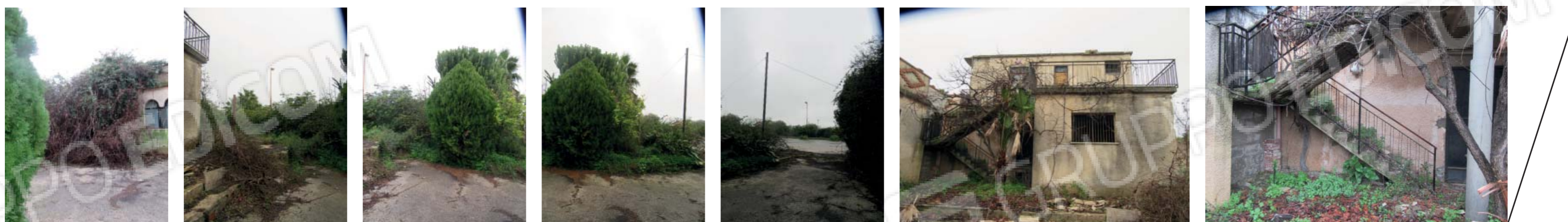
Foto da 21 a 28 - scala di accesso al bene