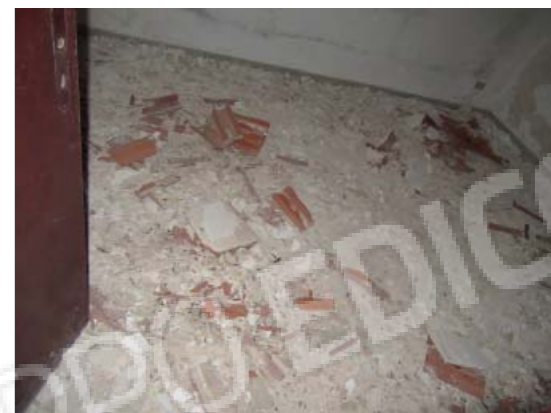
Rilievo fotografico 8 del 06/07/2020

Lotto n. 1 - abitazione a piano primo con terrazzi di pertinenza esclusivi, sito in Florida, Contrada Fegotto, facente parte di un insediamento a prevalente destinazione commerciale, composto da una costruzione comprendente due unità immobiliari, edificata su un lotto di terreno esteso catastalmente 57.95are, con ingressi non autonomi da traversa alla SP 74, denominata Strada Scala di Gemmazza, al punto geografico 37°04'20.0"N 15°07'45.1"E e al punto geografico 37°04'21.4"N 15°07'43.7"E censita nel NCEU del Comune di Florida (SR) al F. 10 P.lla 248 sub 2. L'area di pertinenza scoperta dell'insediamento è censita nel NCT di Florida al F. 10 P.lla 139, qualità seminativo arborato, di 4.924mq.