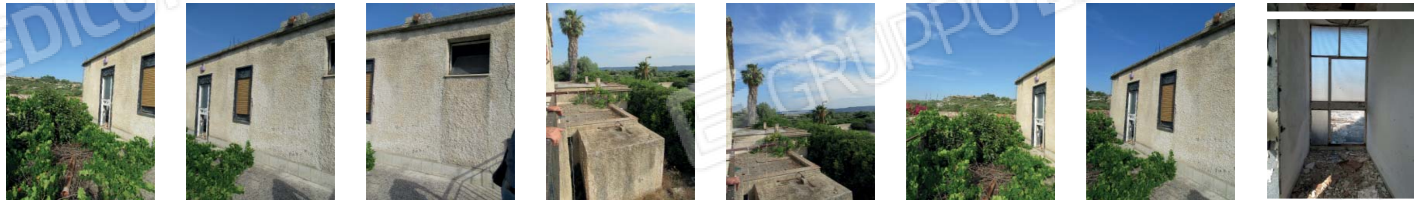
Foto da 127 a 132 - facciata immobile a sud-est