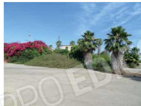
Rilievo fotografico 5 del 06/07/2020

Lotto n. 1 - abitazione a piano primo con terrazzi di pertinenza esclusivi, sito in Floridaia, Contrada Fegotto, facente parte di un insediamento a prevalente destinazione commerciale, composto da una costruzione comprendente due unità immobiliari, edificata su un lotto di terreno esteso catastalmente 57.95are, con ingressi non autonomi da traversa alla SP 74, denominata Strada Scala di Gemmazza, al punto geografico 37°04'20.0"N 15°07'45.1"E e al punto geografico 37°04'21.4"N 15°07'43.7"E censita nel NCEU del Comune di Floridaia (SR) al F. 10 P.lla 248 sub 2. L'area di pertinenza scoperta dell'insediamento è censita nel NCT di Floridaia al F. 10 P.lla 139, qualità seminativo arborato, di 4.924mq.