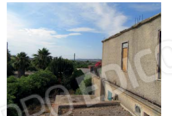
Rilievo fotografico 9 del 06/07/2020

Lotto n. 1 - abitazione a piano primo con terrazzi di pertinenza esclusivi, sito in Florida, Contrada Fegotto, facente parte di un insediamento a prevalente destinazione commerciale, composto da una costruzione comprendente due unità immobiliari, edificata su un lotto di terreno esteso catastalmente 57.95are, con ingressi non autonomi da traversa alla SP 74, denominata Strada Scala di Gemmazza, al punto geografico 37°04'20.0"N 15°07'45.1"E e al punto geografico 37°04'21.4"N 15°07'43.7"E censita nel NCEU del Comune di Florida (SR) al F. 10 P.lla 248 sub 2. L'area di pertinenza scoperta dell'insediamento è censita nel NCT di Florida al F. 10 P.lla 139, qualità seminativo arborato, di 4.924mq.