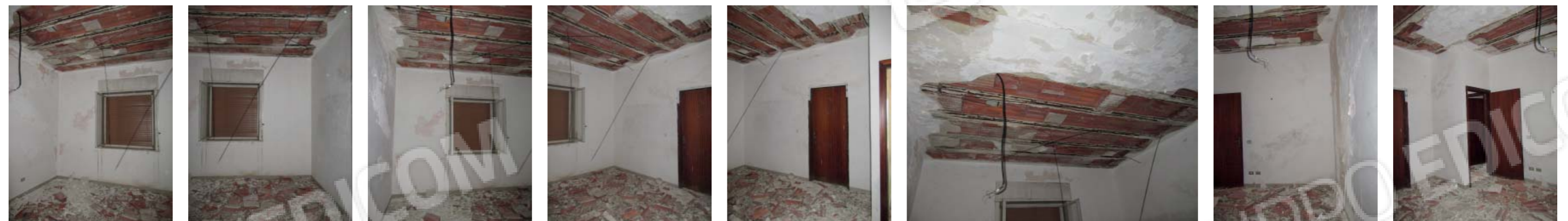
Foto da 141 a 148 , vano A7