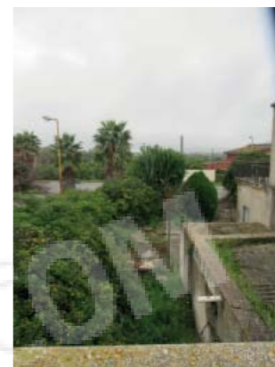
Foto da 76 a 88_ terrazza di pertinenza esclusiva del bene