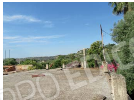
Rilievo fotografico 10 del 06/07/2020

Lotto n. 1 - abitazione a piano primo con terrazzi di pertinenza esclusivi, sito in Florida, Contrada Fegotto, facente parte di un insediamento a prevalente destinazione commerciale, composto da una costruzione comprendente due unità immobiliari, edificata su un lotto di terreno esteso catastalmente 57.95are, con ingressi non autonomi da traversa alla SP 74, denominata Strada Scala di Gemmazza, al punto geografico 37°04'20.0"N 15°07'45.1"E e al punto geografico 37°04'21.4"N 15°07'43.7"E censita nel NCEU del Comune di Florida (SR) al F. 10 P.lla 248 sub 2. L'area di pertinenza scoperta dell'insediamento è censita nel NCT di Florida al F. 10 P.lla 139, qualità seminativo arborato, di 4.924mq.