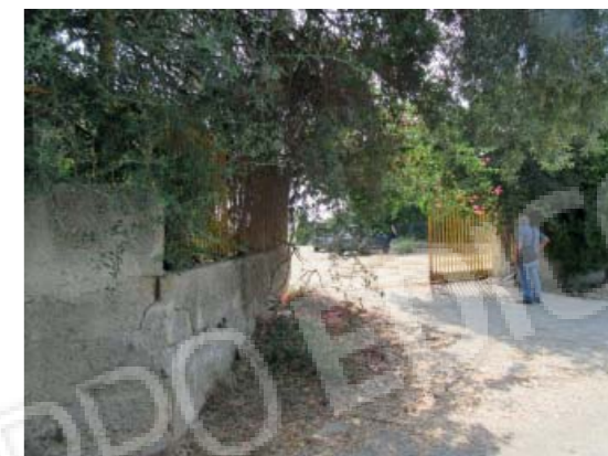
Rilievo fotografico 1 del 06/07/2020

Lotto n. 1 - abitazione a piano primo con terrazzi di pertinenza esclusivi, sito in Floridaia, Contrada Fegotto, facente parte di un insediamento a prevalente destinazione commerciale, composto da una costruzione comprendente due unità immobiliari, edificata su un lotto di terreno esteso catastalmente 57.95are, con ingressi non autonomi da traversa alla SP 74, denominata Strada Scala di Gemmazza, al punto geografico 37°04'20.0"N 15°07'45.1"E e al punto geografico 37°04'21.4"N 15°07'43.7"E censita nel NCEU del Comune di Floridaia (SR) al F. 10 P.lla 248 sub 2. L'area di pertinenza scoperta dell'insediamento è censita nel NCT di Floridaia al F. 10 P.lla 139, qualità seminativo arborato, di 4.924mq.