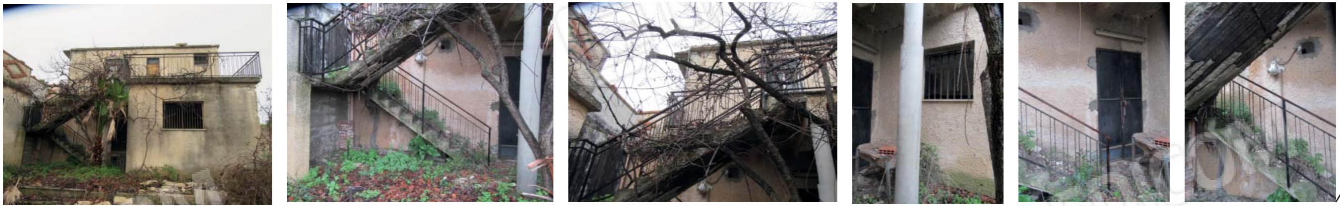
Foto da 29 a 42_ area e scala di accesso al bene