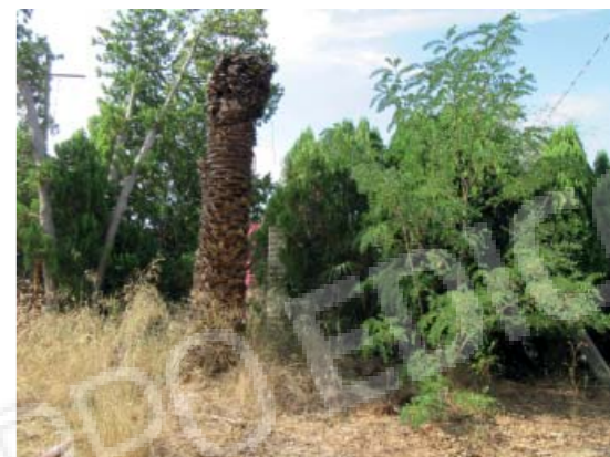
Rilievo fotografico 3 del 06/07/2020

Lotto n. 1 - abitazione a piano primo con terrazzi di pertinenza esclusivi, sito in Floridaia, Contrada Fegotto, facente parte di un insediamento a prevalente destinazione commerciale, composto da una costruzione comprendente due unità immobiliari, edificata su un lotto di terreno esteso catastalmente 57.95are, con ingressi non autonomi da traversa alla SP 74, denominata Strada Scala di Gemmazza, al punto geografico 37°04'20.0"N 15°07'45.1"E e al punto geografico 37°04'21.4"N 15°07'43.7"E censita nel NCEU del Comune di Floridaia (SR) al F. 10 P.lla 248 sub 2. L'area di pertinenza scoperta dell'insediamento è censita nel NCT di Floridaia al F. 10 P.lla 139, qualità seminativo arborato, di 4.924mq.