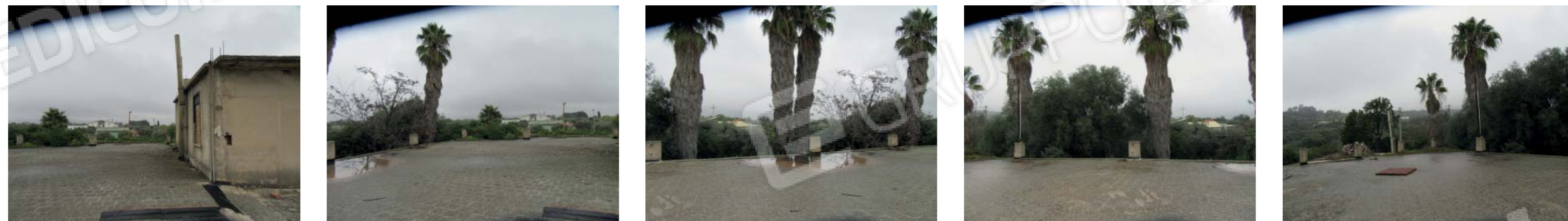
Foto da 61 a 75_ terrazza di pertinenza esclusiva del bene