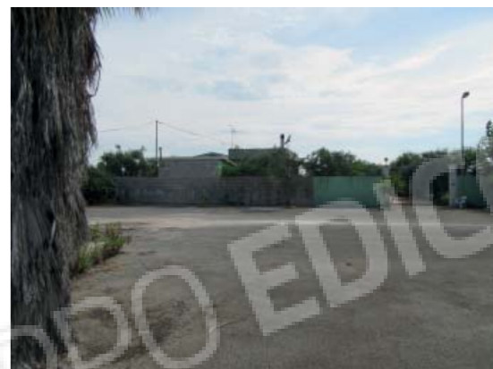
Rilievo fotografico 4 del 06/07/2020

Lotto n. 1 - abitazione a piano primo con terrazzi di pertinenza esclusivi, sito in Florida, Contrada Fegotto, facente parte di un insediamento a prevalente destinazione commerciale, composto da una costruzione comprendente due unità immobiliari, edificata su un lotto di terreno esteso catastalmente 57.95are, con ingressi non autonomi da traversa alla SP 74, denominata Strada Scala di Gemmazza, al punto geografico 37°04'20.0"N 15°07'45.1"E e al punto geografico 37°04'21.4"N 15°07'43.7"E censita nel NCEU del Comune di Florida (SR) al F. 10 P.lla 248 sub 2. L'area di pertinenza scoperta dell'insediamento è censita nel NCT di Florida al F. 10 P.lla 139, qualità seminativo arborato, di 4.924mq.