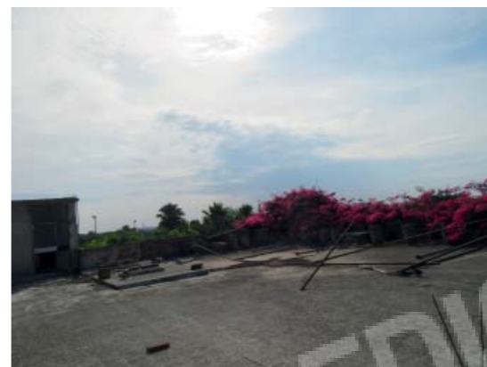
Foto da 217 a 220, terrazzo