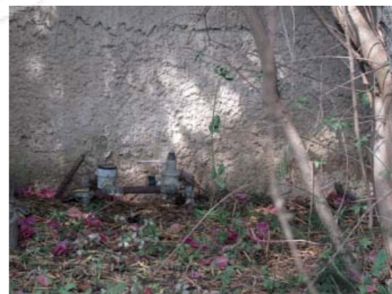
Foto da 115 a 118 - allaccio rete idrica