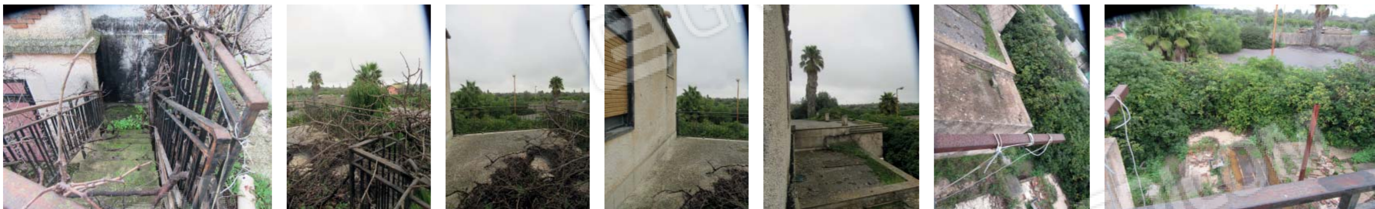
Foto da 54 a 60_ terrazza di accesso e di pertinenza esclusiva del bene