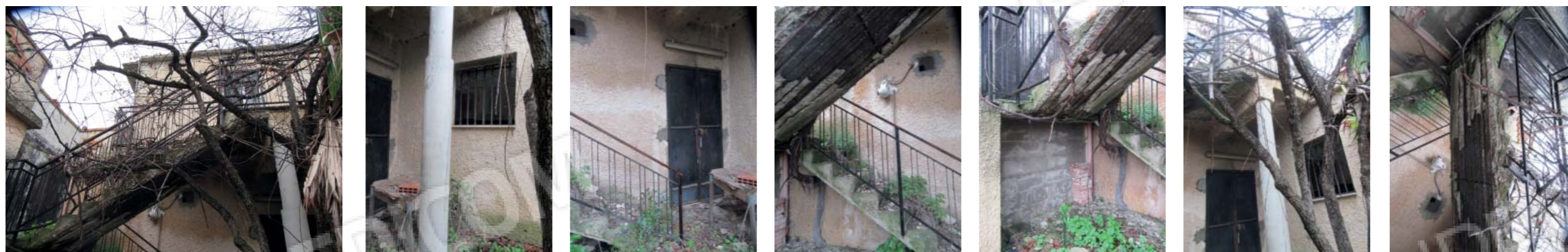
Rilievo fotografico 1 del 09/01/2021

Lotto n. 1 - abitazione a piano primo con terrazzi di pertinenza esclusivi, sito in Floridaia, Contrada Fegotto, facente parte di un insediamento a prevalente destinazione commerciale, composto da una costruzione comprendente due unità immobiliari, edificata su un lotto di terreno esteso catastalmente 57.95are, con ingressi non autonomi da traversa alla SP 74, denominata Strada Scala di Gemmazza, al punto geografico 37°04'20.0"N 15°07'45.1"E e al punto geografico 37°04'21.4"N 15°07'43.7"E censita nel NCEU del Comune di Floridaia (SR) al F. 10 P.lla 248 sub 2. L'area di pertinenza scoperta dell'insediamento è censita nel NCT di Floridaia al F. 10 P.lla 139, qualità seminativo arborato, di 4.924mq.