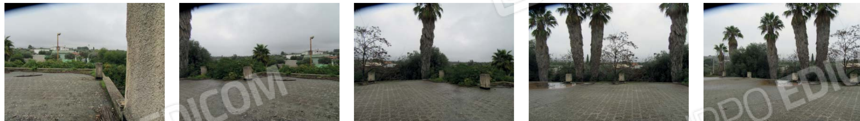
Rilievo fotografico 3 del 09/01/2021

Lotto n. 1 - abitazione a piano primo con terrazzi di pertinenza esclusivi, sito in Florida, Contrada Fegotto, facente parte di un insediamento a prevalente destinazione commerciale, composto da una costruzione comprendente due unità immobiliari, edificata su un lotto di terreno esteso catastalmente 57.95are, con ingressi non autonomi da traversa alla SP 74, denominata Strada Scala di Gemmazza, al punto geografico 37°04'20.0"N 15°07'45.1"E e al punto geografico 37°04'21.4"N 15°07'43.7"E censita nel NCEU del Comune di Florida (SR) al F. 10 P.lla 248 sub 2. L'area di pertinenza scoperta dell'insediamento è censita nel NCT di Florida al F. 10 P.lla 139, qualità seminativo arborato, di 4.924mq.