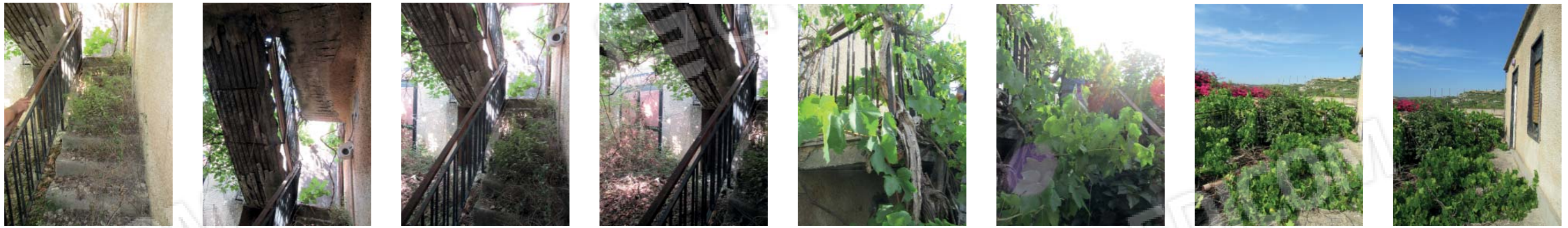
Foto da 119 a 126- rampe di accesso al bene in oggetto