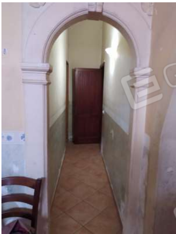
Fot. 3: corridoio-disimpegno, piano terra