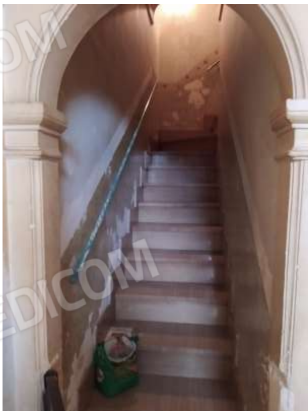
Fot. 6: vano scala che conduce al piano primo