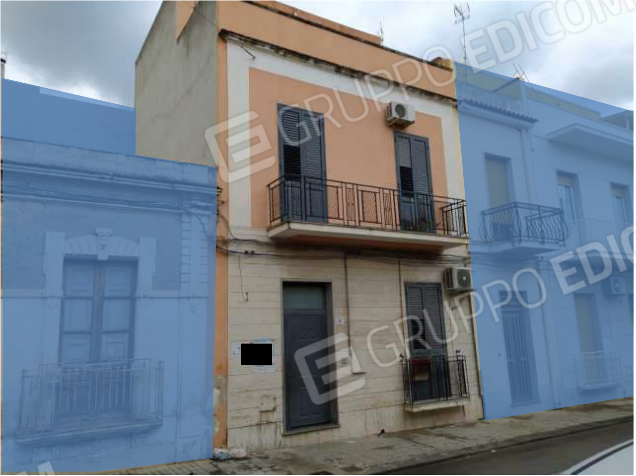
Fot. 17: prospetto su Via G. Mameli, particolare