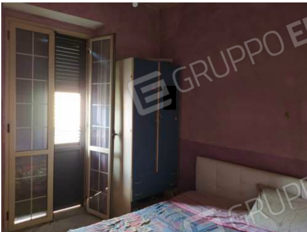
Fot. 9: camera matrimoniale, piano primo