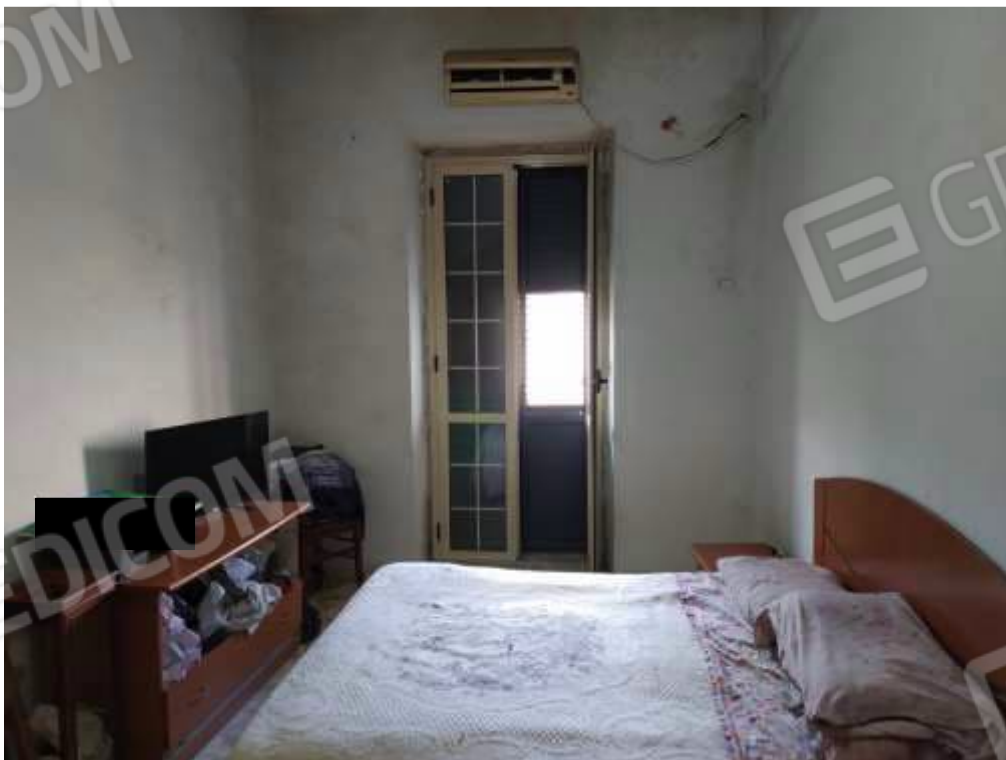
Fot. 8: camera matrimoniale, piano primo