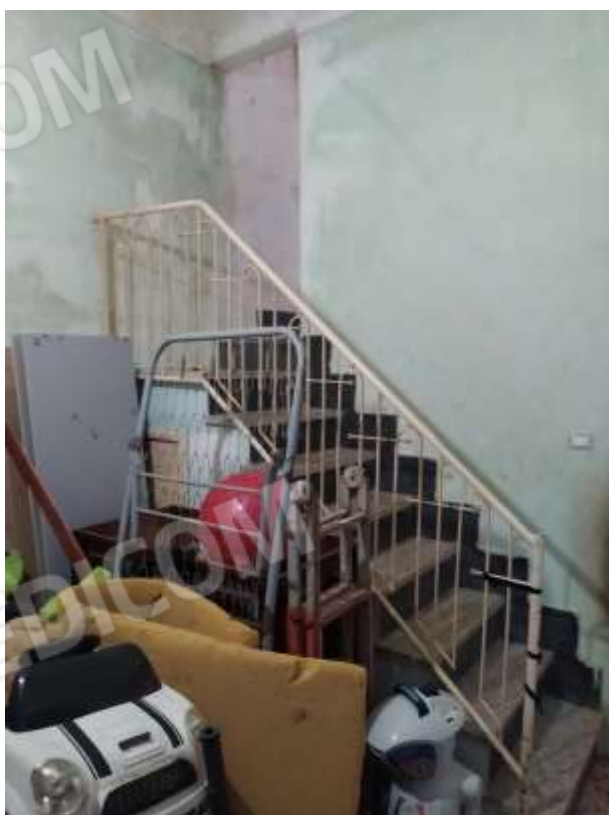
Fot. 10: rampa di scale che conduce al piano secondo