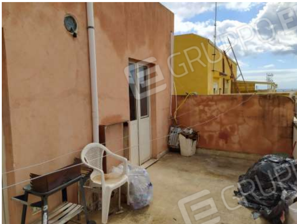
Fot. 13: terrazza esterna, piano secondo