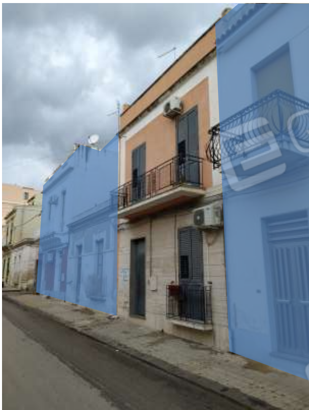
Fot. 15: prospetto su Via G. Mameli