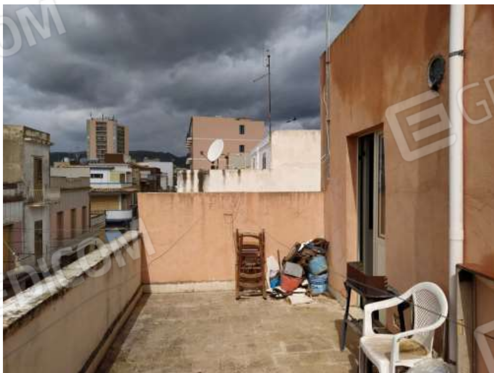
Fot. 14: terrazza esterna, piano secondo