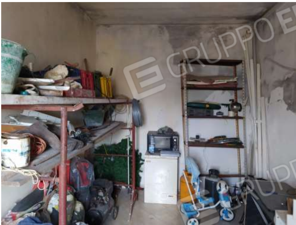
Fot. 11: vano, piano secondo