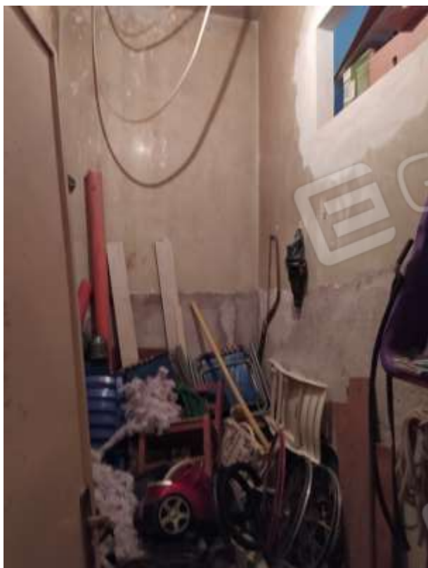
Fot. 7: vano-ripostiglio, piano primo