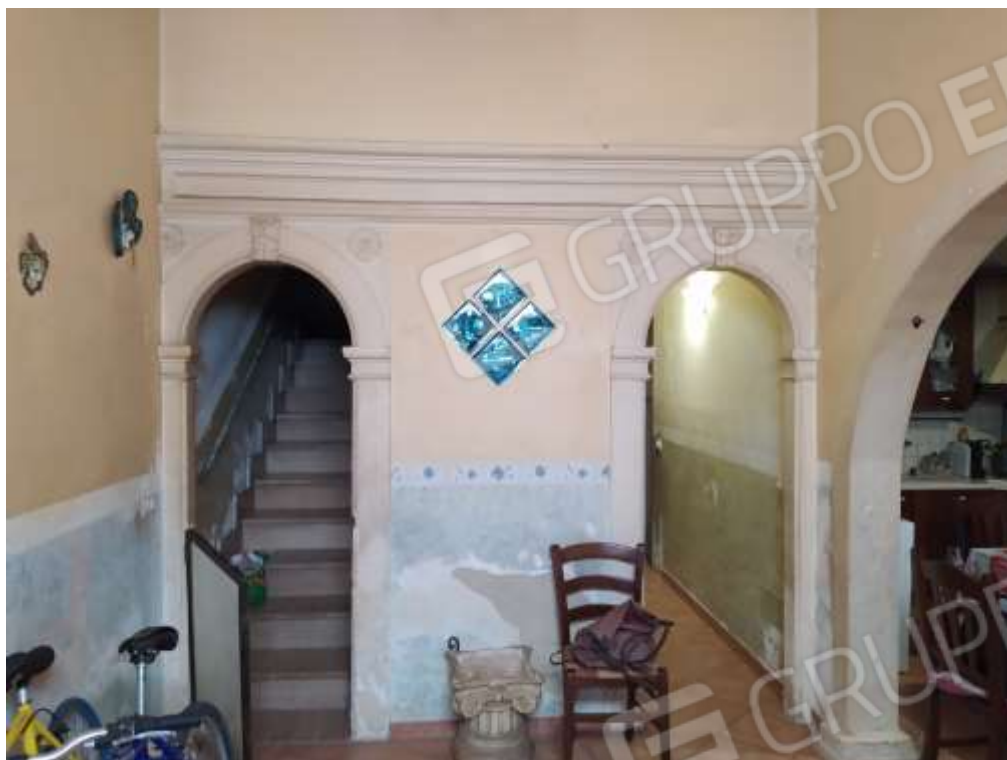
Fot. 1: ingresso, piano terra