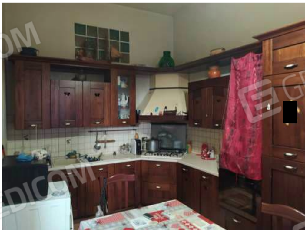
Fot. 2: cucina, piano terra