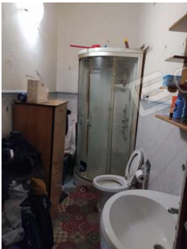
Fot. 5: bagno, piano terra