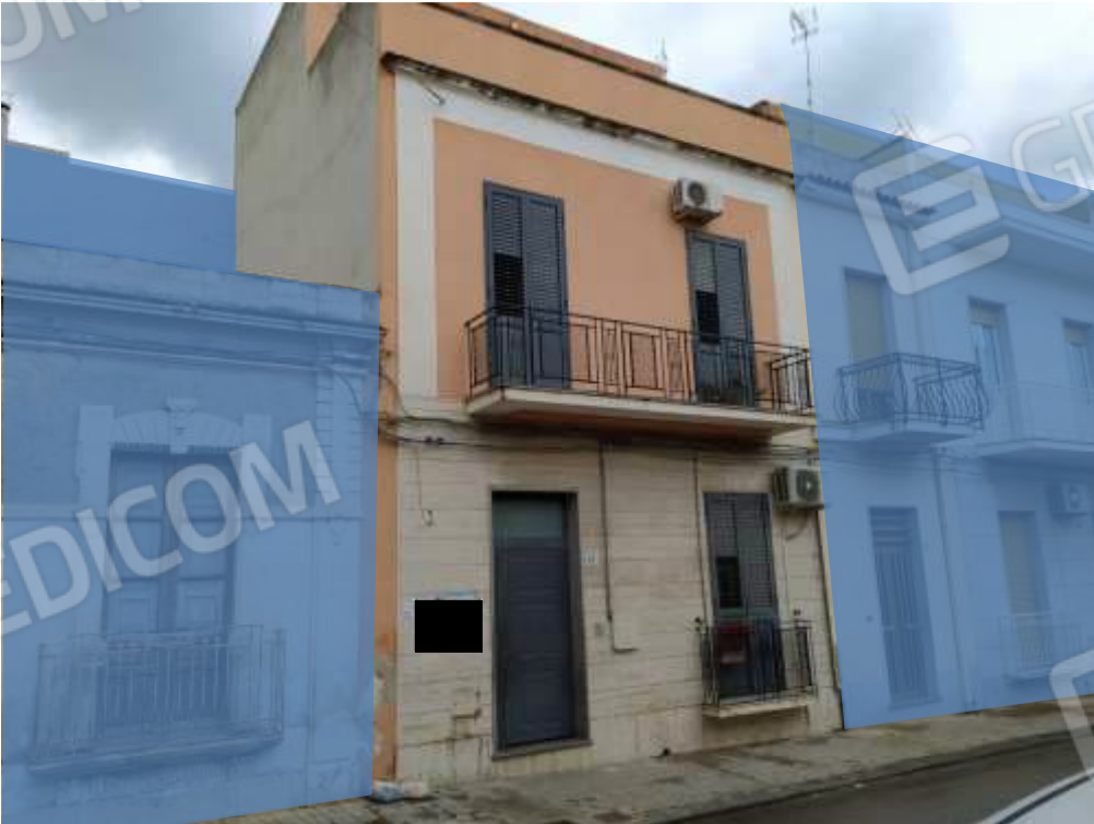
Fot. 18: prospetto su Via G. Mameli