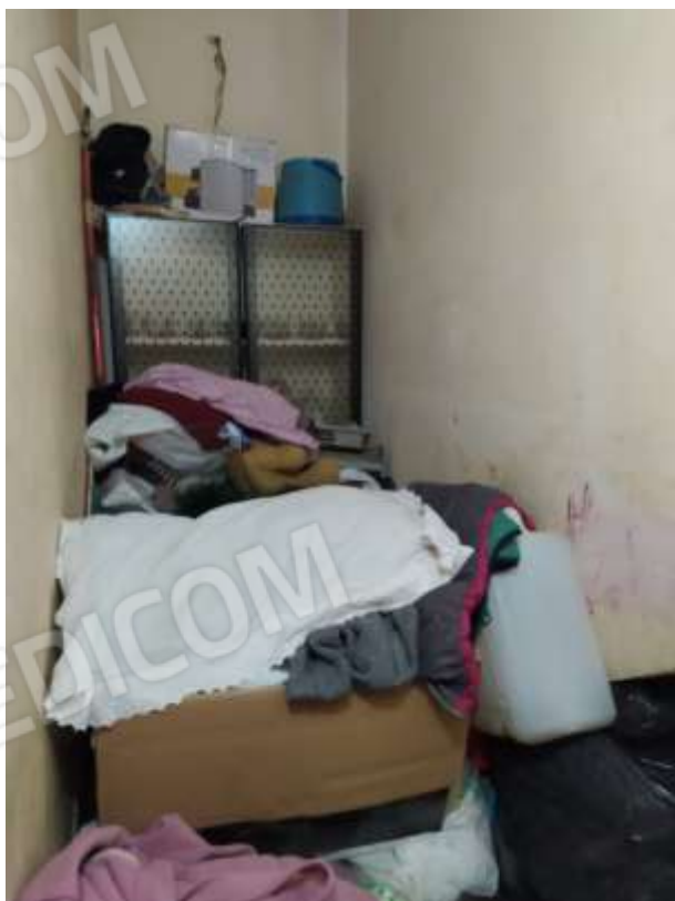
Fot. 4: ripostiglio, piano terra