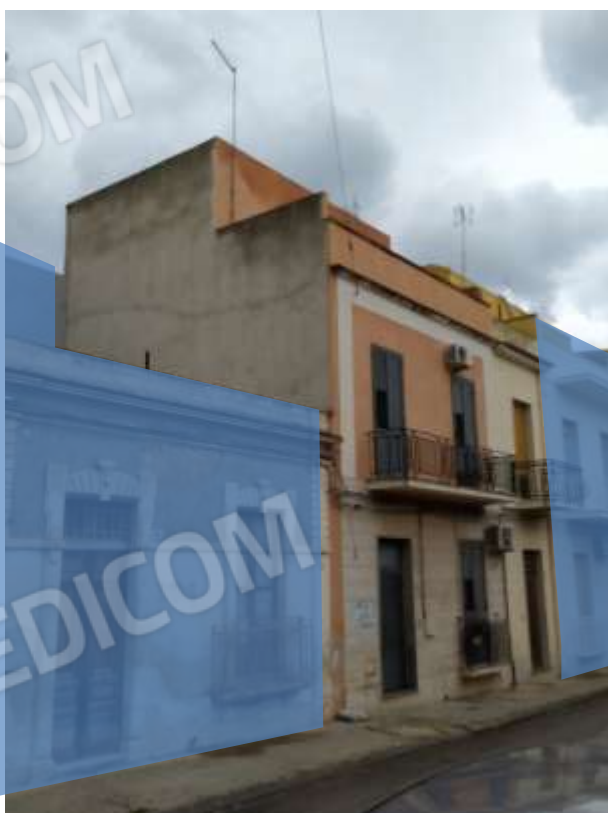
Fot. 16: prospetto su Via G. Mameli