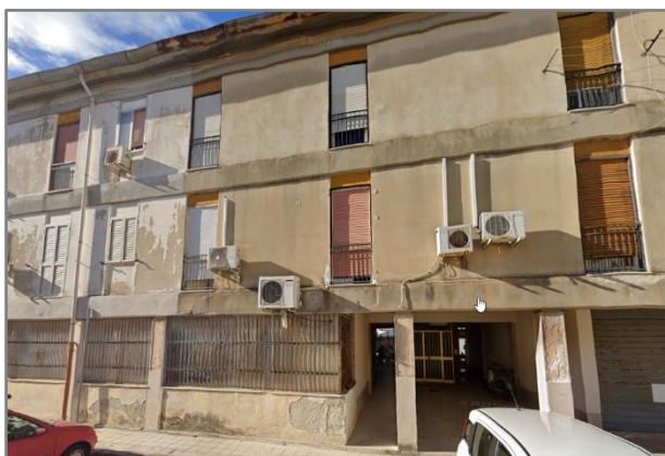
Foto dell'edificio dove si trova l'immobile

Il bene oggetto di stima, geograficamente risulta individuato con coordinate di latitudine 37.09694 e di longitudine 15.27485. ( allegato 3- planimetria catastale )