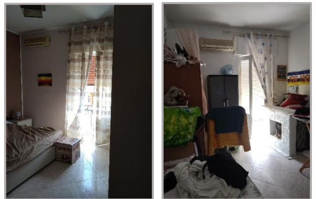
Foto delle due camere da letto