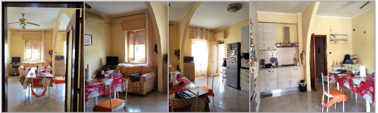
Foto della cucina