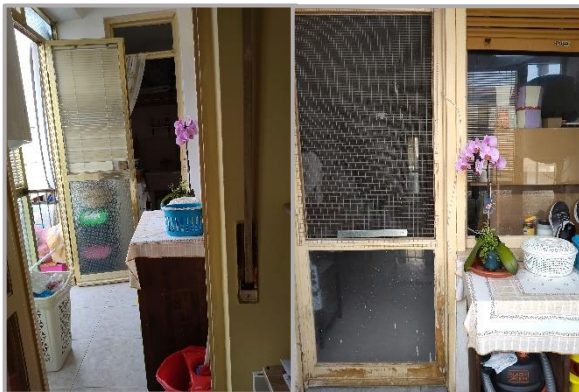
Foto del balcone