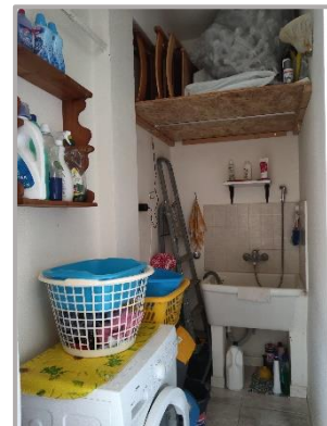
Foto della lavanderia