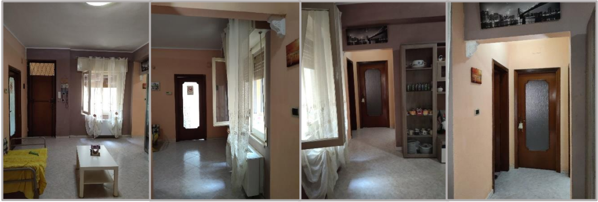
Foto dell'ingresso- salone e disimpegno