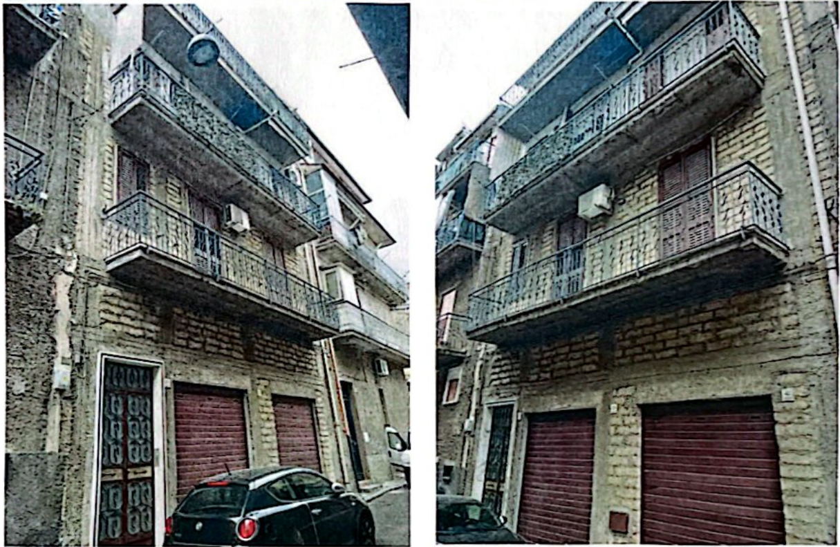
Foto 1: Vista della palazzina su quattro elevazioni sita nella Via G. Carducci n.37-39-41