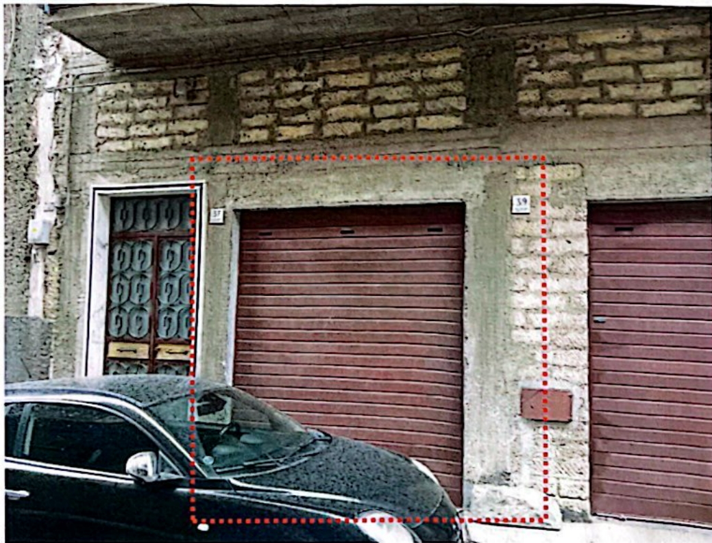
Foto 2: Individuazione dell'autorimessa sita al civico n. 39 della G. Carducci (Lotto 2 di vendita)