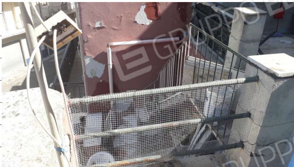
Foto n.23: immagine esterna della scala in metallo di collegamento tra i piani secondo e terzo dell'immobile sito in via Sassari n.17 a Lentini.