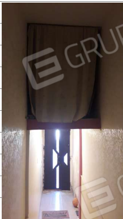
Foto n.7: immagine interna dell'ingresso al piano terra all'immobile sito in via Sassari n.17 a Lentini.