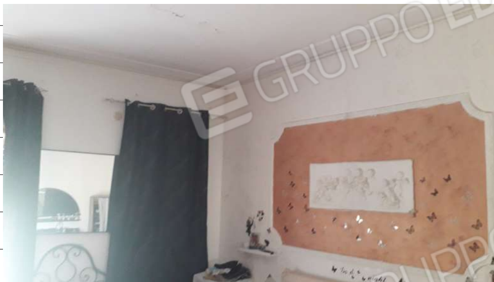
Foto n.11: immagine interna della camera da letto ubicata al piano primo dell'immobile sito in via Sassari n.17 a Lentini.