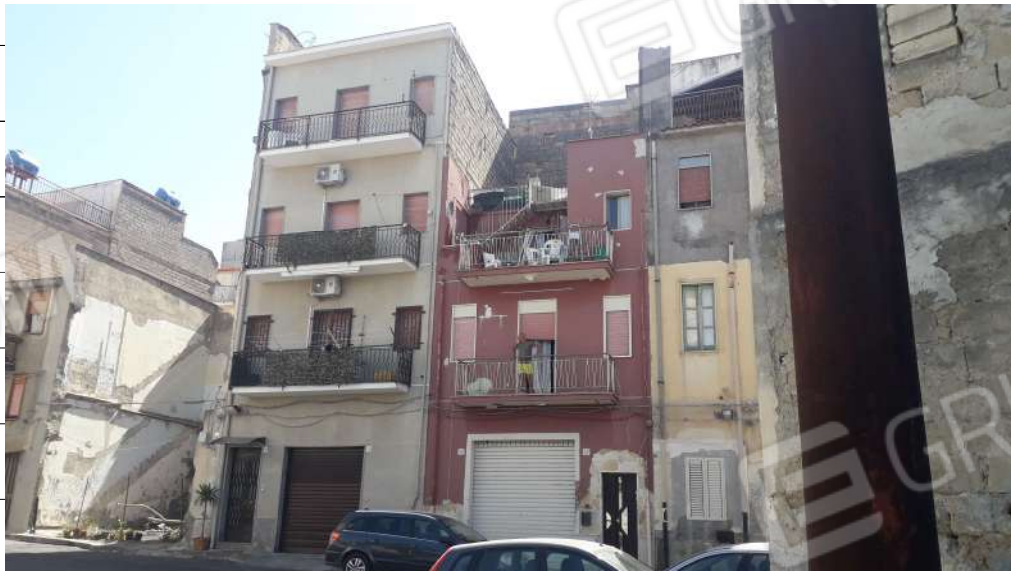
Foto n.2: immagine esterna dell'edificio sito in via Sassari nn.15 e 17 a Lentini.