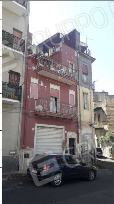
Foto n.1: immagine esterna dell'edificio sito in via Sassari nn.15 e 17 a Lentini.