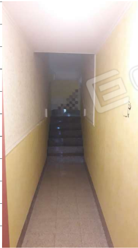
Foto n.6: immagine del vano scala al piano terra interno all'immobile sito in via Sassari n.17 a Lentini.