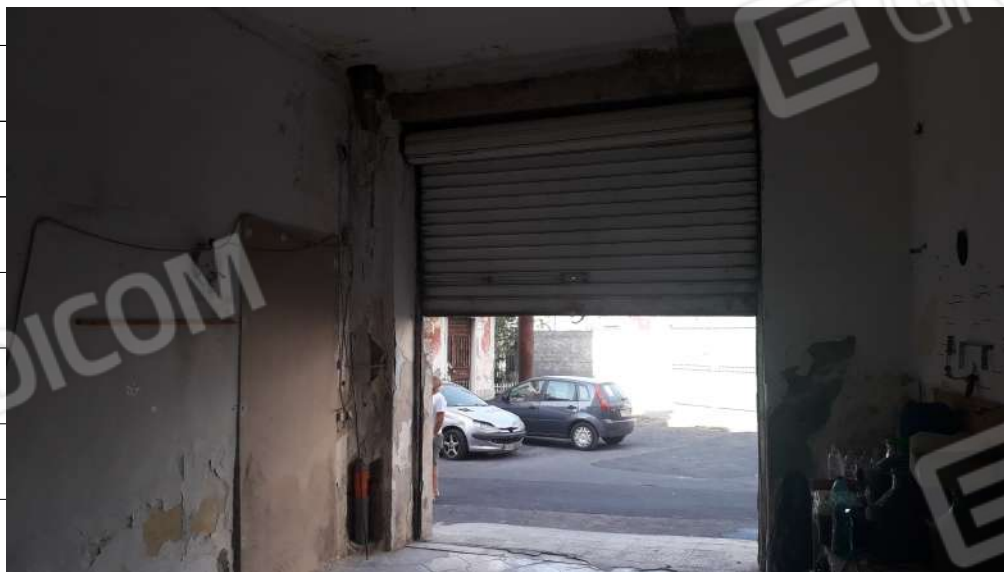
Foto n.4: immagine interna dell'ingresso al garage sito in via Sassari n.15 a Lentini.