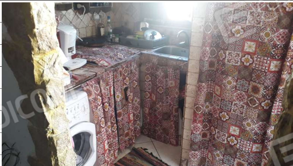
Foto n.20: immagine interna della cucina ubicata al piano secondo dell'immobile sito in via Sassari n.17 a Lentini.