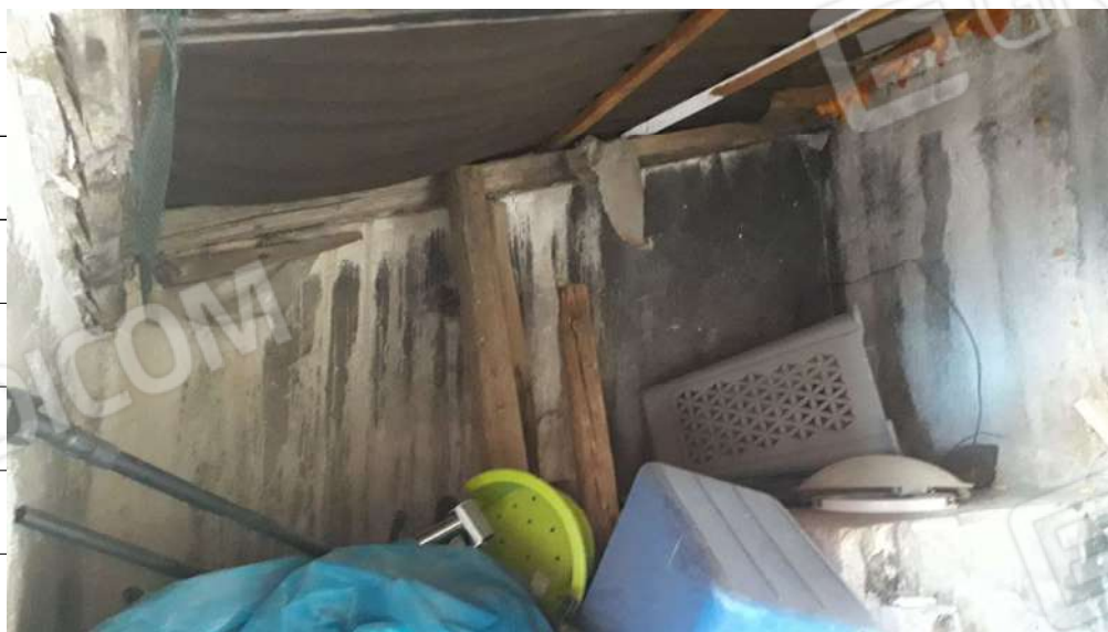
Foto n.28: interna del ripostiglio ubicato al primo terzo dell'immobile sito in via Sassari n.17 a Lentini.