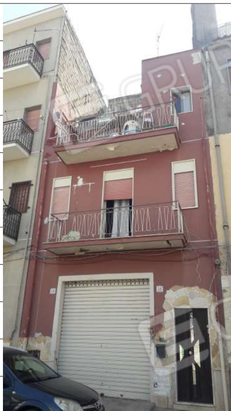
Foto n.3: immagine esterna dell'edificio sito in via Sassari nn.15 e 17 a Lentini.