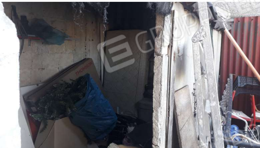
Foto n.27: immagine interna del ripostiglio ubicato al primo terzo dell'immobile sito in via Sassari n.17 a Lentini.