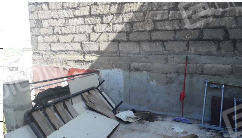
Foto n.24: immagine della terrazza ubicata al piano terzo dell'immobile sito in via Sassari n.17 a Lentini.