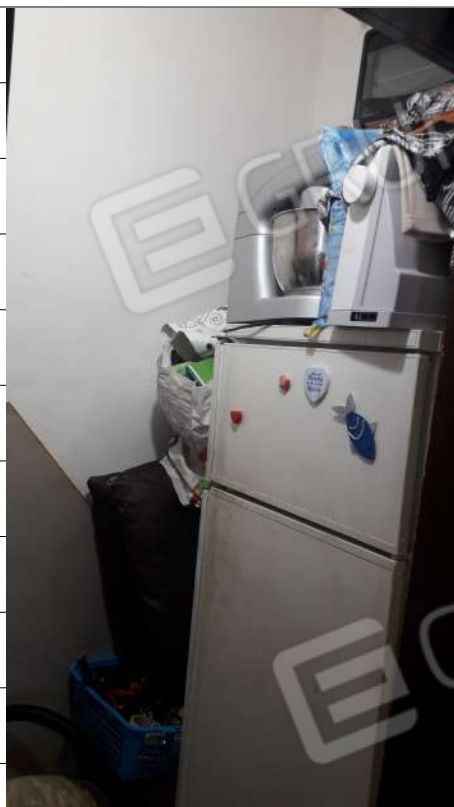
Foto n.19: immagine interna del ripostiglio ubicato al piano secondo dell'immobile sito in via Sassari n.17 a Lentini.