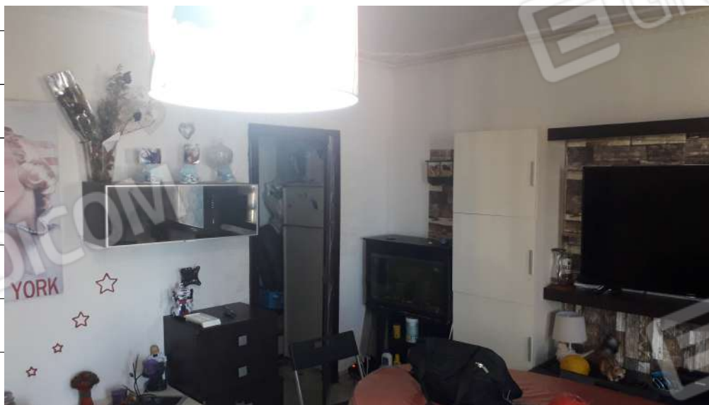
Foto n.16: immagine interna del soggiorno ubicato al piano secondo dell'immobile sito in via Sassari n.17 a Lentini.