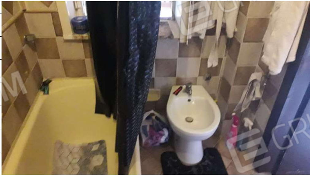
Foto n.14: immagine interna del wc ubicato al piano primo dell'immobile sito in via Sassari n.17 a Lentini.