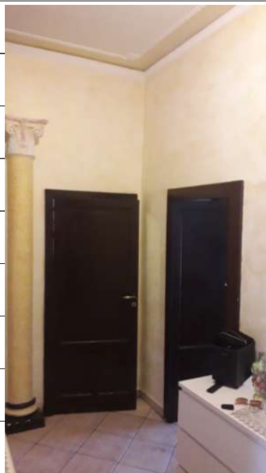
Foto n.8: immagine interna del disimpegno ubicato al piano primo dell'immobile sito in via Sassari n.17 a Lentini.