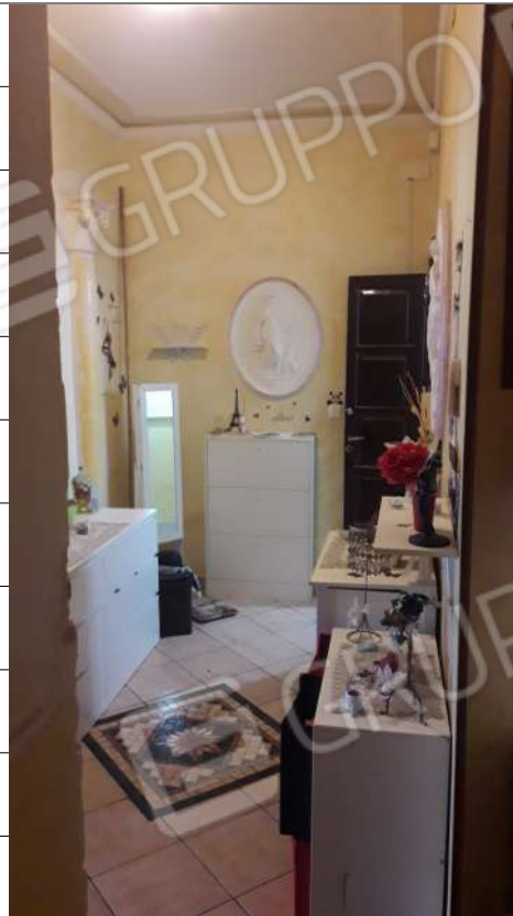
Foto n.9: immagine interna del disimpegno ubicato al piano primo dell'immobile sito in via Sassari n.17 a Lentini.