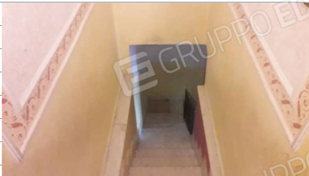
Foto n.15: immagine interna del vano scala di collegamento tra i piani primo e secondo dell'immobile sito in via Sassari n.17 a Lentini.