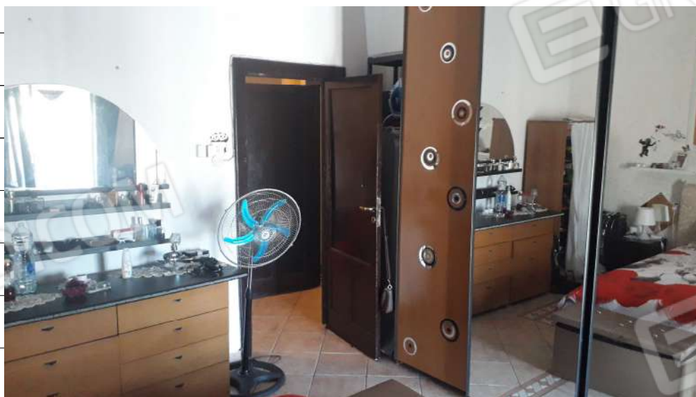
Foto n.12: immagine interna della camera da letto ubicata al piano primo dell'immobile sito in via Sassari n.17 a Lentini.