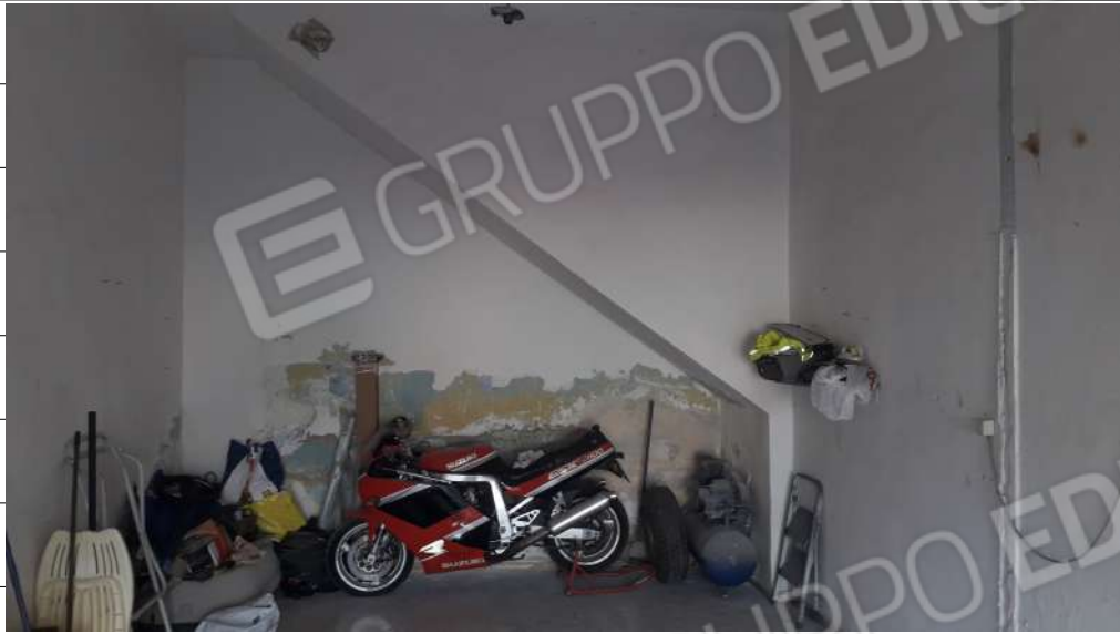
Foto n.5: immagine interna del garage sito in via Sassari n.15 a Lentini.