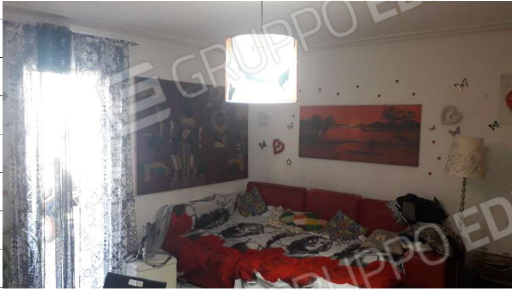
Foto n.17: immagine interna del soggiorno ubicato al piano secondo dell'immobile sito in via Sassari n.17 a Lentini.