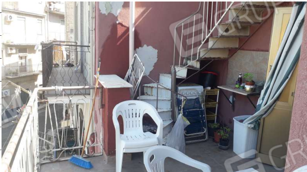
Foto n.22: immagine esterna della scala in metallo ubicata sulla veranda del secondo piano dell'immobile sito in via Sassari n.17 a Lentini.