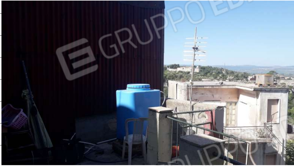
Foto n.25: immagine della terrazza ubicata al piano terzo dell'immobile sito in via Sassari n.17 a Lentini.