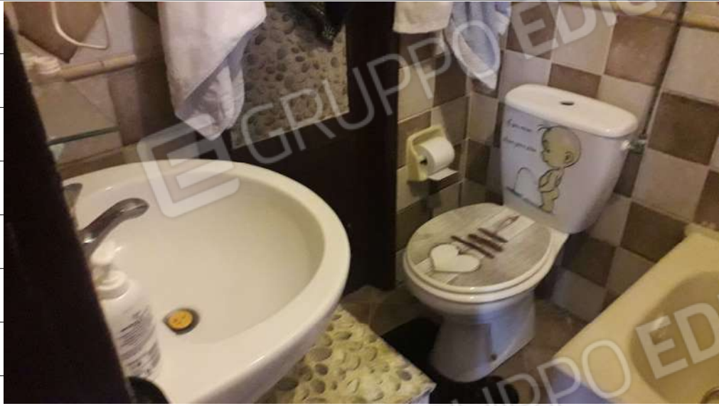
Foto n.13: immagine interna del wc ubicato al piano primo dell'immobile sito in via Sassari n.17 a Lentini.