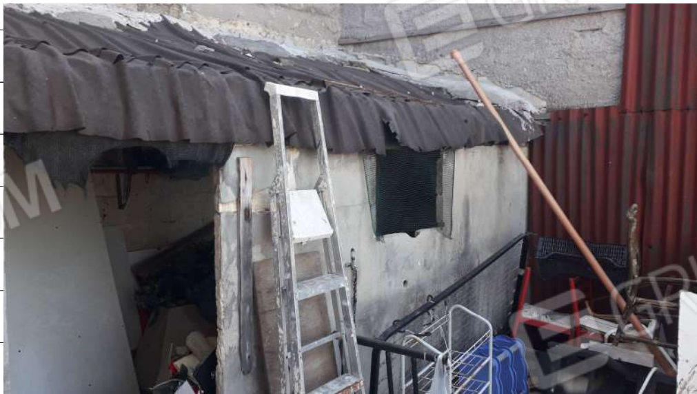
Foto n.26: immagine esterna del ripostiglio ubicato al primo terzo dell'immobile sito in via Sassari n.17 a Lentini.