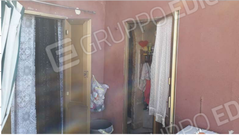
Foto n.21: immagine esterna della veranda ubicata al piano secondo dell'immobile sito in via Sassari n.17 a Lentini.