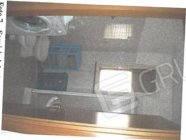
Foto 7 - Servizio igienico