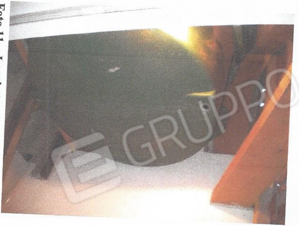
Foto 11 - Locale tecnico