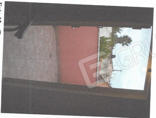
Foto 12 - Terrazza_1