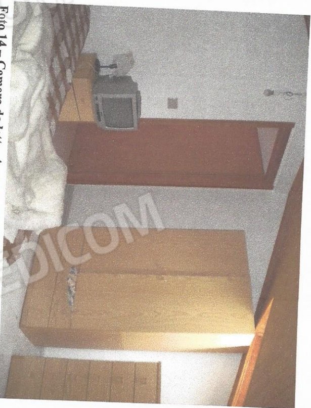
Foto 14 - Camera da letto_4