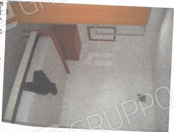
Foto 6 - Camera da letto_2