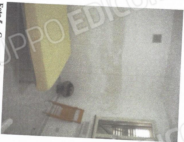
Foto 5 - Camera da letto_1