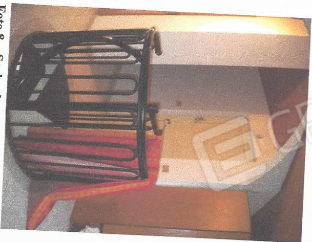
Foto 8 - Scala al sottotetto