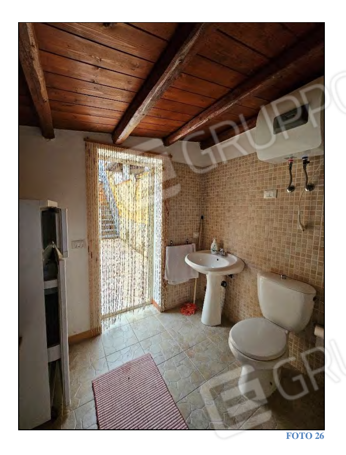
Allegato 2 - Documentazione fotografica