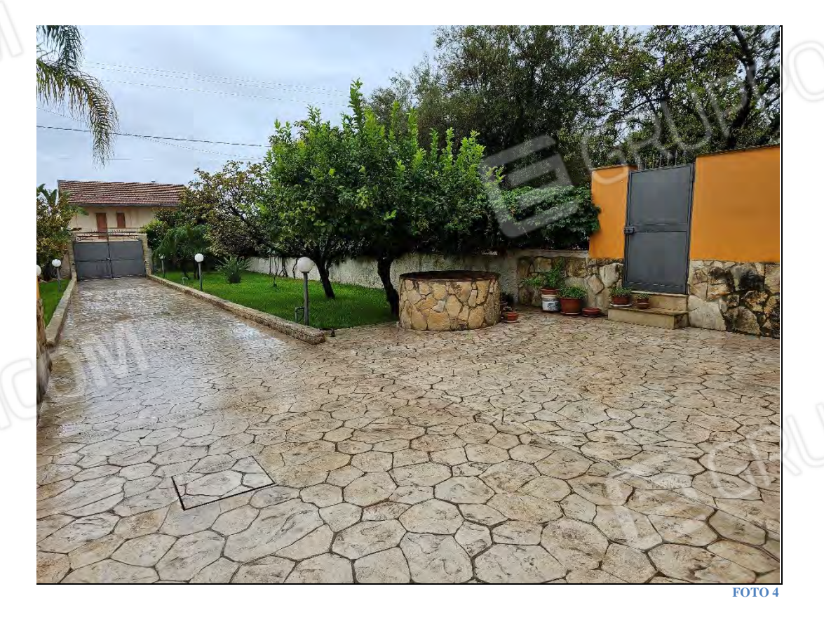
Allegato 2 - Documentazione fotografica