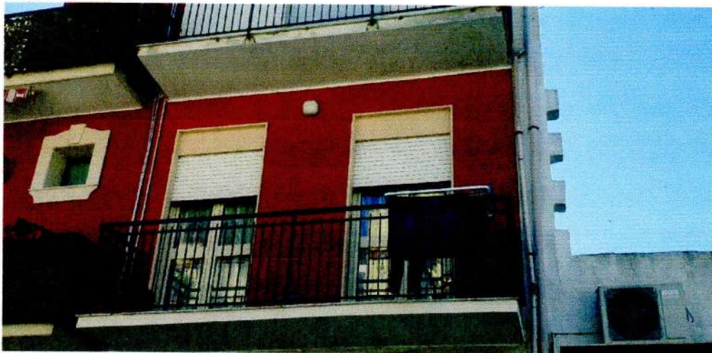
P. 1° - VIA A. MANZONI N. 62