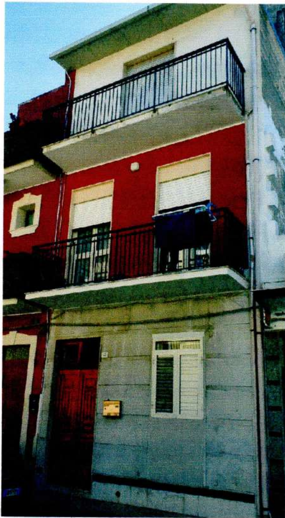
PROSPETTO PRINCIPALE- VIA A. MANZONI N. 62