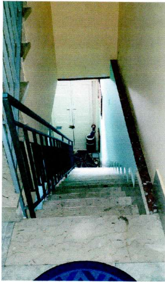
CORPO SCALA – DAL PORTONCINO DI INGRESSO AL PIANO 1°