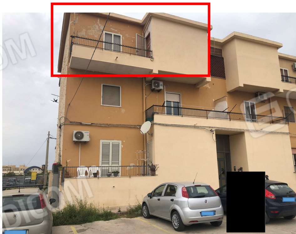
Foto 2: Vista della palazzina di cui fa parte l'appartamento pignorato. Il riquadro in rosso la porzione di appartamento esposta ad EST oggetto di pignoramento.