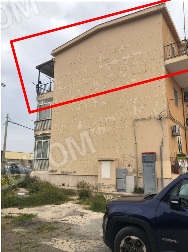
Foto 4: Vista prospetto Sud della palazzina. Il riquadro in rosso la porzione di appartamento oggetto di pignoramento.