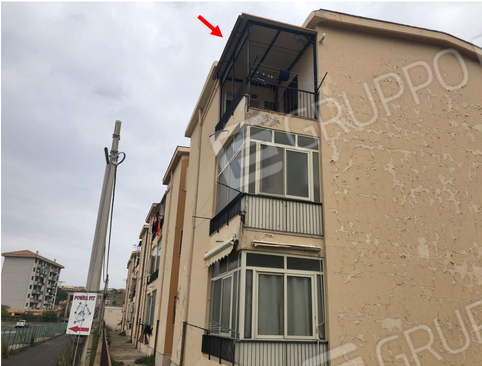
Foto 5: Vista prospetto Sud-Ovest della palazzina, la freccia indica la copertura del terrazzino realizzata in assenza di provvedimenti autorizzativi.