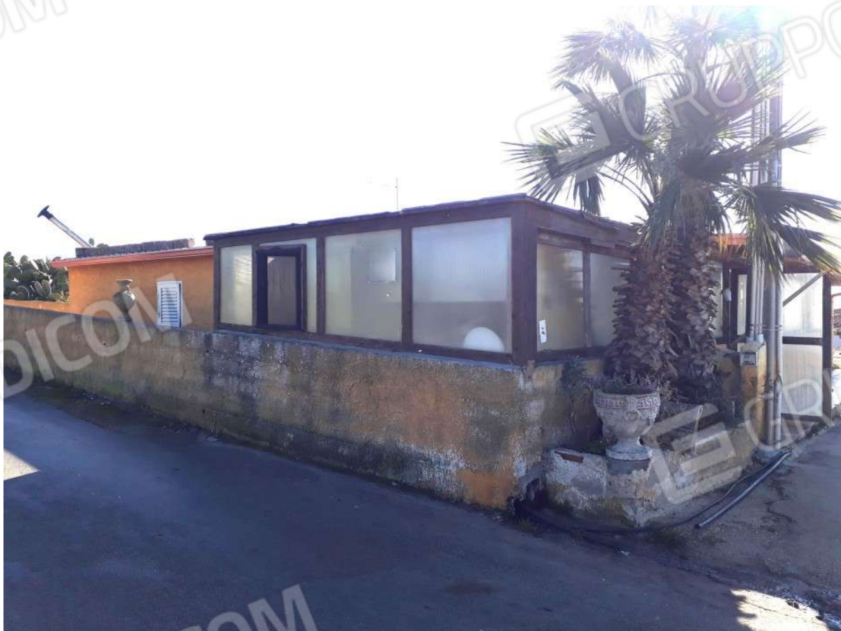
Foto 1, 2 e 3 – Bene B (confini abitazione porzione nord del lotto).