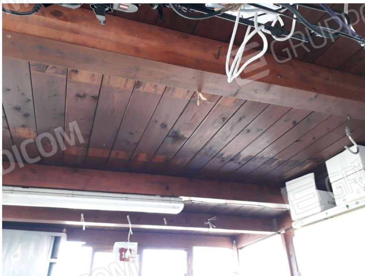
Foto 13 e 14 – Ampliamento abusivo della veranda e particolare del tetto.