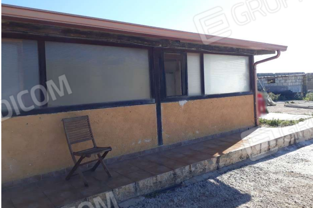
Foto 6 e 7 – Prospetto sud abitazione e particolari del lato ovest con chiusura della veranda.