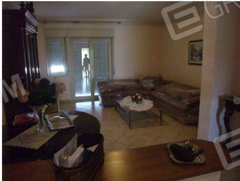
FOTO 6 - salone