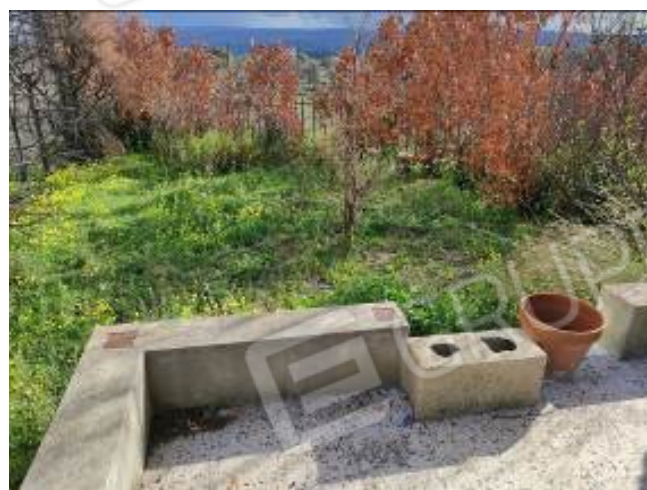
Foto 38,39,40,41,42,43. Balcone 2 e Terreno di pertinenza lato Est