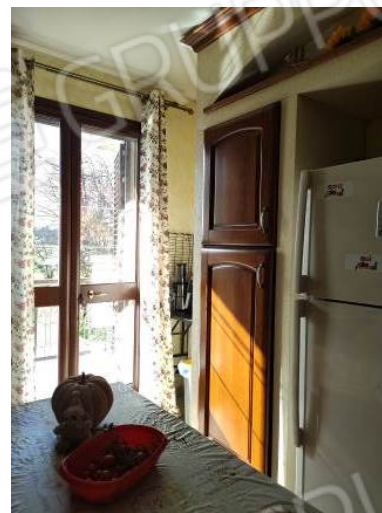
Foto 13,14,15,16. Cucina