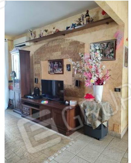
Foto 10,11,12. Salone