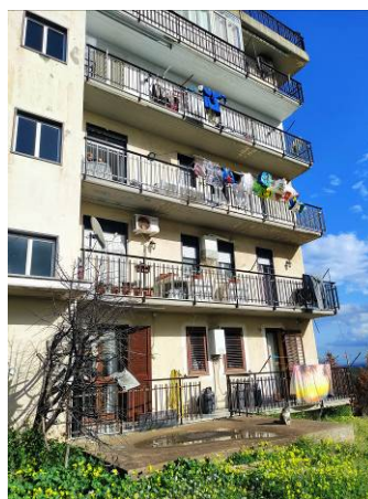
Foto 2,3,4. Fabbricato in cui è sito l'immobile