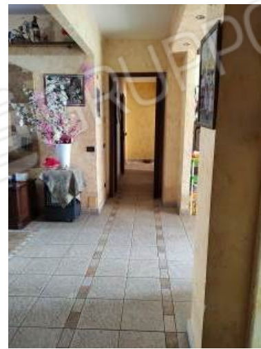
Foto 8,9. Ingresso appartamento