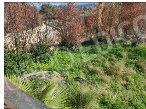
Foto 35,36,37. Terreno di pertinenza lato Ovest