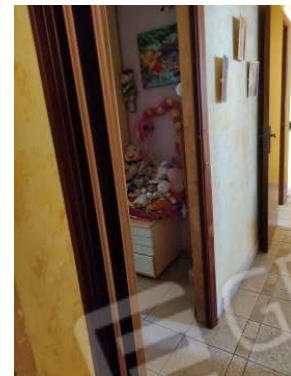
Foto 17,18,19. Disimpegno