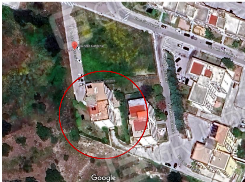
Foto 1. Inquadramento territoriale, fabbricato sito in via delle Gardenie n 3