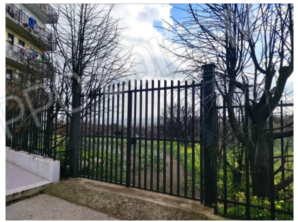
Foto 5,6,7. Ingresso fabbricato condominiale, ingresso appartamento e ingresso lotto di pertinenza lato Ovest