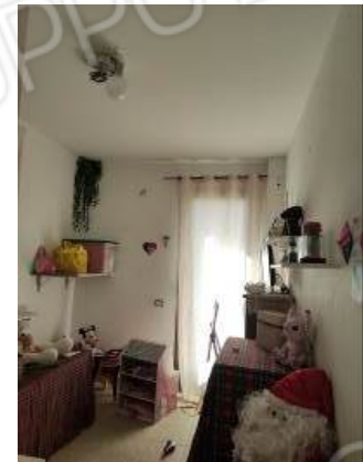
Foto 24,25,26. Camere 1 e 2