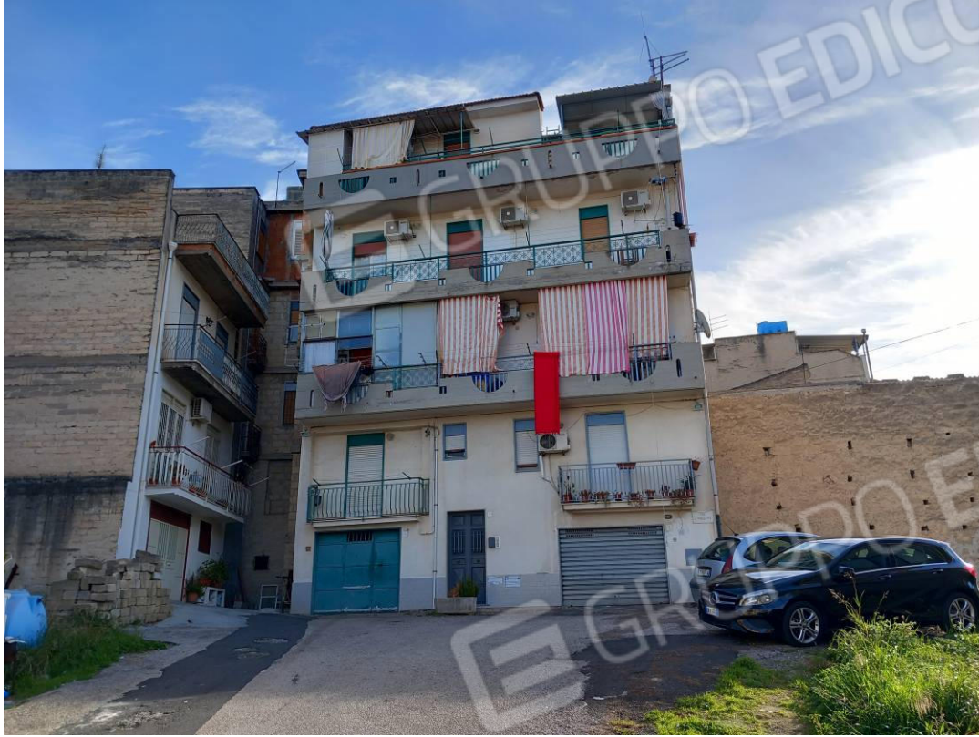
Foto 1: Vista della palazzina sita nella Via Palmiro Togliatti n. 4 (prospetto principale)