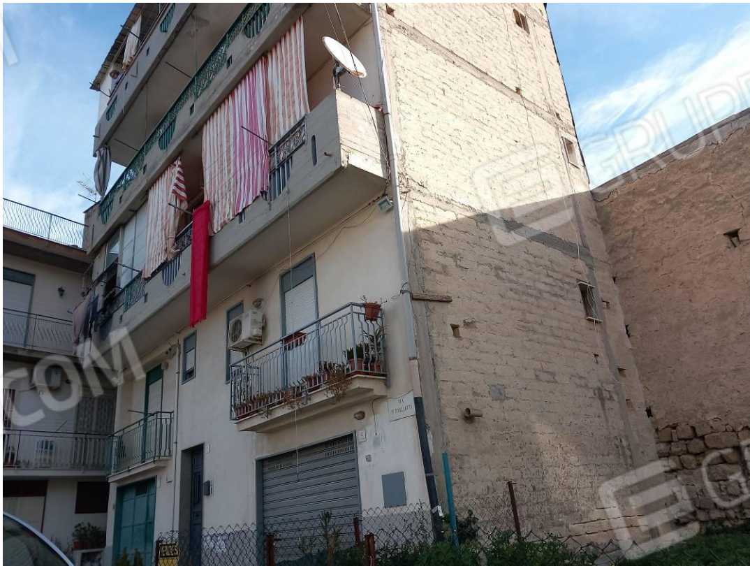
Foto 2: Vista della palazzina sita nella Via Palmiro Togliatti n. 4 (prospetto laterale)