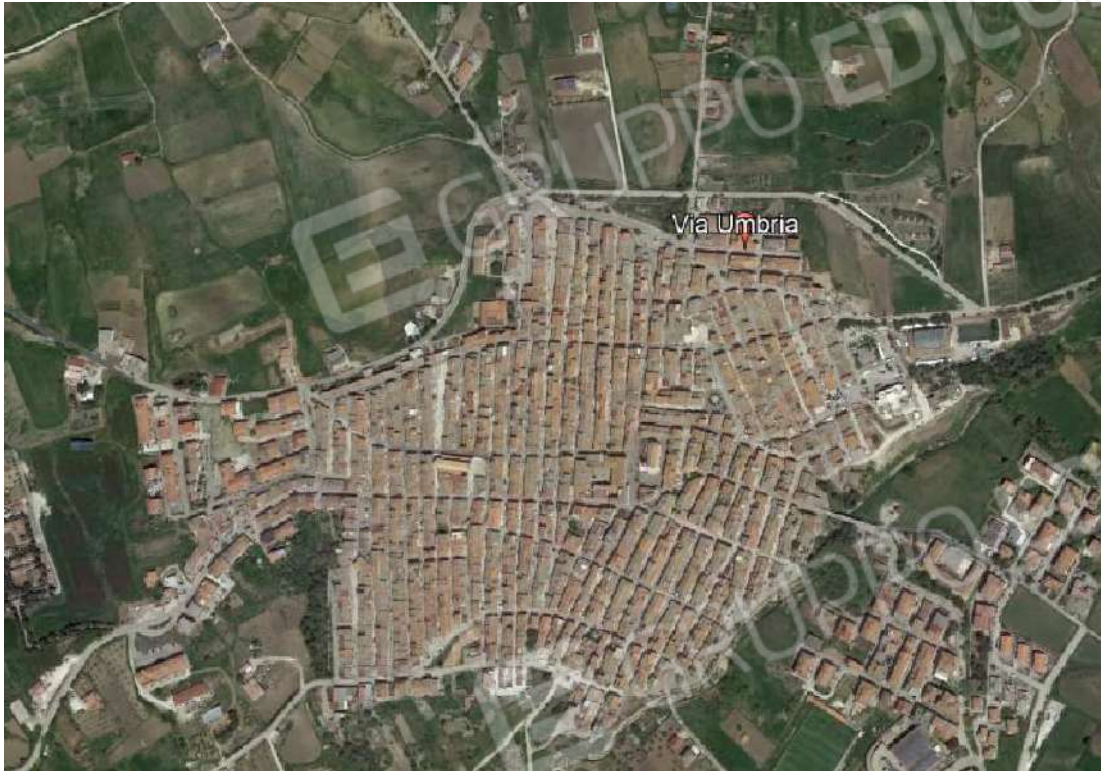
Fig.3 - Immagine acquisita da Google Earth - Individuazione dell'immobile