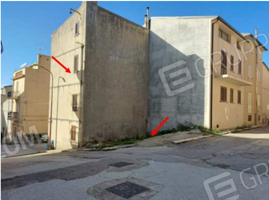
Foto 1- Via Umbria angolo Via S. Vincenzo – Indicazione dell'area edificabile e dell'immobile confinante oggetto di pignoramento LOTTO 1