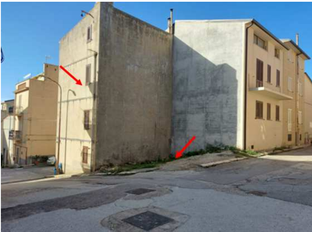
Foto 1- Via Umbria angolo Via S. Vincenzo – Indicazione dell'area edificabile e dell'immobile confinante oggetto di pignoramento LOTTO 1