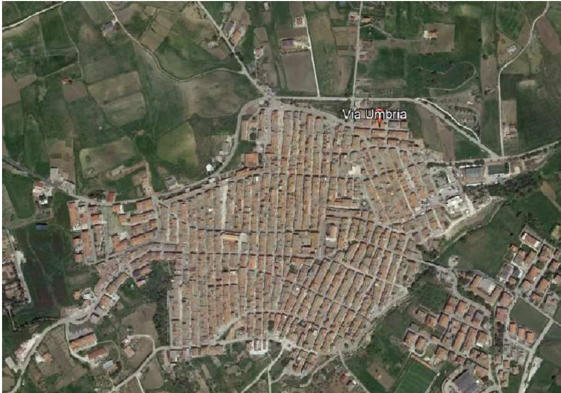
Fig.3 - Immagine acquisita da Google Earth - Individuazione dell'immobile