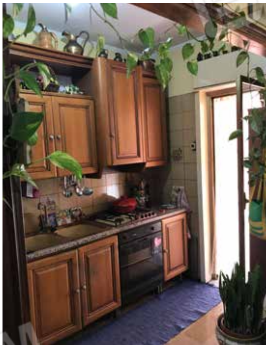
Foto 17. Cucina comunicante con il vano soggiorno.