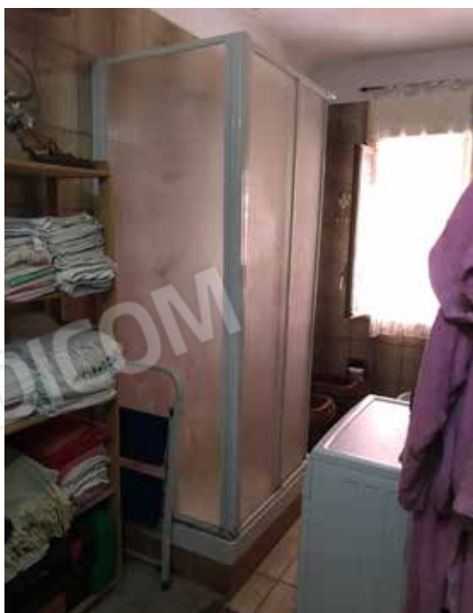
Foto 15. Servizio igienico.