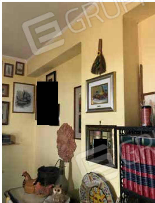
Foto 20. Vano soggiorno.