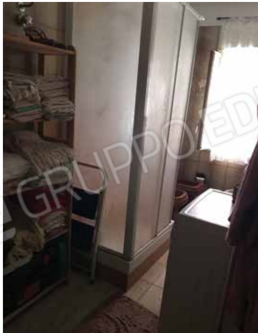
Foto 14. Servizio igienico.