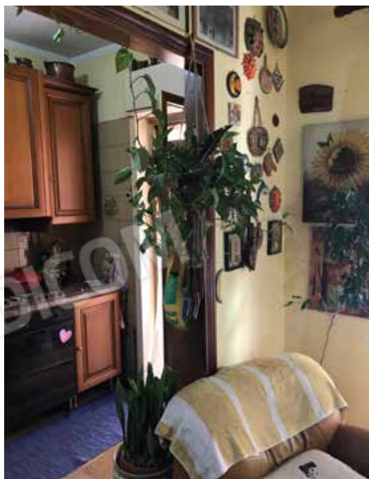
Foto 19. Cucina comunicante con il vano soggiorno.