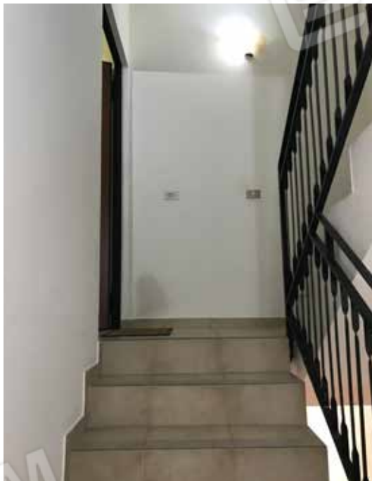
Foto 5. Ingresso all'unità immobiliare dal vano scala.