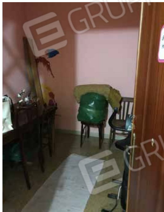
Foto 16. Ripostiglio.