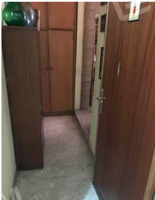
Foto 13. Servizio igienico.