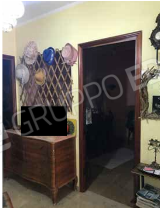
Foto 6. Disimpegno.