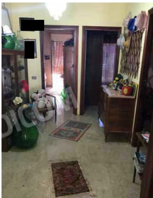
Foto 7. Disimpegno.