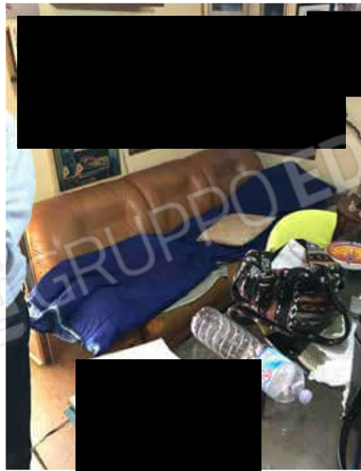
Foto 18. Vano soggiorno.