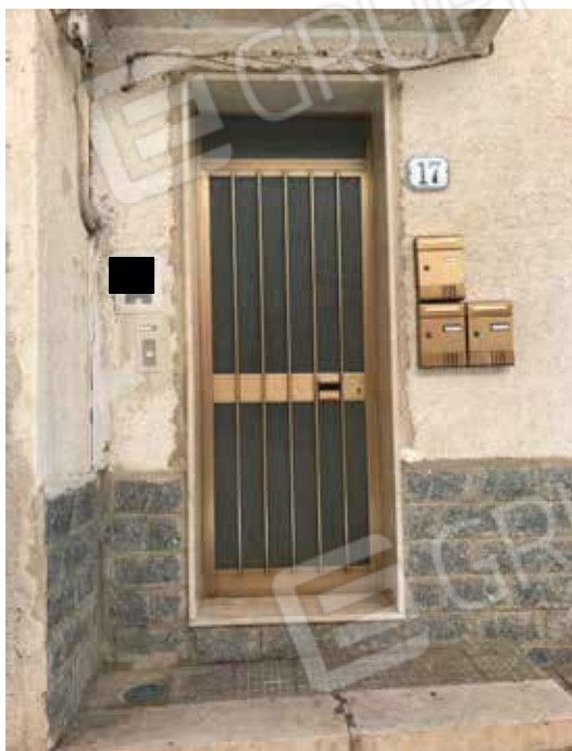
Foto 3 e 4. Prospetto principale su via Alcide De Gaspari, ingresso al civico n°17.