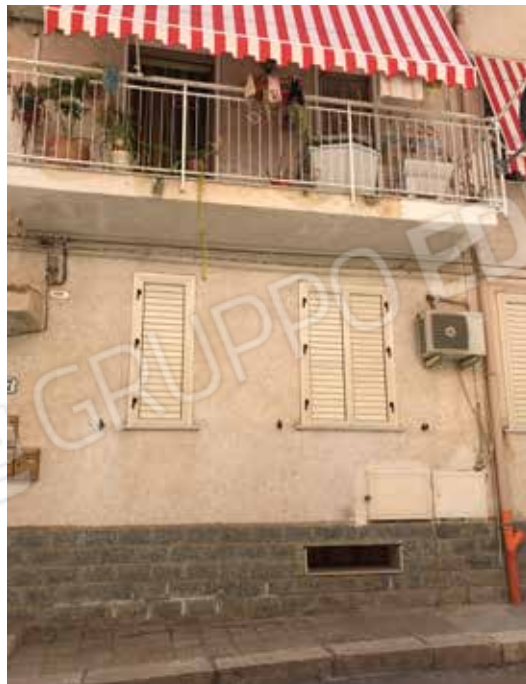
Foto 1 e 2. Prospetto principale su via Alcide De Gaspari, ingresso al civico n°17.