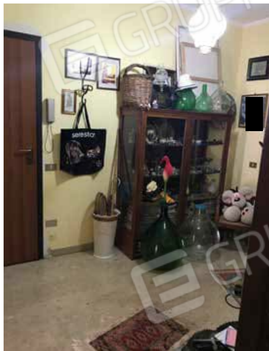
Foto 8. Disimpegno.