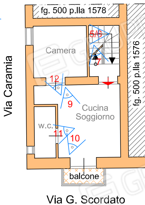
PLANIMETRIA PIANO PRIMO