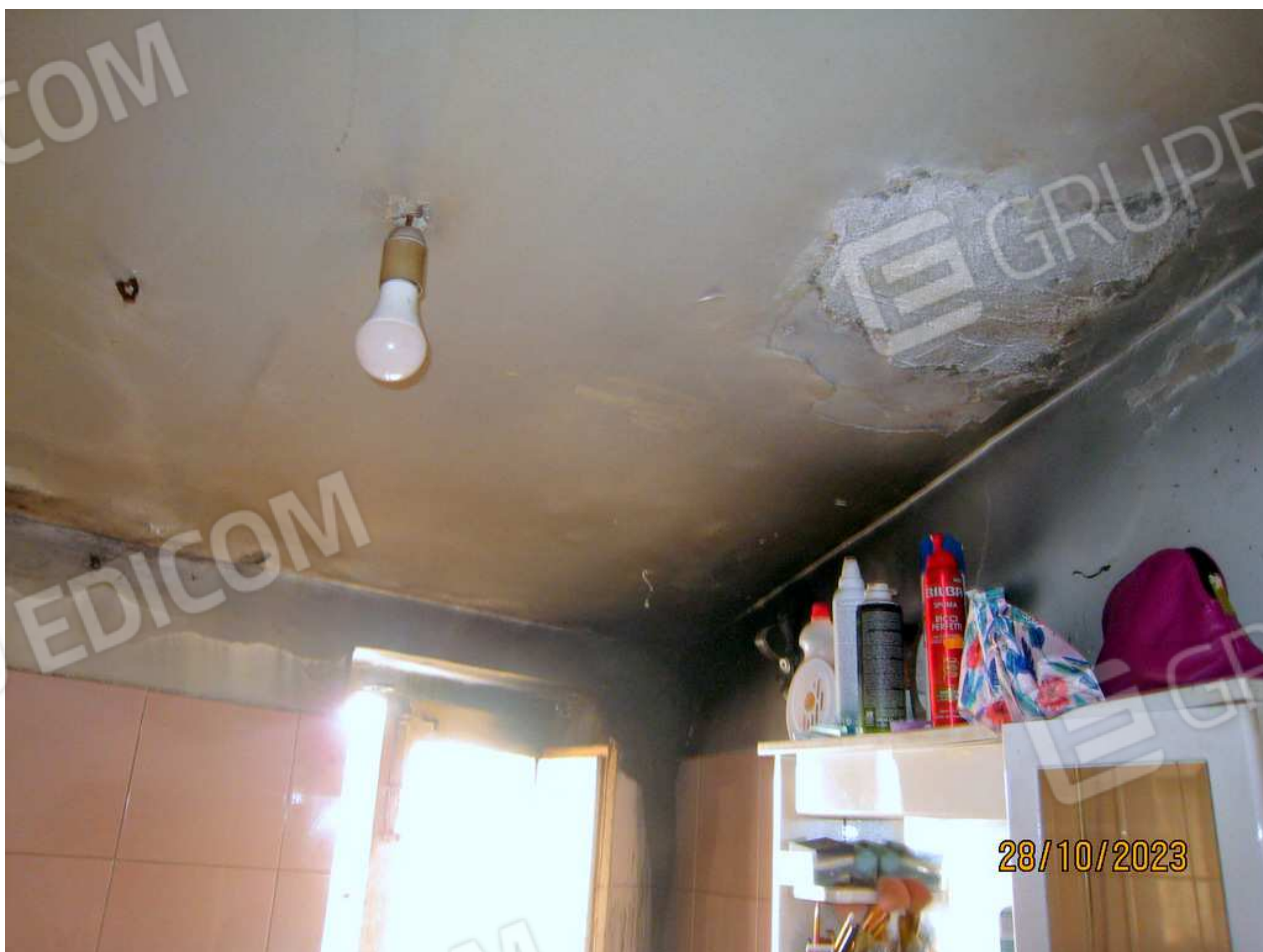
Foto n. 65. Dettaglio del tetto e delle pareti del w.c.