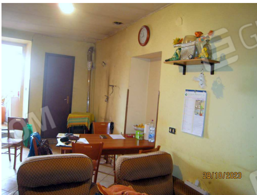
Foto n. 57-59. Scesa la scala si raggiunge la cucina (piano seminterrato) che viene mostrata attraverso queste tre fotografie.