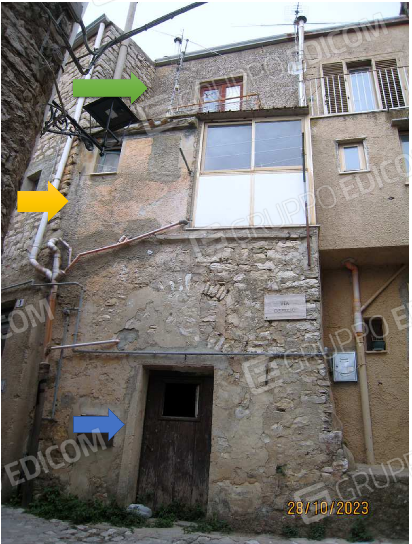
Foto n. 45. Il prospetto su Via Ospizio. La freccia verde segnala il P.T. rispetto alla Via S. Antonio; la freccia gialla il piano seminterrato rispetto alla Via S. Antonio. La freccia blu il piano terra su Via Ospizio indicato nella planimetria catastale del 1962, ma non in possesso della debitrice, come ha dichiarato durante il primo accesso.