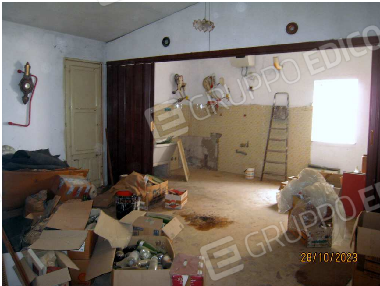
Foto n. 32. La stanza con il relativo terrazzo sopra la grande camera da letto del 1° piano. Essa è stata divisa in due parti da una lunga porta a soffietto. Si configura come una sorta di lavanderia.