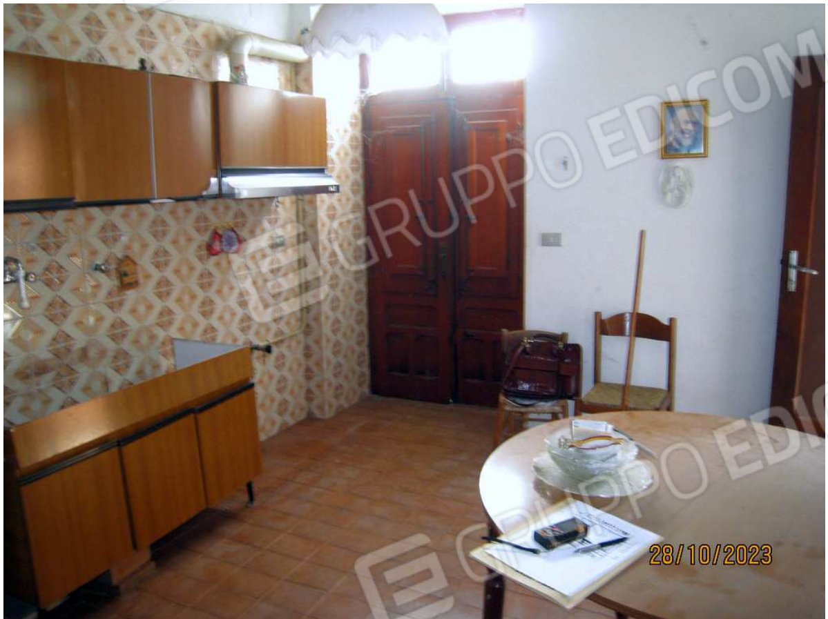
Foto n. 8. La cucina al Piano Terra con accesso dalla persiana, vedi la foto n. 2.