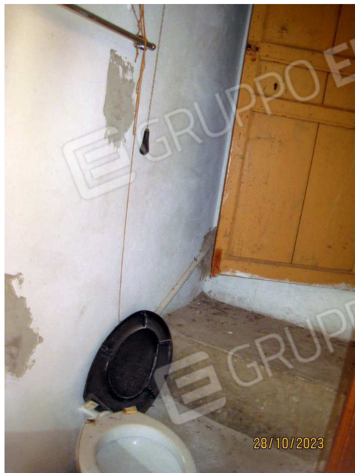
Foto n. 30-31. Il piccolo w.c. ricavato nel sopra scala della stanza.