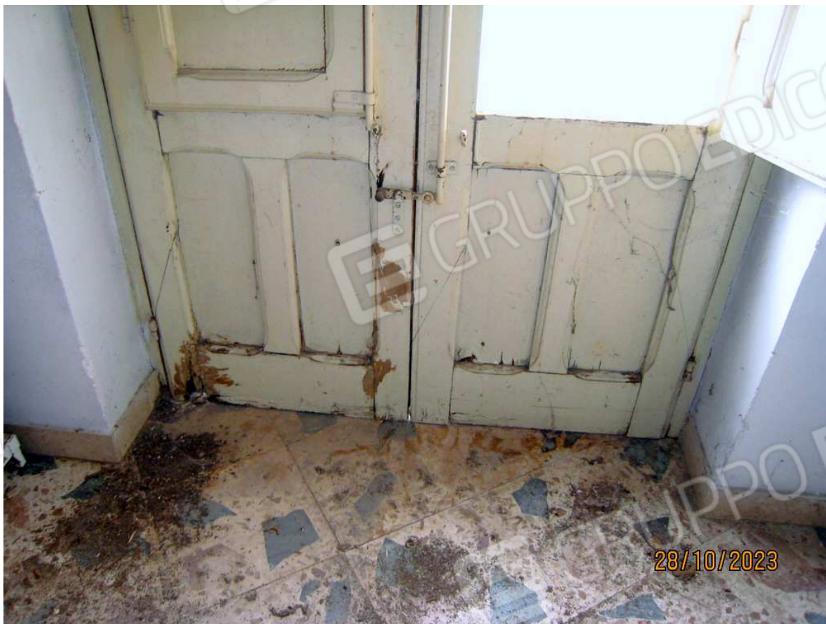
foto n. 29. Anche l'infisso è in cattive condizioni.