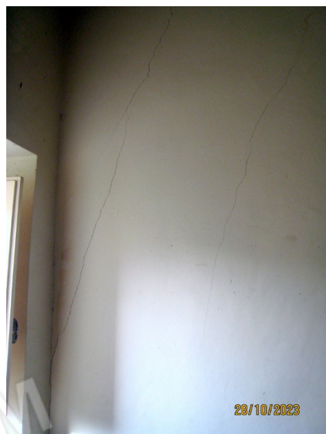
Foto n. 20-21. Sulle pareti di questa stanza si notano diverse lesioni.