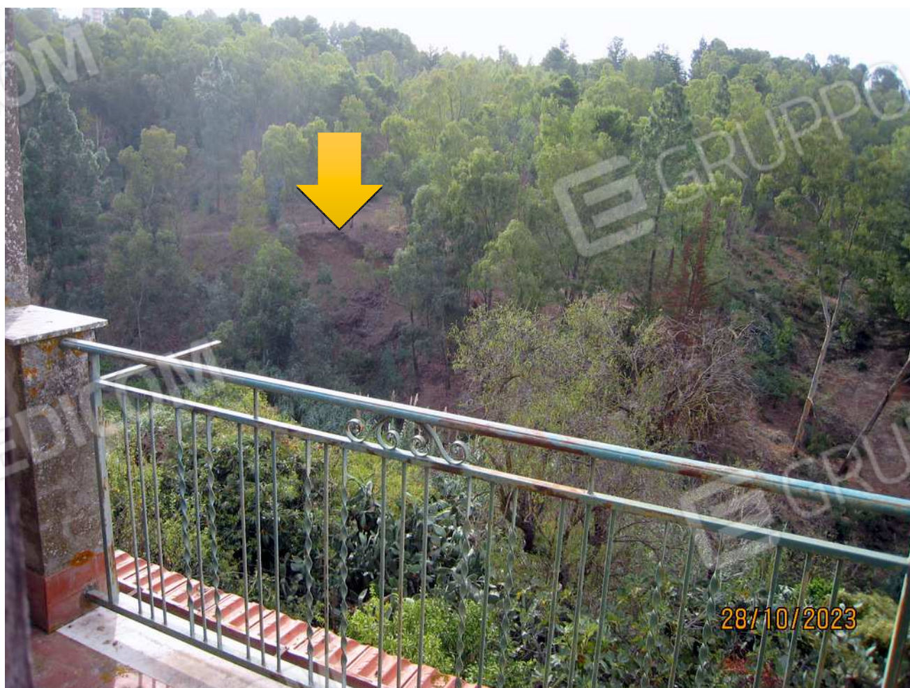
Foto n. 7. Il terreno di rimpetto al fabbricato, sull'argine opposto del torrente, è in frana.