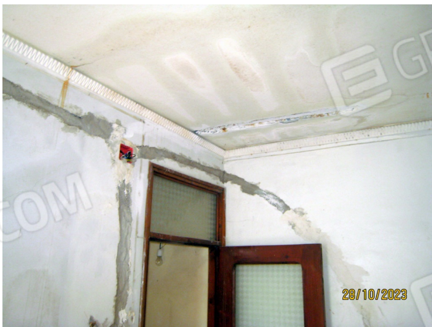
Foto n. 26-28. Le condizioni del tetto sono chiaramente restituite dalle tre fotografie.