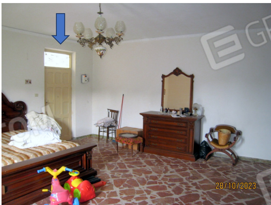
foto n. 16. L'accesso sulla Via Dionisio.