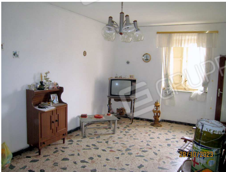
Foto n. 18-19. L'altra camera al primo piano è una sorta di soggiorno. Da essa si riprende la scala che conduce al 2° piano.