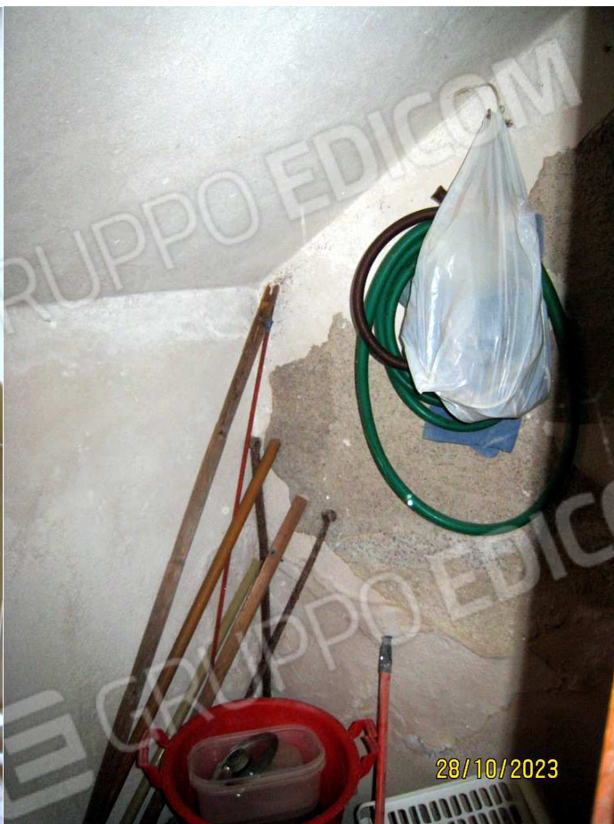
Foto n. 12. Il ripostiglio nel sotto scala del P.T.