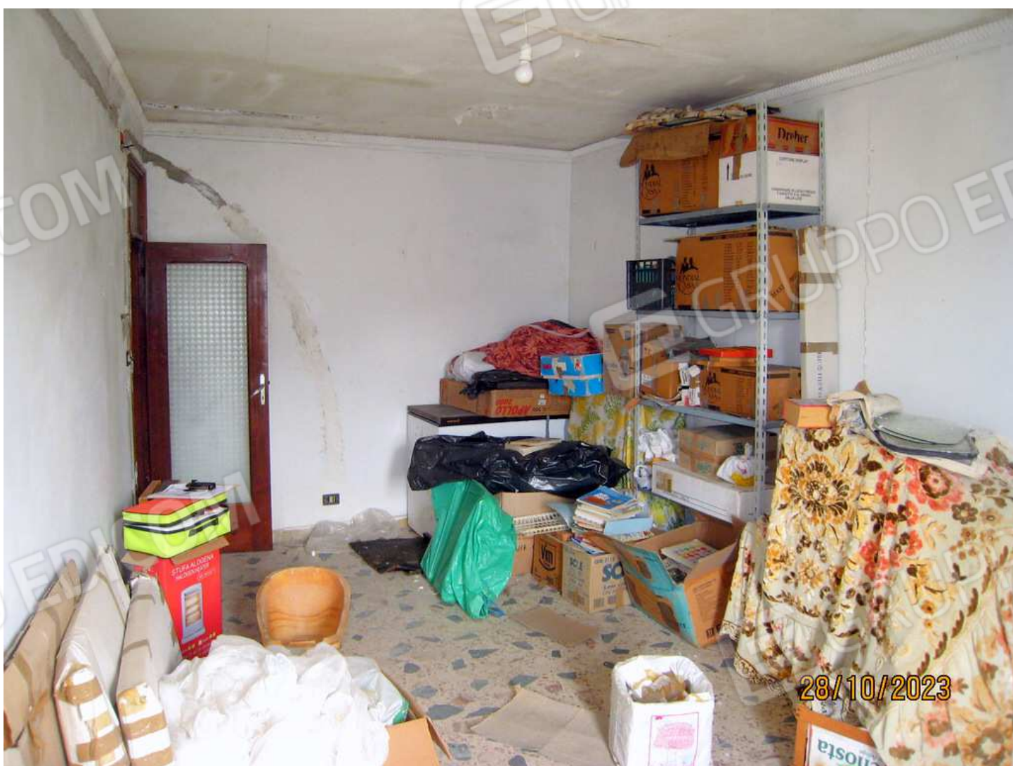
Foto n. 25. Le condizioni del tetto non sono buone a causa di infiltrazioni d'acqua dal tetto.