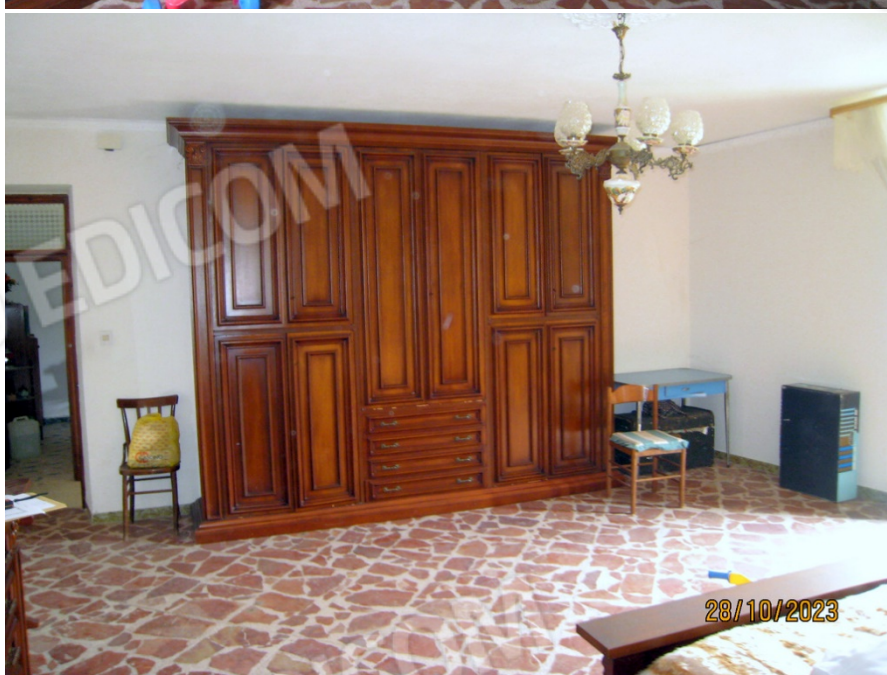
foto n. 17. Sempre la camera matrimoniale.