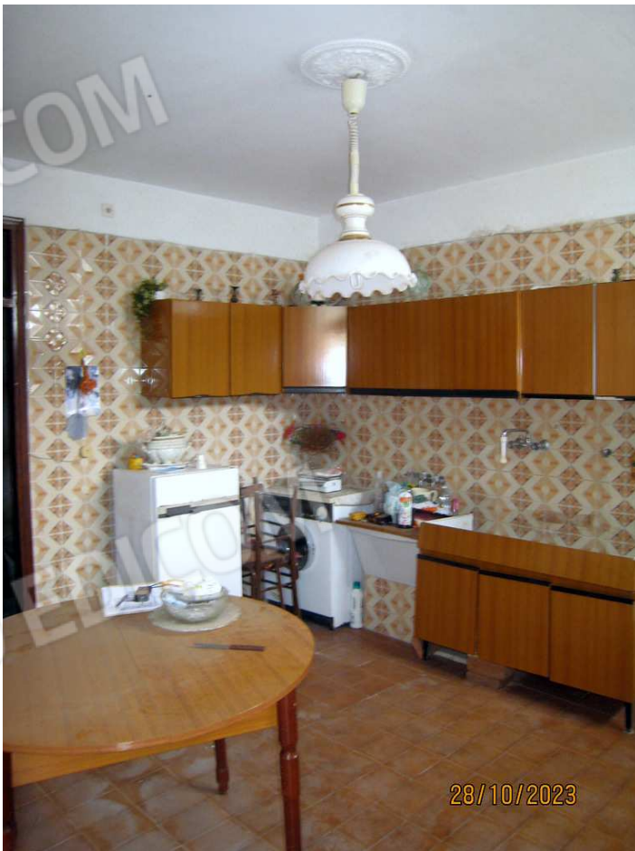
Foto n. 9. Altra immagine della cucina.