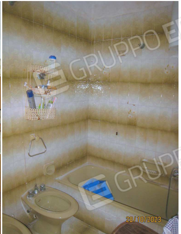
Foto n. 10. Il w.c. accessibile direttamente dalla cucina.