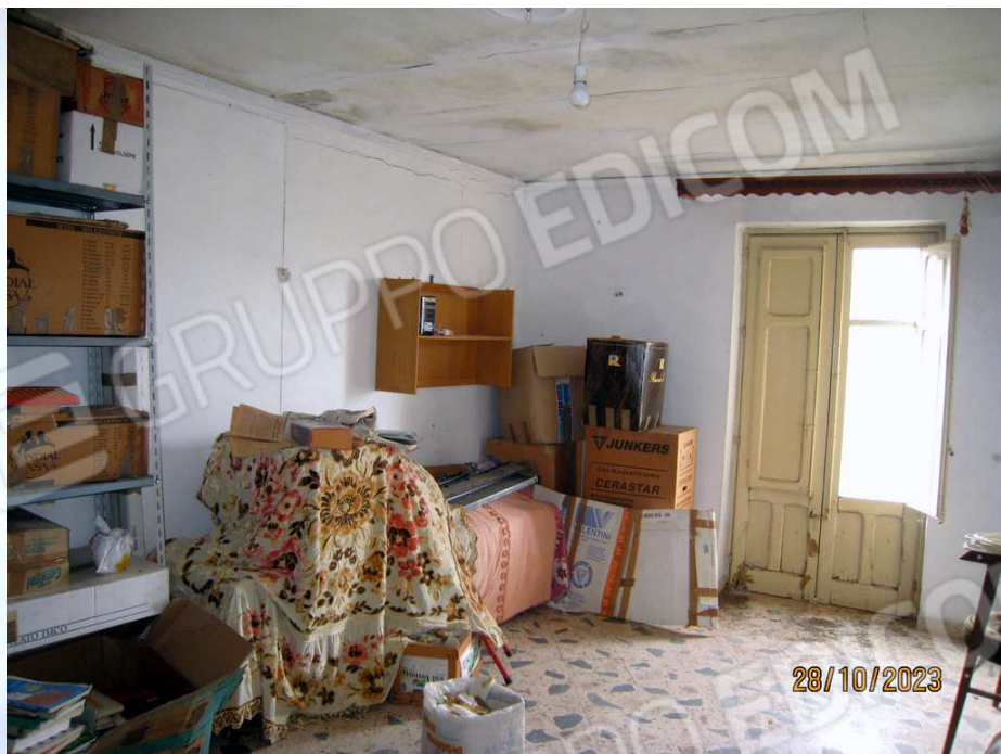
Foto n. 22. La rampa che porta al 2° piano. Foto n. 23. La stanza sopra il soggiorno, quella che ha il balcone crollato.