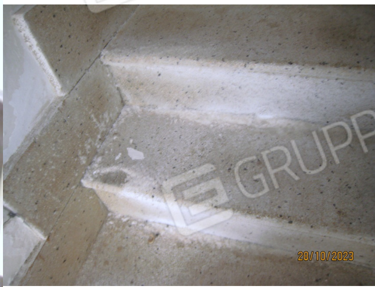
Foto n. 14. Dettaglio dell'umidità di risalita anche nella scala.