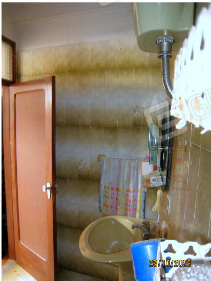
Foto n. 11. Altra immagine del bagno, opposta alla precedente.