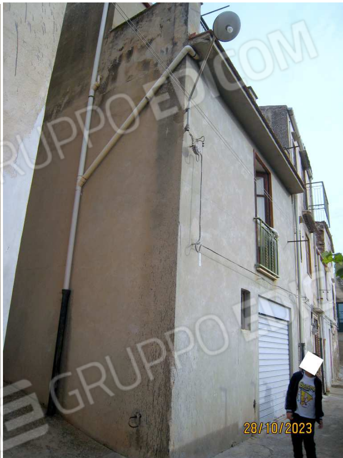
Foto n. 5. Prospetto su Via Dionisio con l'accesso secondario.