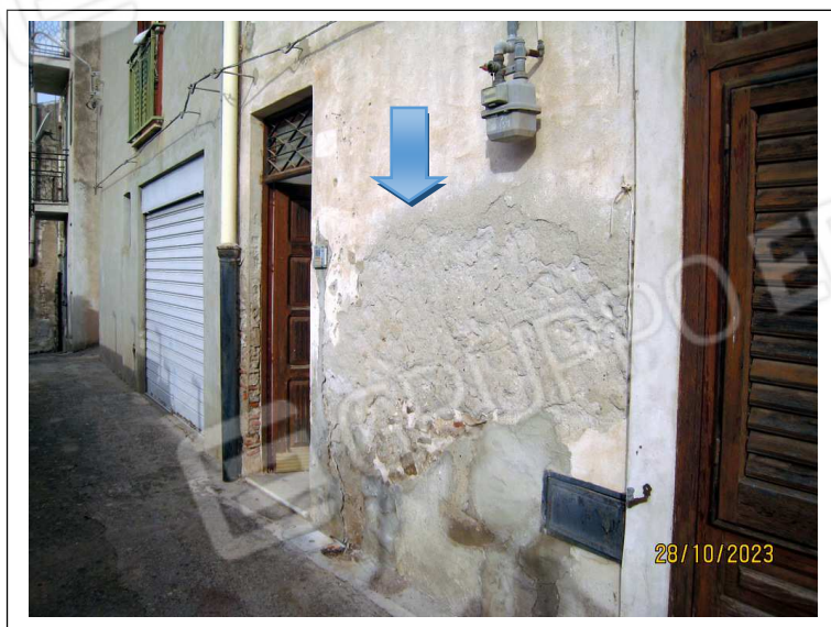
Foto n. 2-4. Il prospetto su Via Stesicoro con il dettaglio dell'umidità ascendente nella parte basamentale e del balcone crollato al secondo piano.